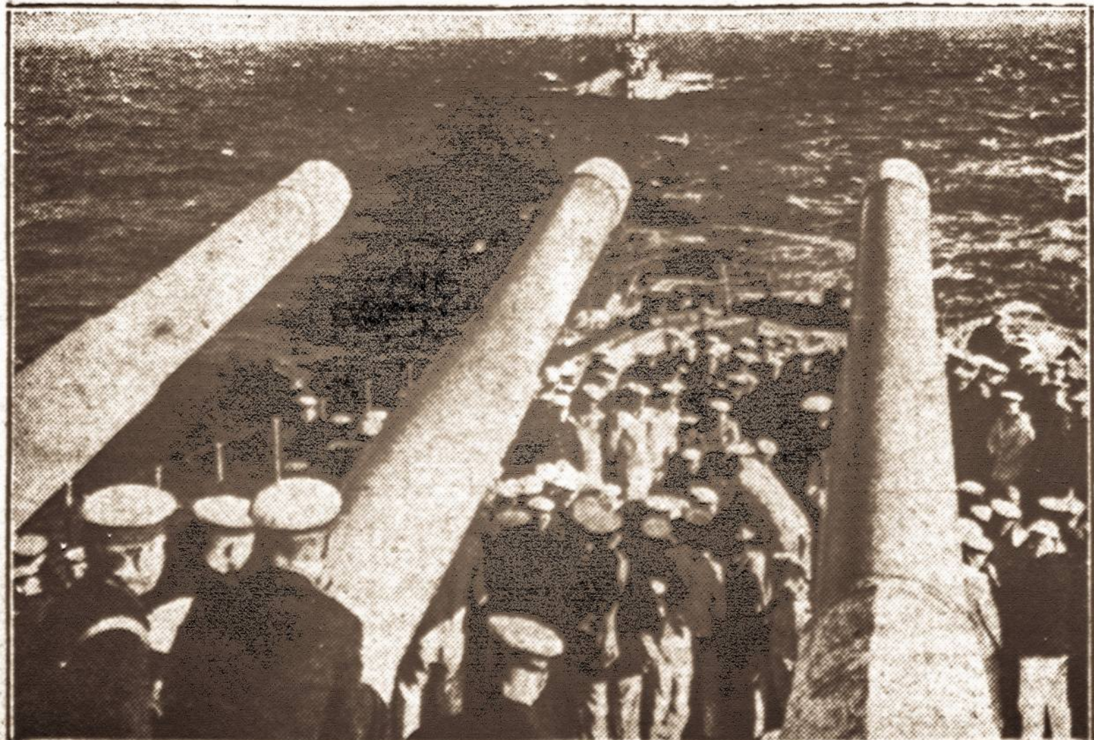
Nukreiptos į pietus. — Sovietų karo laivų didžiosios kanuolės nukreiptos Pietų link, kur koncentruojamos alijantų kariuomenės.

LONDON, balandžio 17 d. — Pranešama iš Stockholmo, kad patikimas keleivis iš Norvegijos savo akimis matęs Vokietijos didįjį karo laivą Scharnhorst, 26,000 tonų talpumo, sugadintą netoli Trondheimo, užtakoje Rissa. Laivo užpakalis esąs vandenio apsemtas. Priešakyje guli ant sekluomos.