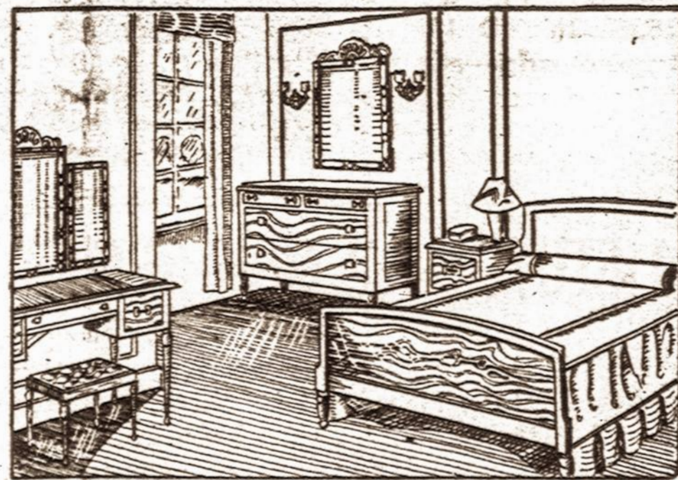
Taip nupigintomis kainomis parduodame įvairius rakandus. Pasirinkimas didelis.

BEDROOM SETS — PARLOR SETS STUDIO COUCHES — KITCHEN SETS DINETTE SETS, MATRASAI IR SPRINGSAI