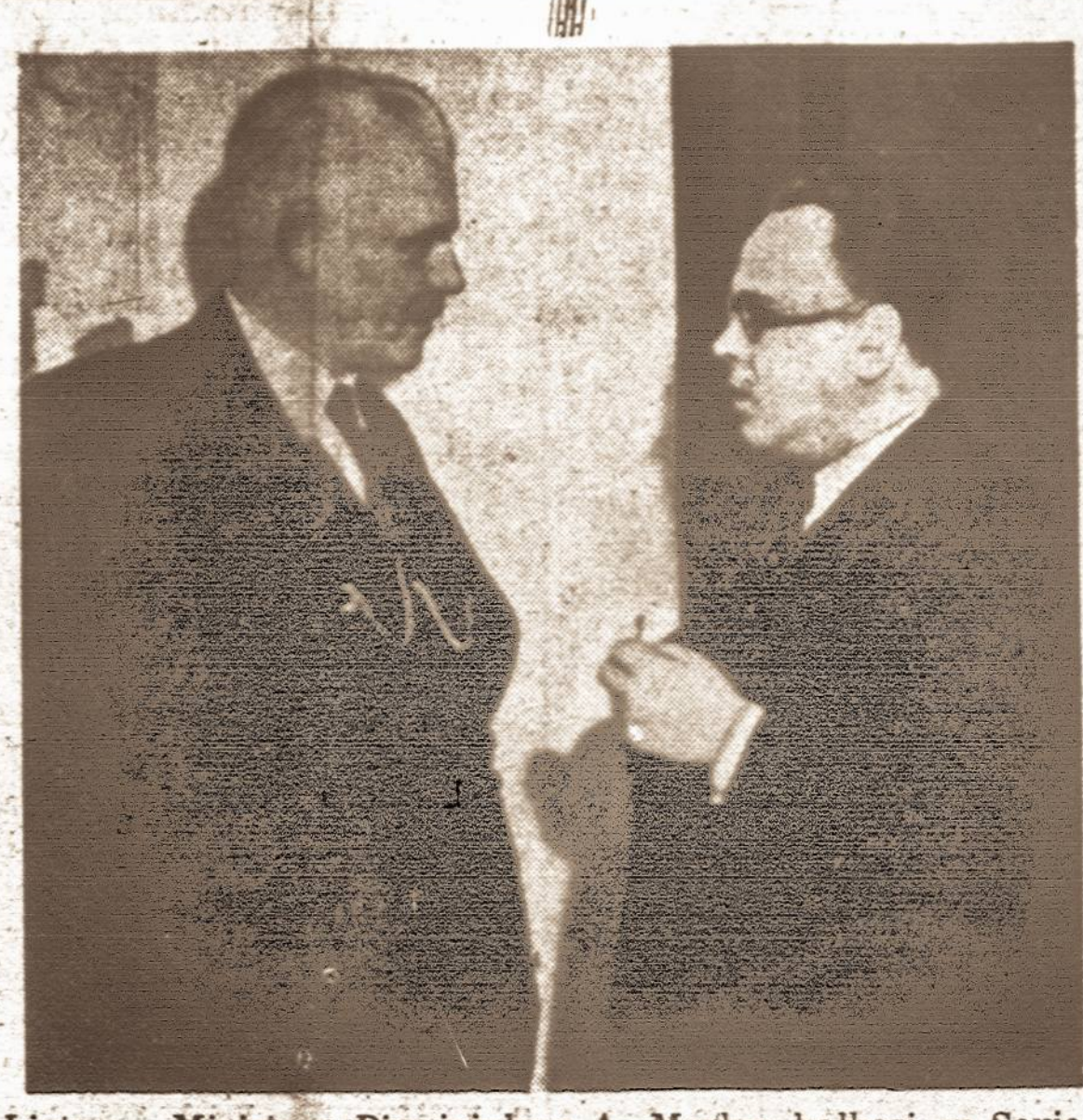
Lietuvos Ministras Pirmininkas A. Merkys kalbasi su Sovietų Sąjungos įgaliotu ministru Lietuvai N. Pozdniakovu.

● Šį pavasarį sueina 910 metų nuo Kauno miesto įkūrimo. Dabar Kaune yra apie 10,000 pastatų ir gyvena apie 140,000 gyventojų.