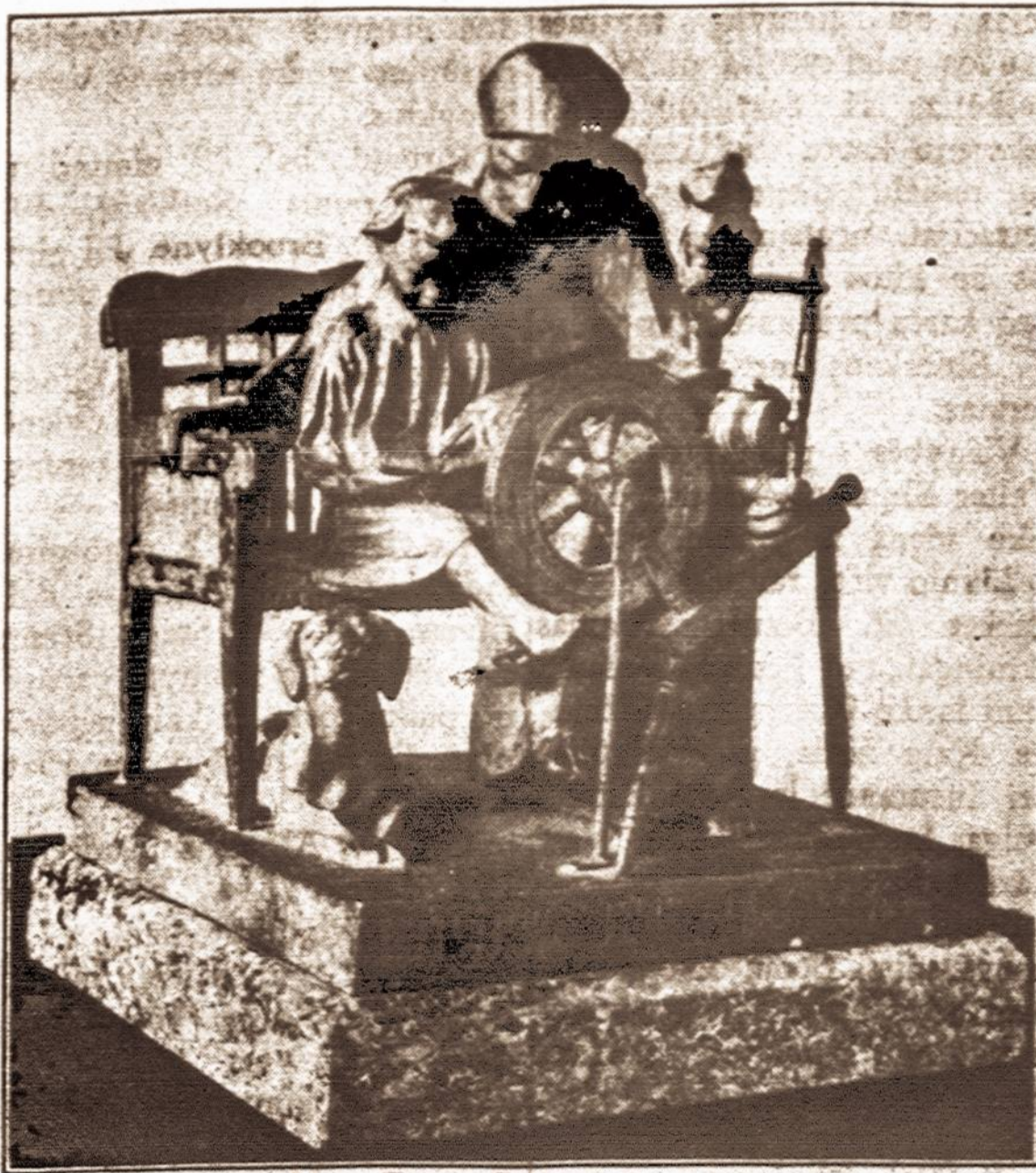
Petro Rimšos "Vargo Mokykla"