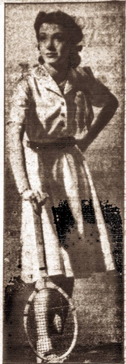
RKO filmų artistė Marsha Hunt naujame teniso kostiume.

I'm not going to do either. I'm going to start beating the drum for a new slogan: "The Yanks aren't going Over There, but they'll be ready for anyone coming Over Here!"