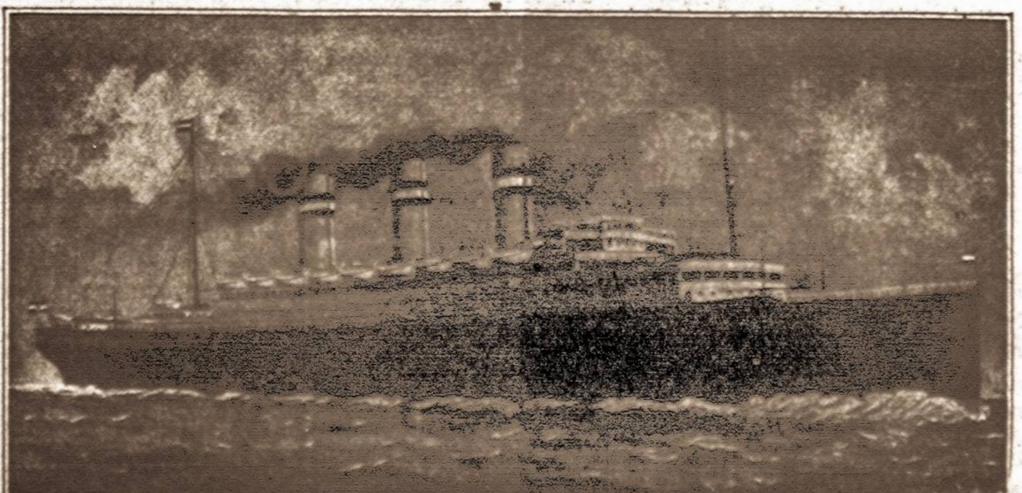
STATENDAM. — Nepatikrintomis radio žiniomis pranešama, kad Olandų-Amerikos Linijos puikusis keleivinis laivas Statendam vokiečių bombomis sudėgintas Rotterdam uoste.

Majoras La Guardia ir Hollander indorsavo trečiajai prezidento tarnybai Rooseveltui.