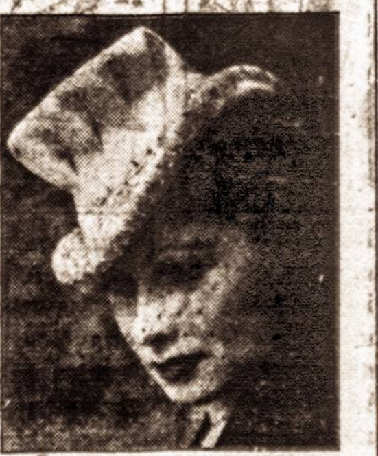
Artistė Lucille Ball demonstruoja naują baltą veltinę skrybėlaitę.

Prie tokios avienos tinka duoti įvairių daržovių.