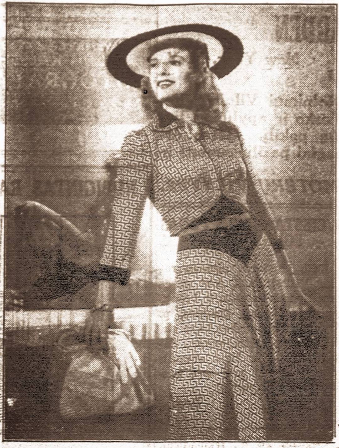
Anne Neagle naujame pavasariniame ensamblyje