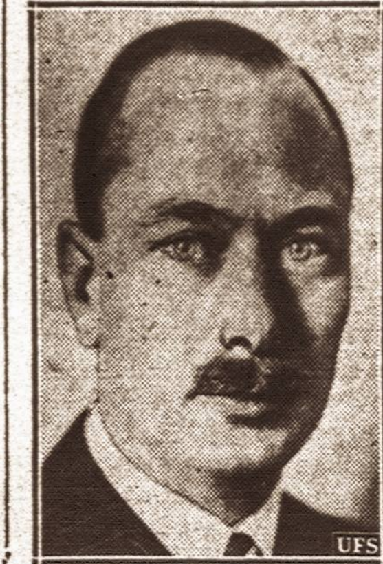
Sužeistas kare. — Anglijos karaliaus Jurgio brolis, Gloucesterio kunigaikštis sužeistas mūšyje su naciais Belgijos fronte.

Ūkininkų paramai paskirta 115 milijonų dol. šio šalį ir pusketvirto milijono dolerių Puerto Rico.