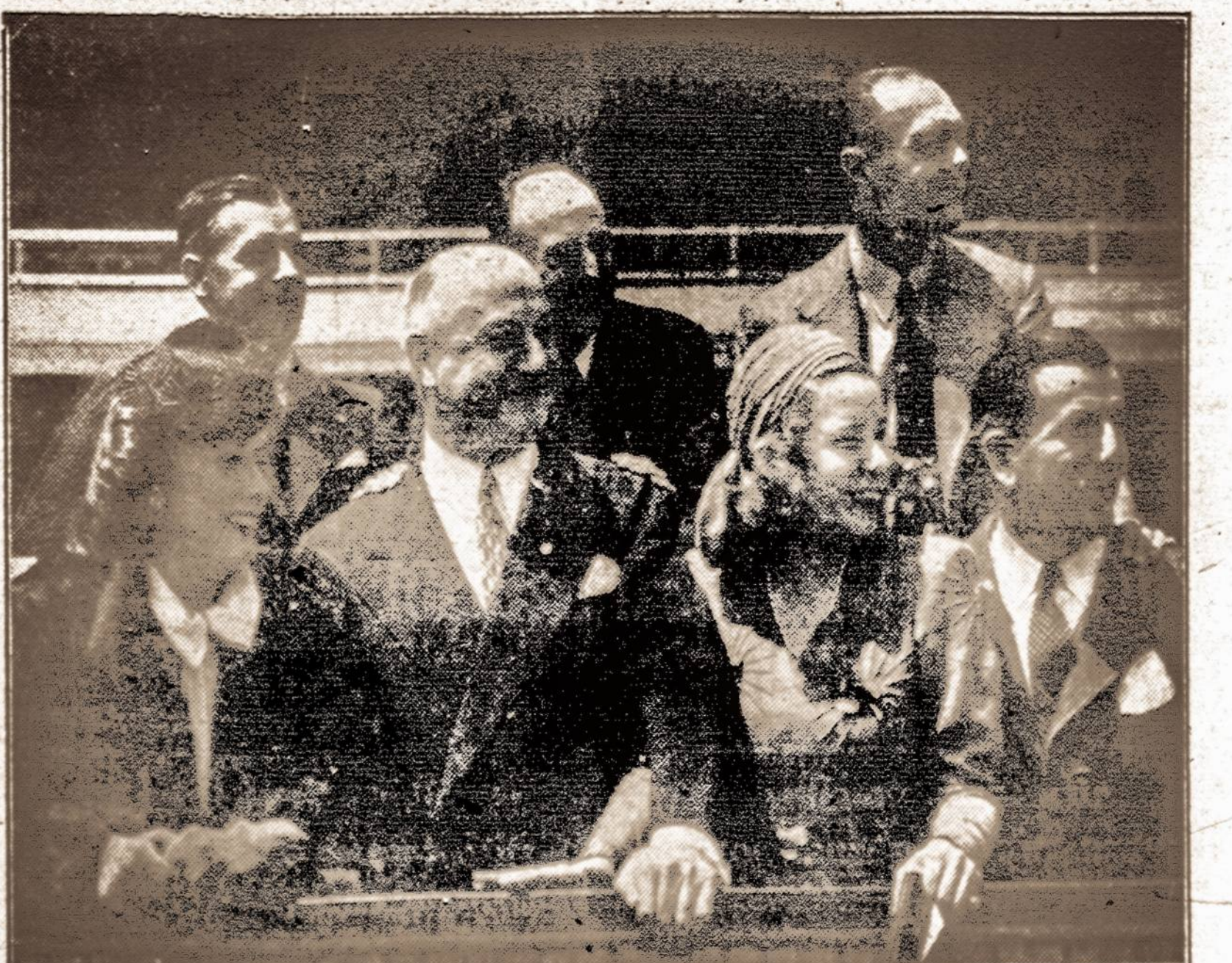
Džiaugiasi arklų lenktynėmis. Jungtinių Valstybių Paštų Ministras (Postmaster General) Farley (nuotraukoje parodytas su draugėmis ir draugais — lenktynių entuziastais) daug prisidėjo prie lenktyninių lažybų legalizavimo New Yorko valstybėje. Dabar N. Y. valstybėje lažybos arklų lenktynėse nedraudžiamos.

Darbininkų unijos vadai neprimia korporacijos siūlomos sutarties dėl to, kad korporacija nežada bendro algų didinimo ir nepripažįsta skundų procedūros ir darbininkų reprezentacijos.