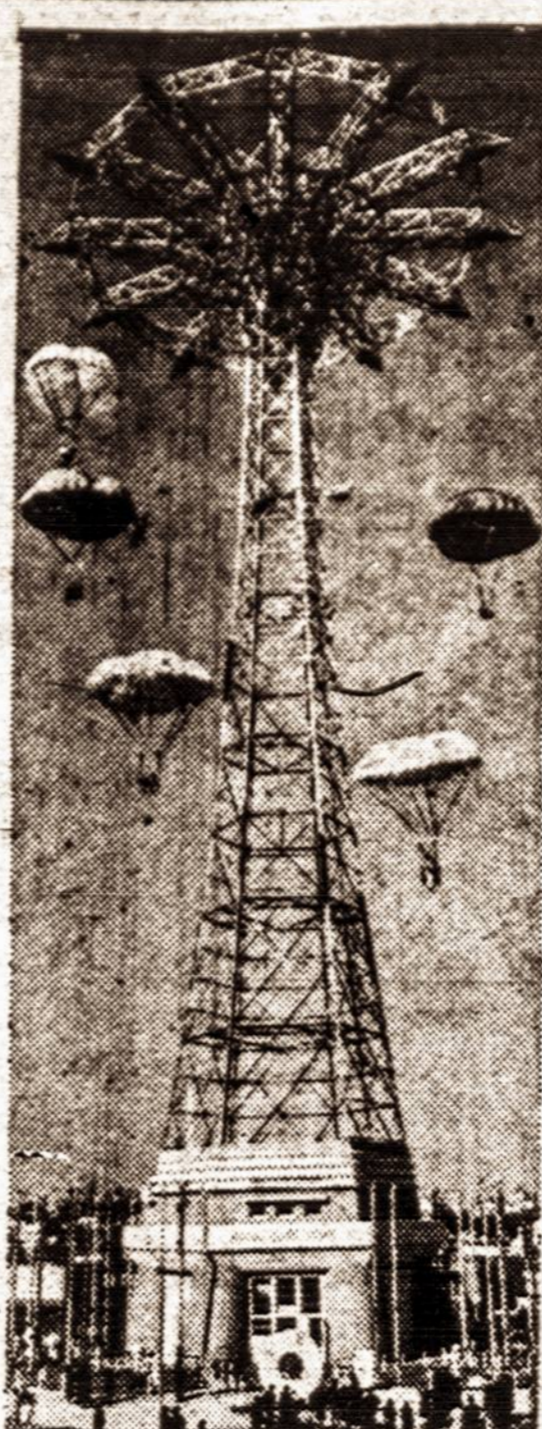
Parašytų-nusileidimo bokštas Pasaulinėje Parodoje. Dabar jis randasi perkeltas į kitą vietą ir perkelti kainavo $60,000.