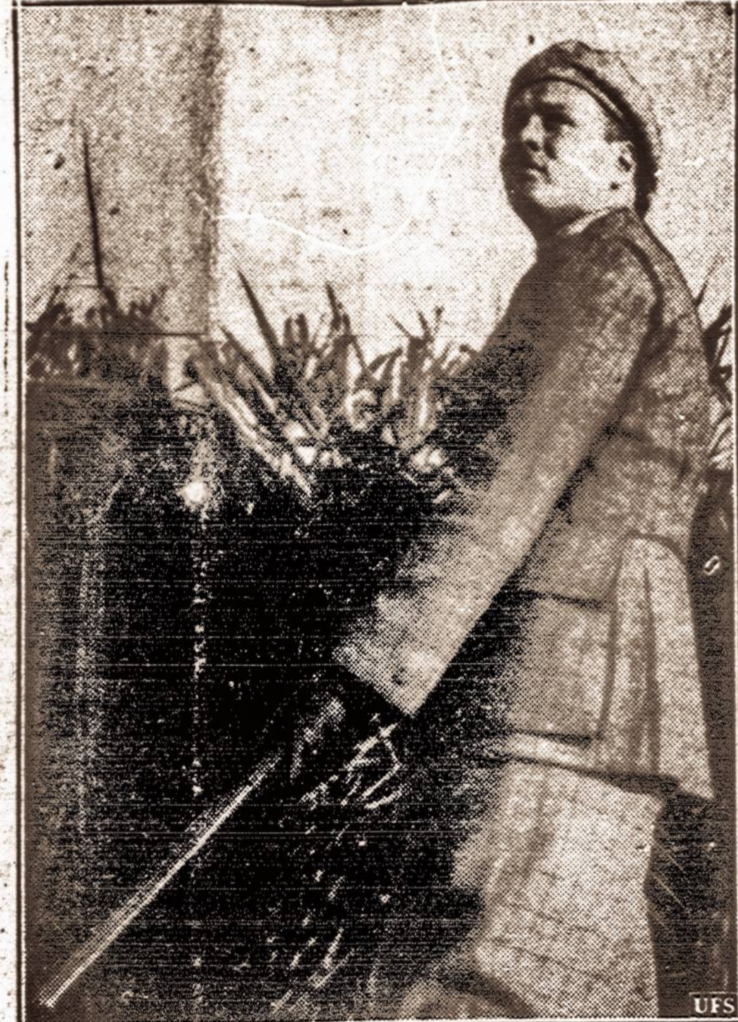
Egipto karalius Faruk, kuris pažadėjo visokeriopą paramą Anglijai.

● Galingosios radijo stoties statyba Lietuvoje ties Babilais jau baigiama. Dalis užsieniuose užsakytų mašinų gauta, o kitos dalies laukiama atsiunčiant.