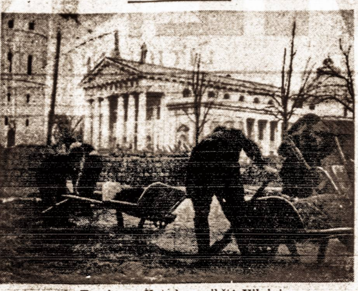
Tvarkoma Katedros aikštė Vilniuje