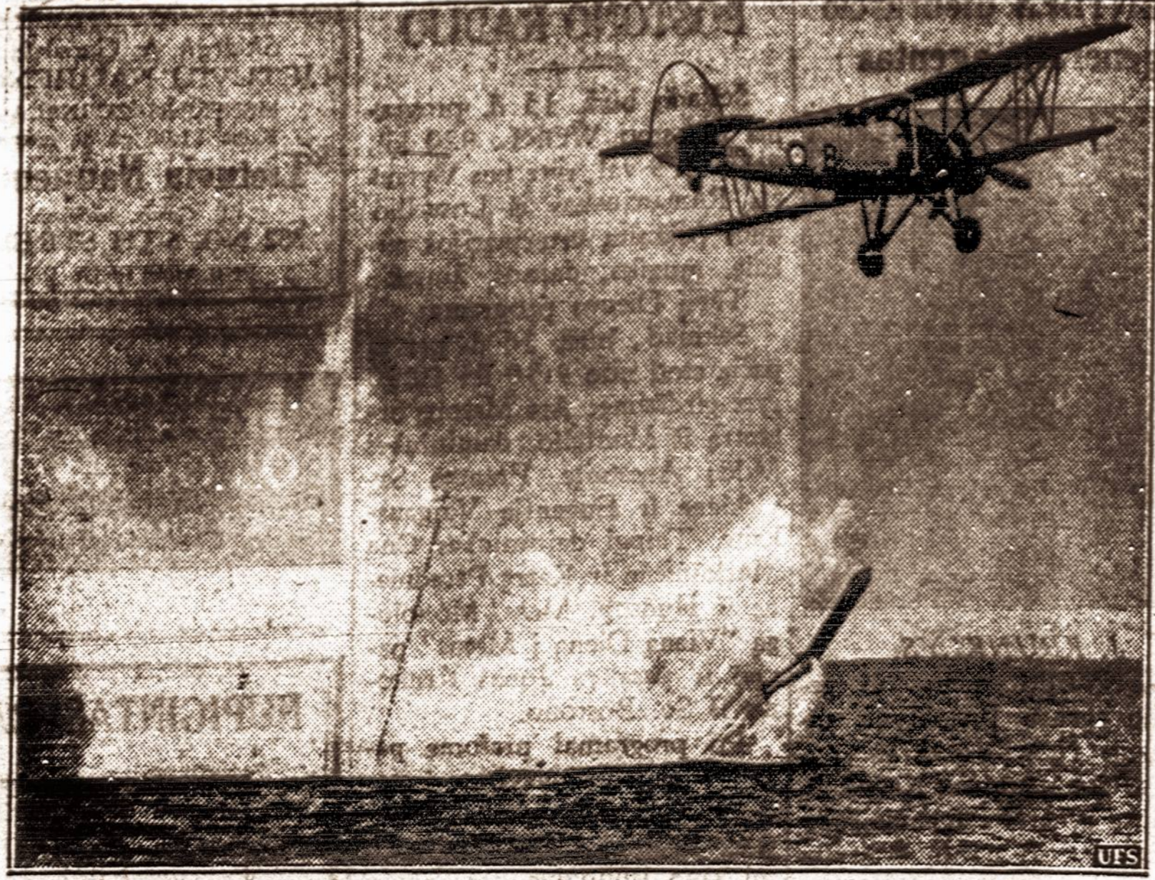
Anglų karo lėktuvus paleidžia torpedą

● Pavasario semestre Vilniaus universitete yra 1057 klausytojai.