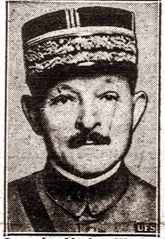
Generolas Maxime Weygand