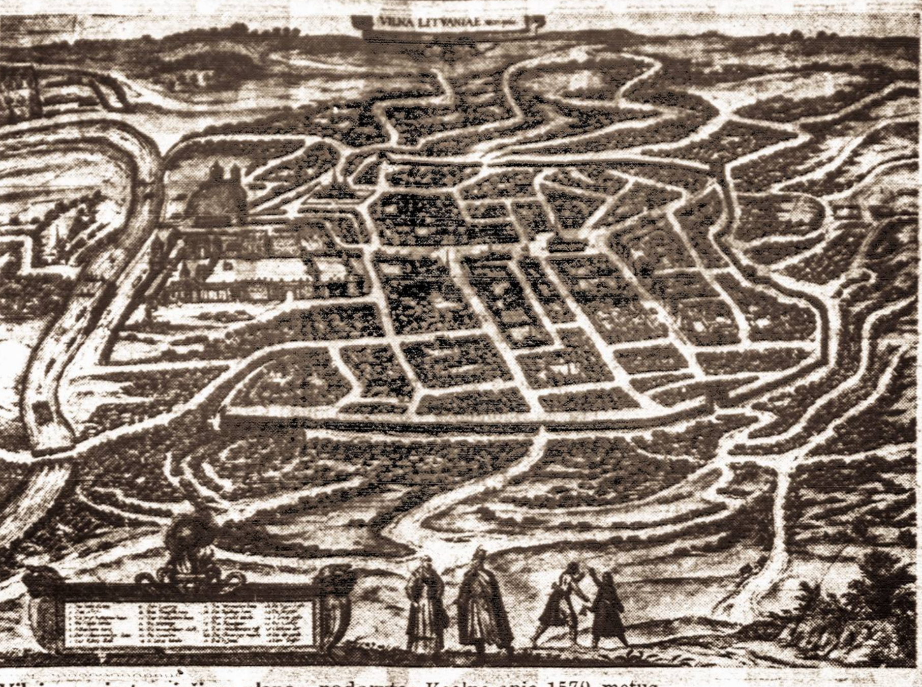
Vilniaus miesto piešinys-plana, padarytas Koelne apie 1570 metus

rai ir šiandien gauda lietuviškus penklėčius, kurių vienoje pusėje yra dr. Basanavičiaus atvaizdas. Nors sutarčių su Bulgarija jokių nepasirašyta, tačiau prekyba kai kuriais metais stėkė net arti milijono litų.