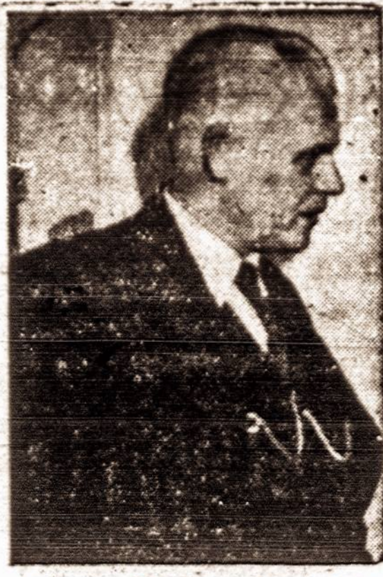
Antanas Merkys, buvęs Lietuvos Ministras Pirmininkas, laikinai paliktas Lietuvos Prezidento vietininku Lietuvoje, iki bus sudaryta nauja, "palanki Rusijai" Lietuvos vyriausybė.