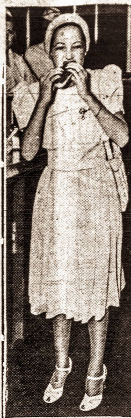
Pasivaikščiojus po Pasaulinę Parodą reikia ir pasitiprinti.

Advokatas 58 COURT STREET, Brooklyn, N. Y. TEL: TRIANGLE 3-622 168 GRAND STREET, TEL: EVERGREEN 8-719