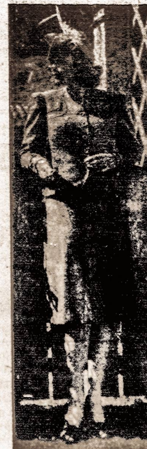
Naujausios mados moters kostiumas.