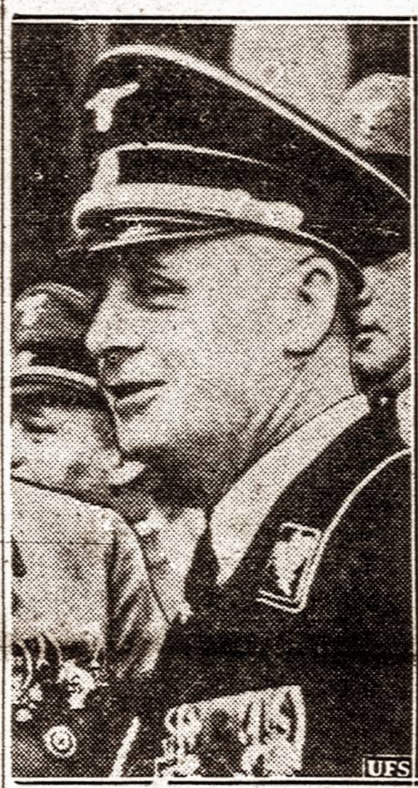
JOACHIM VON RIBBENTROP, Vokietijos užsienio reikalų ministras, atmetęs Jungtinių Valstybių pareiškimą apie Monroė Doktriną.

New Yorko Pasaulinė Paroda stipriai saugojama nuo bombininkų. Visi punda peržiūrimi net keletą kartų kasdien. Policija seka visus įtartinus asmenis.