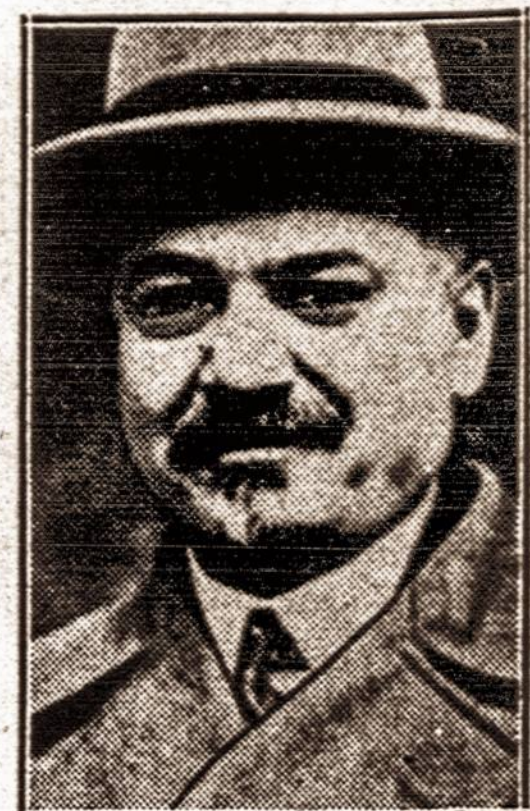
IVAN M. MAJSKIJ, Sovietų ambasadorius Londone, protestuoja dėl Lietuvos, Latvijos ir Estijos pinigų ir kreditų sulakymo.

Suimtinėjami tariami „liaudies priešai“, buvusieji valdininkai ir turtuoliai. Atimami brangumynai