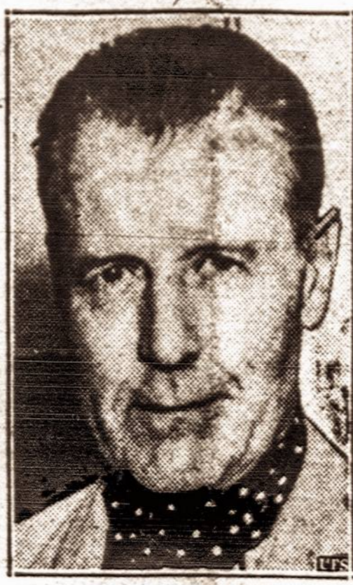
ATSAUKTAS. — Jungti- nių Amerikos Valstybių Pa- siuntinys Belgijoje John Cu- dahy State Departamento at- šauktas konsultacijai į Wash- ingtoną dėl to, kad jis eida- mas tarnybos pareigas palan- kiai atsiliepė apie vokiečių ka- riuomenę Belgijoje. Cudahy taip pat prašė Amerikos sius- ti maisto Belgijoje badaujan- tiems civiliniams gyventojams. Cudahy grįžta į Ameriką ke- leiviniu lėktuvu iš Portugalijos.

Ar Amerika patenkins šį Sovietų reikalavimą — dar ne- žinia. Sakoma, kad atstovybės turi būti atsauktos iki rugpiū- čio 25 d.