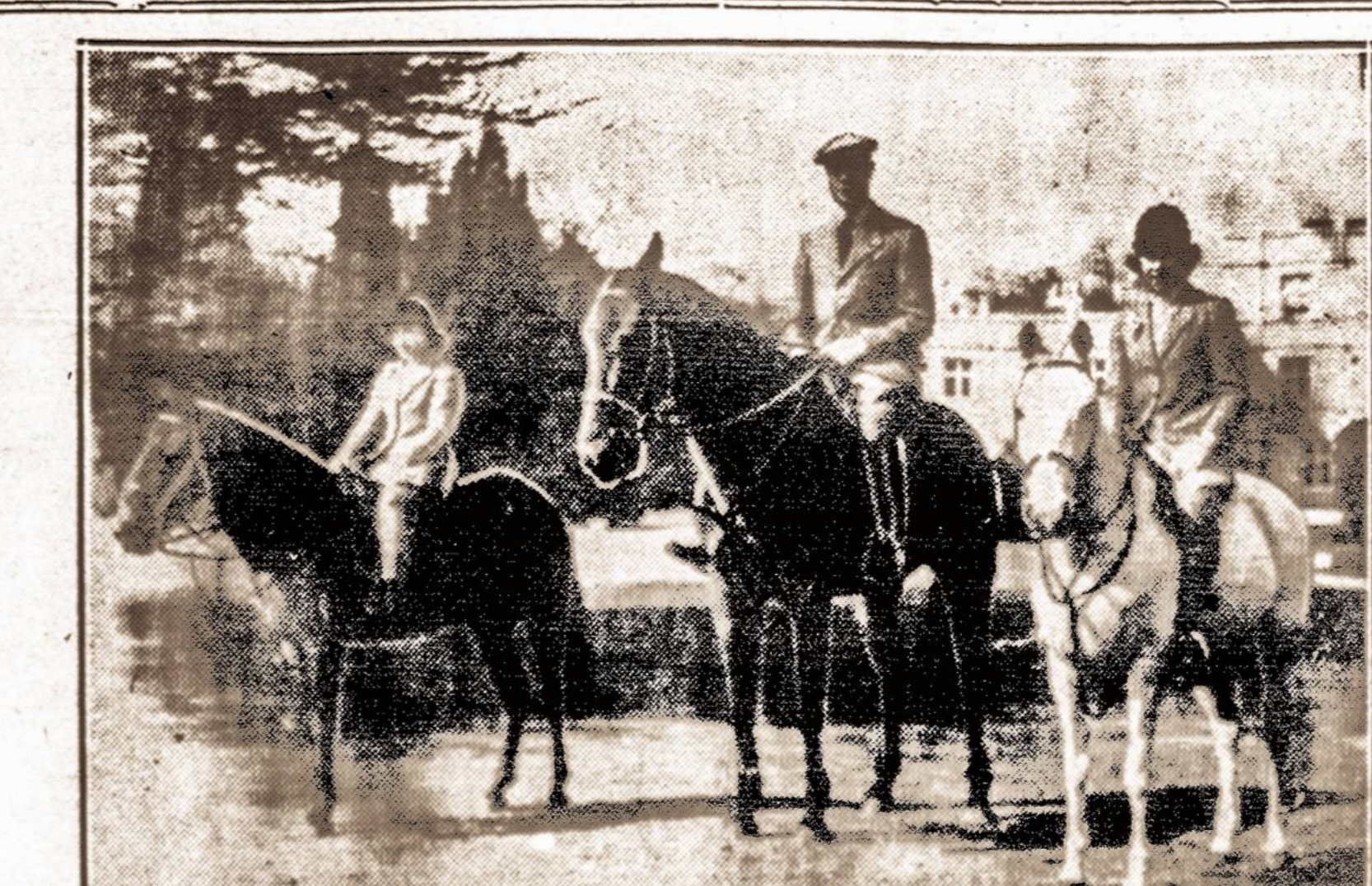
DRĄSINA SAVO VALDINIUS. — Nepaisant dažnaus bombardavimo iš vokiečių lėktuvų, Anglijos karalius Jurgis su dukrelėmis Elzbieta ir Margaryta - Rože jo- dinėja po Londoną.