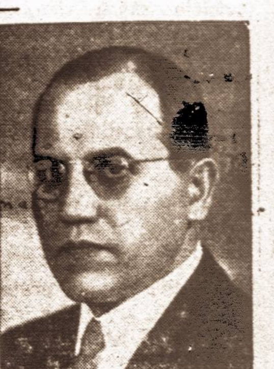
KAZYS ŠKIRPA, Lietuvos atstovas Berlyne.

Rusai išstovėjo pas atstovy- bės vartus nuo 9 val. ryto iki 5 val. popiet. Kelis kartus ban- dė kalbėti su atstovu per tele- foną, bet šis jiems nieko neat- sakė.