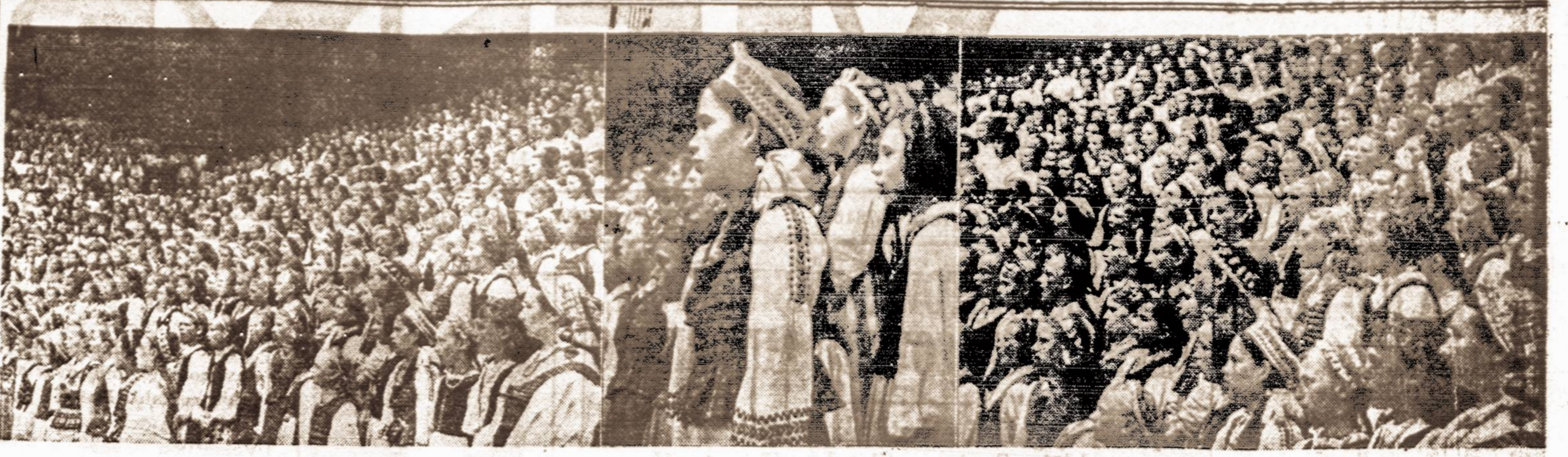
Kauno miesto mokyklų šventė, dar prieš Sovietų okupaciją

Į Jungtines Valstybes nelegaliai įvažiavę prieš 1924 m. liepos 1 d. nebus baudžiami, kurie įsiregistravo iki rugpjūčio 26 d.