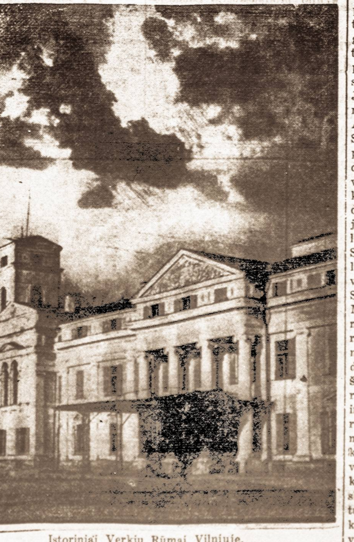
Istoriniai Verkių Rūmai Vilniuje.