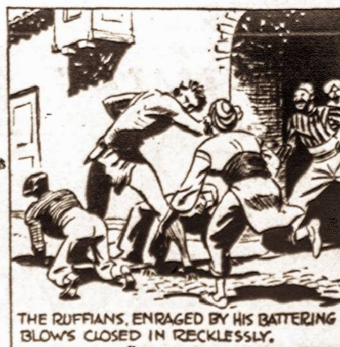
THE RUFFIANS, ENRAGED BY HIS BATTERING BLOWS CLOSED IN RECKLESSLY.