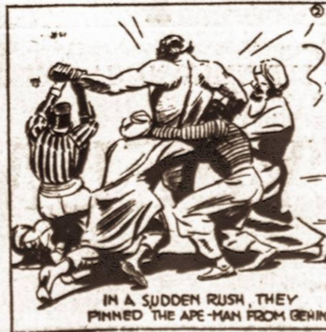
IN A SUDDEN RUSH, THEY PINNED THE APE-MAN FROM BEHIND.