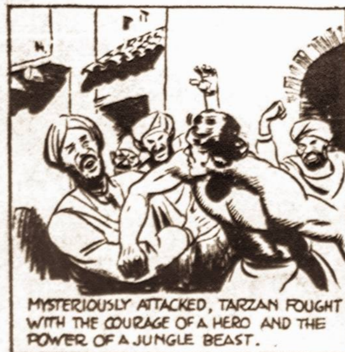
MYSTERIOUSLY ATTACKED, TARZAN FOUGHT WITH THE COURAGE OF A HERO AND THE POWER OF A JUNGLE BEAST.