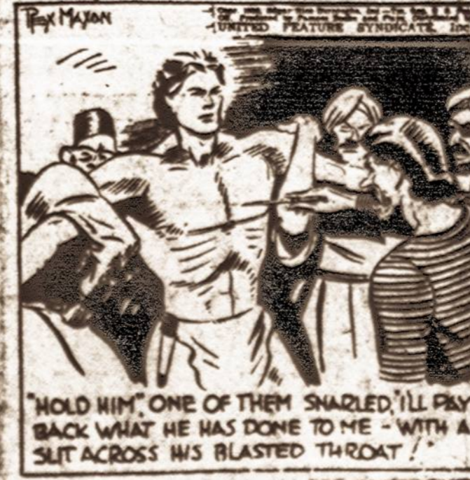
"HOLD HIM, ONE OF THEM SHARLED, 'LL PAY BACK WHAT HE HAS DONE TO ME - WITH A SLIT ACROSS HIS BLASTED THROAT!"

Kas bus toliau— išrinkite kitame Vienybės numery