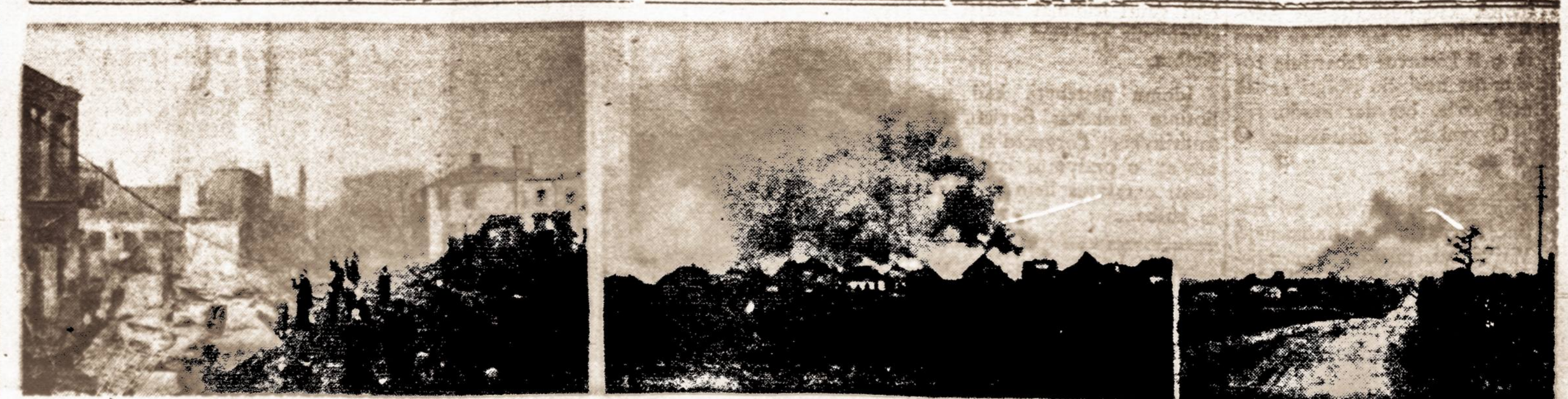
Liepos 7 d. vakare kilęs gaisras sunaikino didžiąją Jurbako miesto dalį. Sudegė 168 namai miesto centre. Nuostolius padaryta už kelis milijonus litų.

KAUNAS. — Pristigus žaliavoms. L. S. T. R. pramonės ministerija ragina visus senų padangų ir kamerų laikytojus pristatyti senas padangas ir kameras į gumos fabrikus ar kooperatyvus. Už senų padangų kilogramą bus mokama 50 centų, o už senų kamerų — 70 centų. Tenka pastebėti, kad Kaune esantieji gumos fabriškai "Inkaras" ir "Guma" turi didelių sunkumų dėl žaliavos stokos.