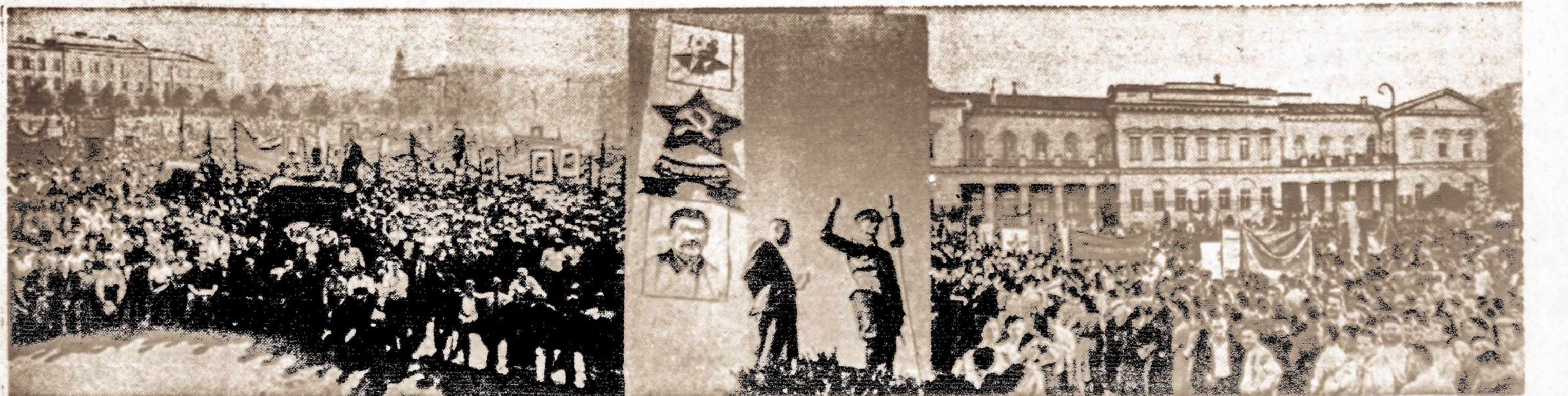
"Už tų masinių mitingų, kuriose garbinamas Rusijos diktatorius Stalinas, slepiama tikroji Lietuvos padėtis, tikras Lietuvos žmonių jausmas..."