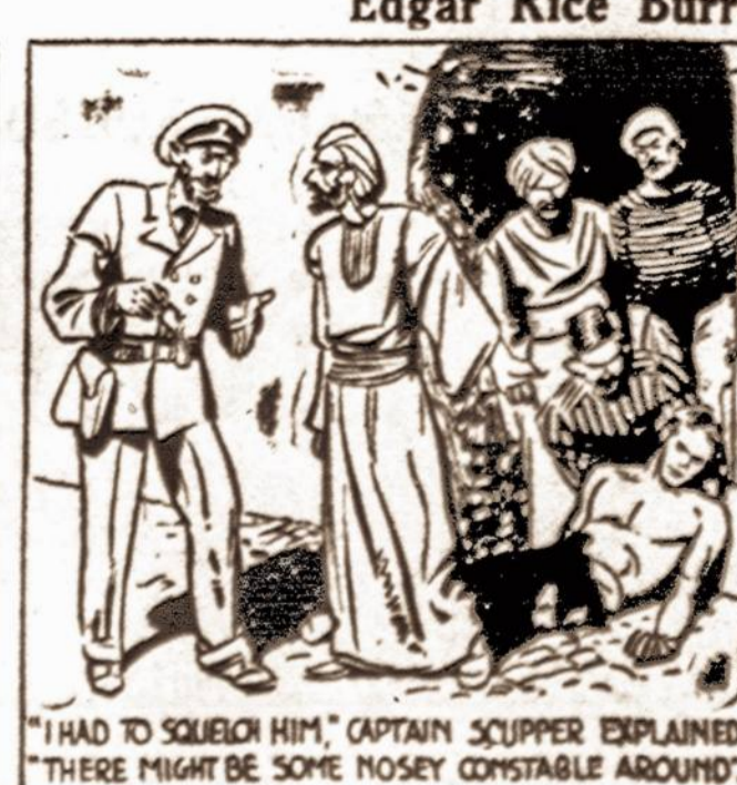
"I HAD TO SQUEEZE HIM," CAPTAIN SCUPPER EXPLAINED. "THERE MIGHT BE SOME NOSEY CONSTABLE AROUND"