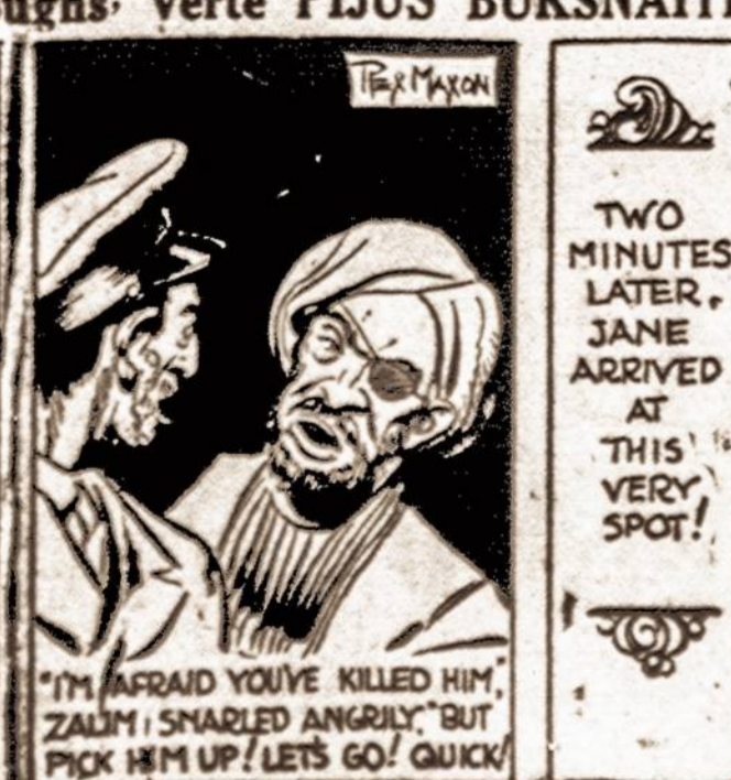
"I'M AFRAID YOU'VE KILLED HIM, ZALIM! SHARLED ANGRILY, "BUT PICK HIM UP! LETS GO! QUICK"