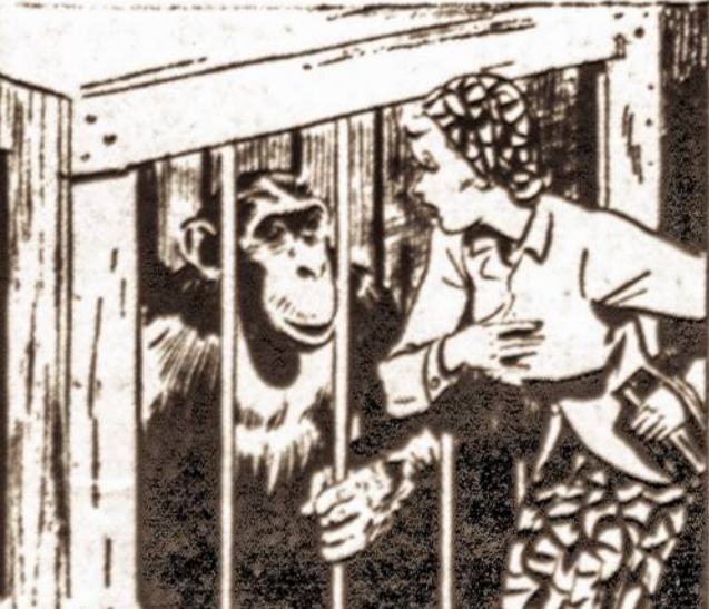
"I JANE, TARZAN'S SHE," JANE MURMURED. "THE APE'S EYES BLAZED WITH DELIGHT."