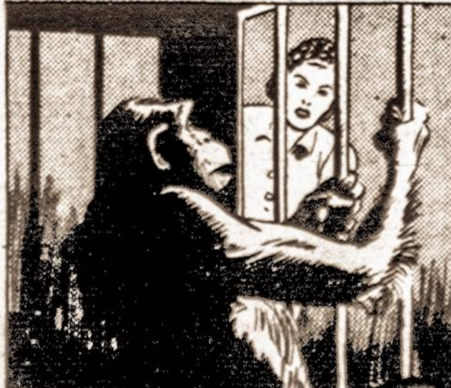
"I BOHGU, TARZAN'S FRIEND," HE CRIED, "IF TARZAN HERE, HE FIGHT, SET BOHGU FREE."