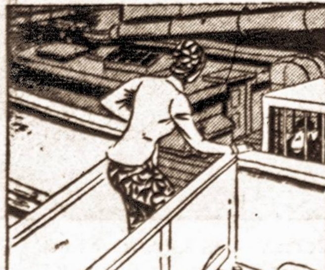
OUT OF RIT, JANE SLIPPED, ABOARD THE SQUID AND SPOKE TO THE APE IN THE JUNGLE TONGUE TARZAN HAD TALKED HER.