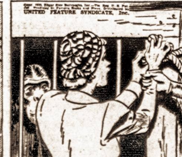
JANE'S FINGERS FLEW TO UNTIE THE ROPES BUT SUDDENLY A HAND SHOT OUT AND CLUTCHED HER.

8 — Pagailusi keliamos į laivą beždžionės. Jare įėjo į laivą ir pašnekino ją beždžionių kalba, kurios buvo išmokusi iš Tarzano. Beždžionė išgirdusi Janės žodžius staiga liovėsi nerimauti.