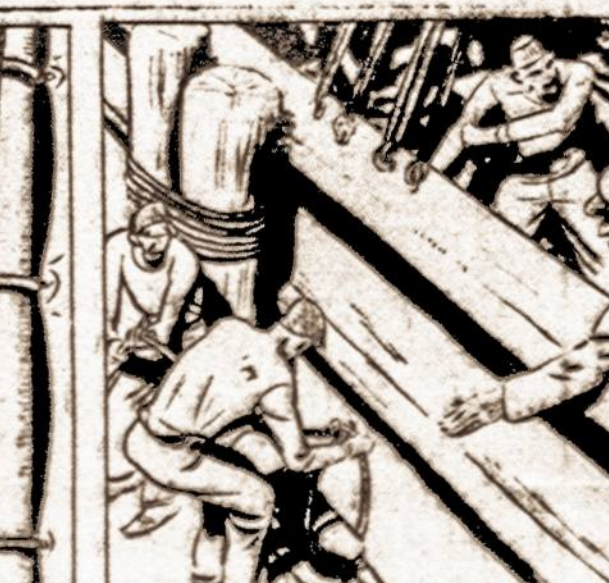
"HE'S GONNA JUMP ASHORE! SQUIPPER SHOUTED 'CAST OFF, ME HEARTIES! GET THE SHIP AWAY FROM THE DOCK'

Žiūrėkite — Tarzano apysakos tęsinys trečiame puslapyje