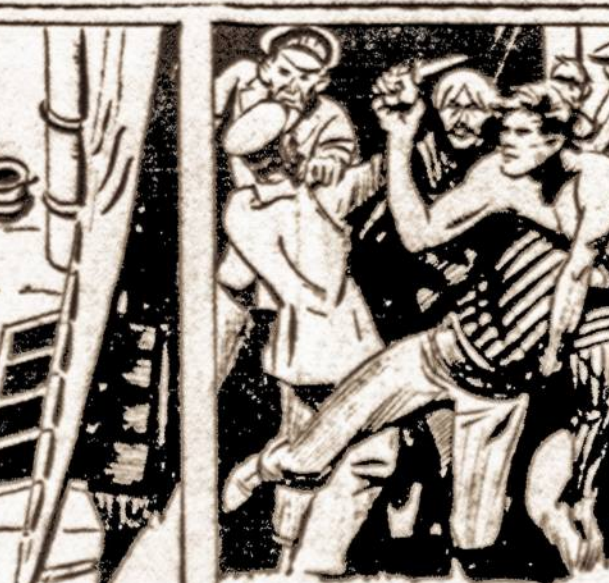
TARZAN, WHO TOOK COMMAND OF THE LOYAL BAND, SAW THERE WAS NO HOPE OF VICTORY.