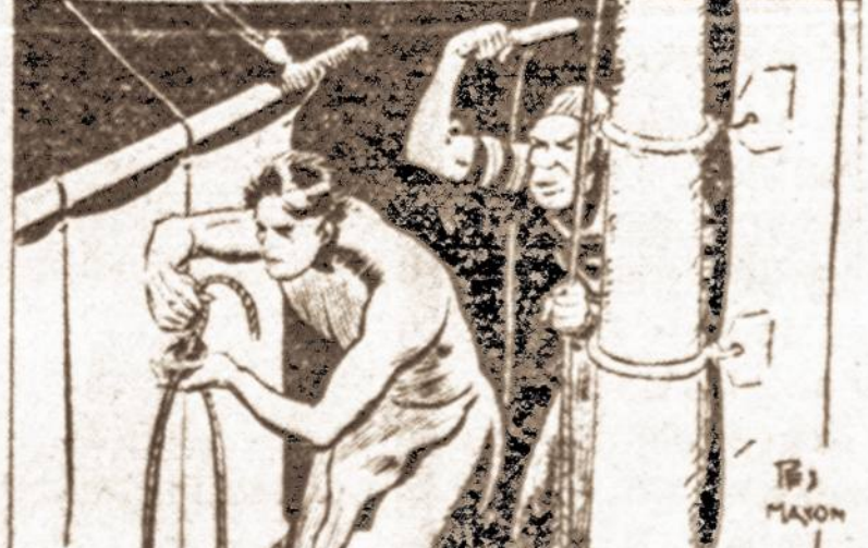
---TARZAN WAS BUSY WITH HIS ROPE WHILE A SAILOR, CLINGING TO A BRACE, RAISED A BE-LAYING-PIN TO STRIKE HIM DOWN!

18. — Iš laivo kabinos lango Marika tēmijo Tarzano vikramą ir sumanumą. Iš pradžių ji nežinojo, kas toks ir ko lipa į laivo stiebą. Ji tik stebėjosi šio pūnuoigio vyro drąsa ir sugamumu lipi virvėmis ir aukštį.