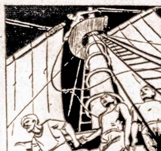
HE LOOPEO IT COILED IT, AND WHIRLED IT DOWN. THE LASSO FELL AROUND TWO OF HIS FOES.