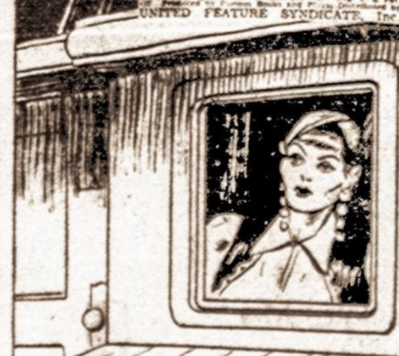
WATCHING FROM A CABIN WINDOW, MARIKA WAS THRILLED BY THE EX-PLOITS OF THE NEAR-NAKED GIANT.