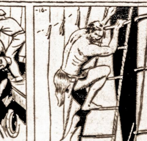
SUDDENLY THE APE-MAN WHIRLED AND SCURRIED INTO THE RIGGING