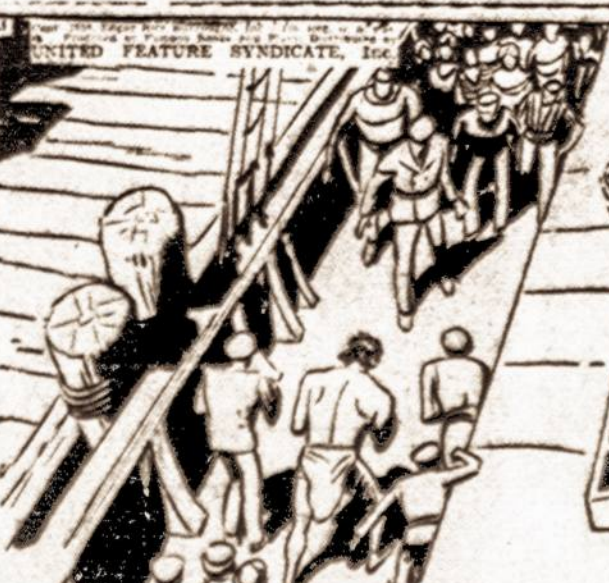
MOST OF THE SQUIDS RIFF-RAFF CREW JOINED THE PIRATES. AT 10, BOYS! CRIED SQUID, WE GOT EM!