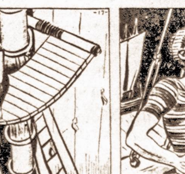
BELOW A SAILOR GRIPPED A BELAYING PIN, UTTERING AN-GRILLY YELL BRING THE BUZZARD DOWN!

17. — Užlipęs į laivo stiebo viršų Tarzanas visiškai neminė slapstyti nuo savo priešų. Jis žinojo, kas reikia daryti. Nieko nelaukdamas Tarzanas nusiplovė ilgą virvę, kuri buvo nutiesta į stiebo viršų.