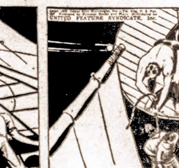
THEN THE APE-MAN HOISTED THE RUFFIANS HIGH ABOVE THE DECK AND FASTENED THE ROPE TO A SPAR.