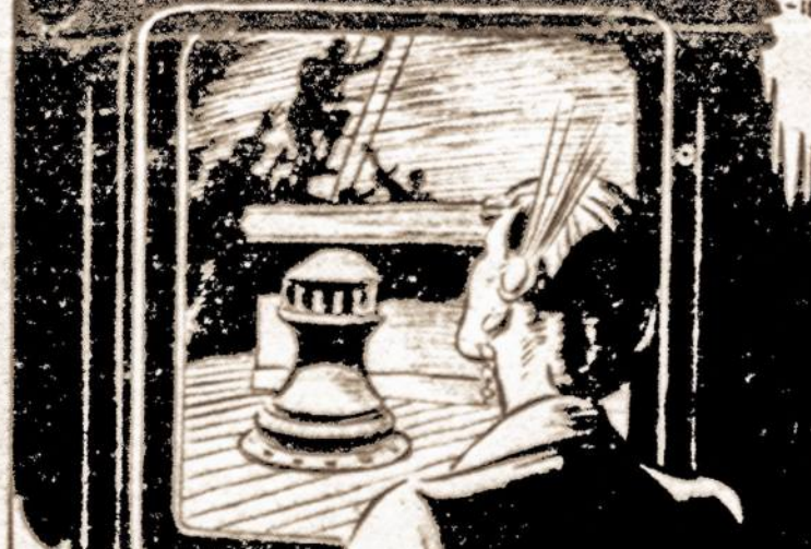
AS HE SCURRIED INTO THE RIGGING, SHE HEARD HIS FOES ANGRILY SHOUTING HIS NAME.