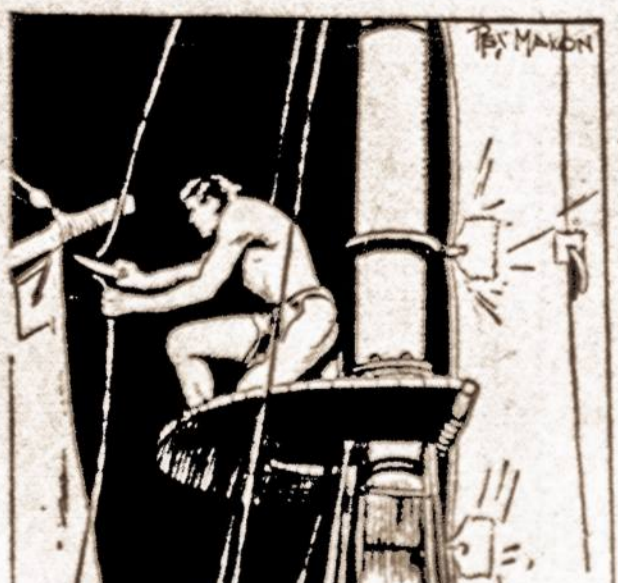
HIGH IN THE SQUID'S RIGGING, TARZAN HALTED AND CUT A LENGTH OF ROPE.