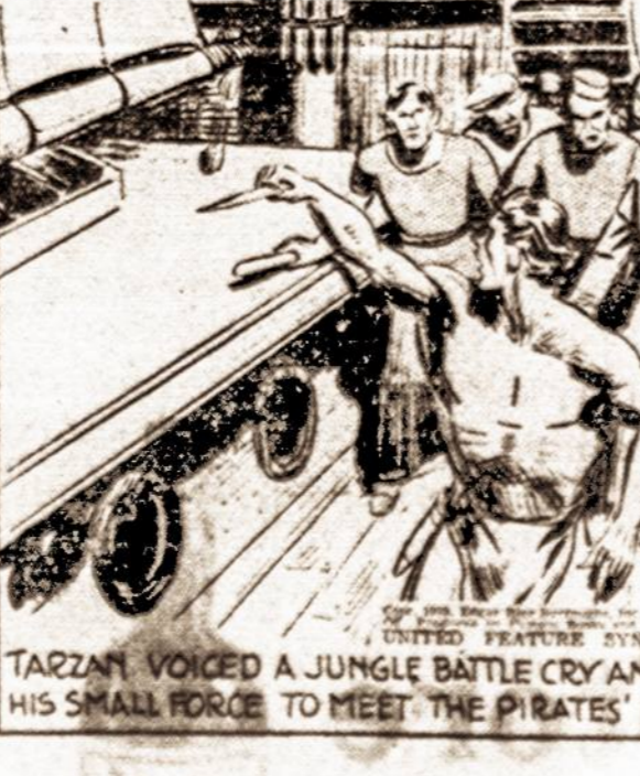
TARZAN VOICED A JUNGLE BATTLE CRY AND CALLED HIS SMALL FORCE TO MEET THE PIRATES' CHARGE...