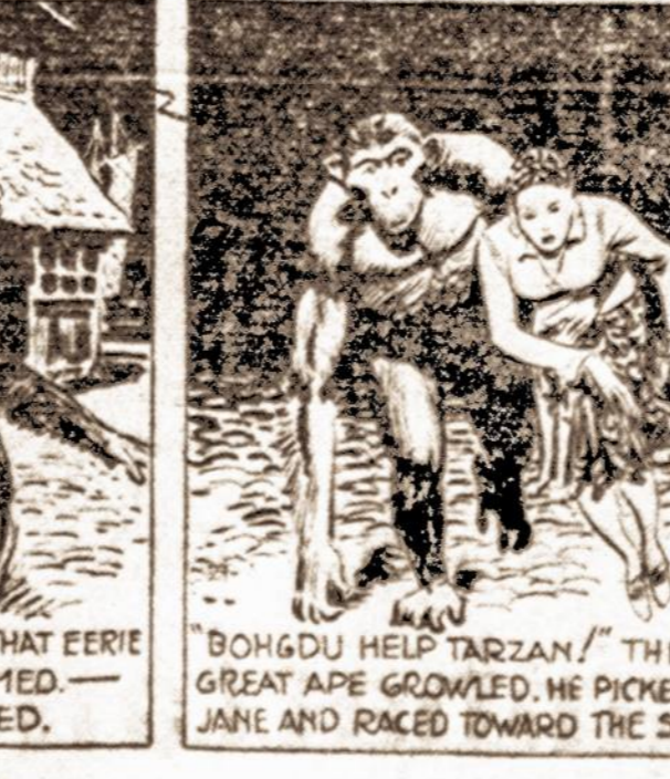
"BOHGDU HELP TARZAN!" THE GREAT APE GROWLED. HE PICKED UP JANE AND RACED TOWARD THE SHIP.