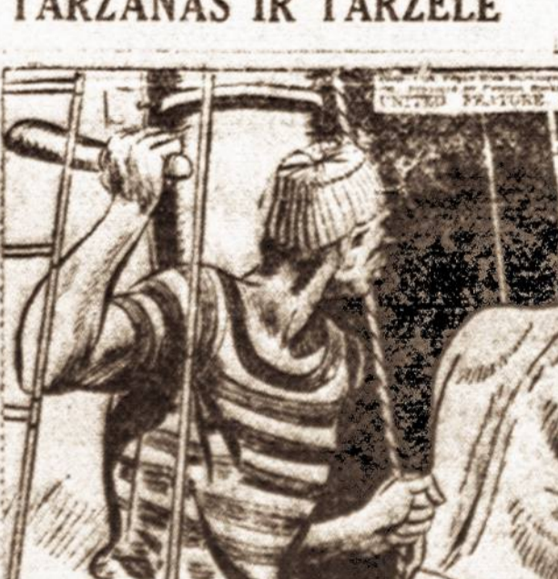
HIGH IN THE RIGGING, THE SAILOR PERCHED BEHIND TARZAN LIFTED HIS IRON BLUDGEON TO STRIKE.

19. — Užlipęs į laivo stiebo viršų, kur pynėsi virvės, būrės ir kitos laivo prietaisios, nedo-ras iš jūreivis priaktinio prie Tarzano iš užpakalio ir užsi-mojo sunkiu šerdesninku jam į galvą.