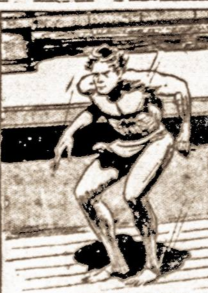
HIS LEGS FLEXED, HIS MUSCLES TOOK UP THE SHOCK LIKE GIANT STEEL SPRINGS.