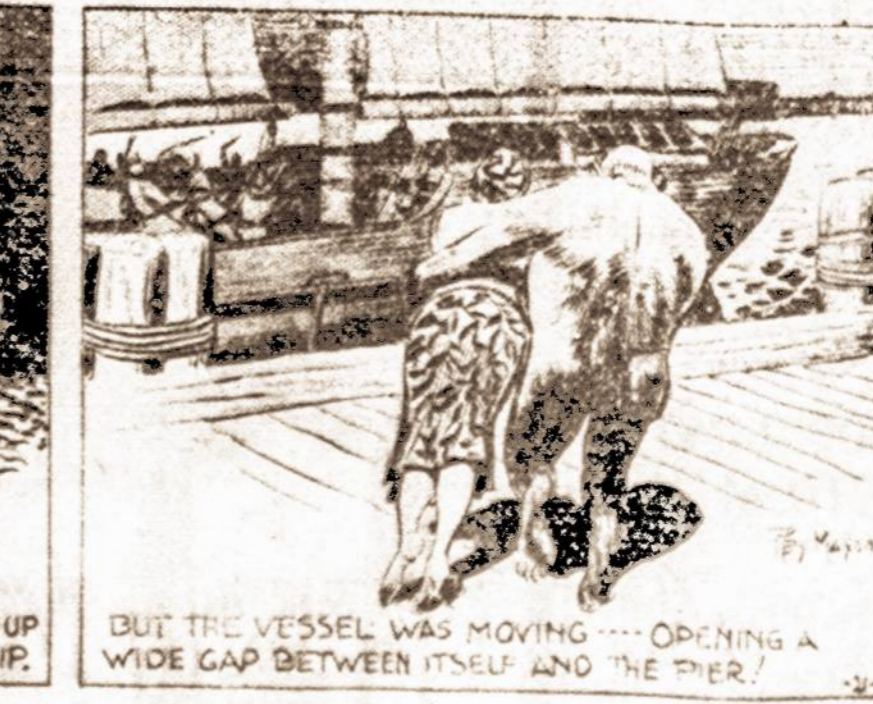
BUT THE VESSEL WAS MOVING... OPENING A WIDE GAP BETWEEN ITSELF AND THE PIER!

21. — Matydamas visą priešių būrį, Tarzanas nei kiek nenusigando. Jis paleido bausiųjį džiunglišką pavojaus riksmą, suskambėjusi po visą prielauką ir skubiai pasirodė susitikti su savo užpuolikais.