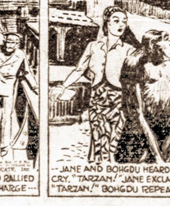
... JANE AND BOHGDU HEARD THAT EERIE CRY. "TARZAN!" JANE EXCLAIMED. "TARZAN!" BOHGDU REPEATED.