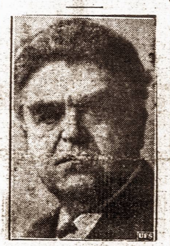
John L. Lewis

Darbo organizacijos CIO vadas atsistatydino dėl to, kad unijos permažai rėmė Willkie rinkimuose