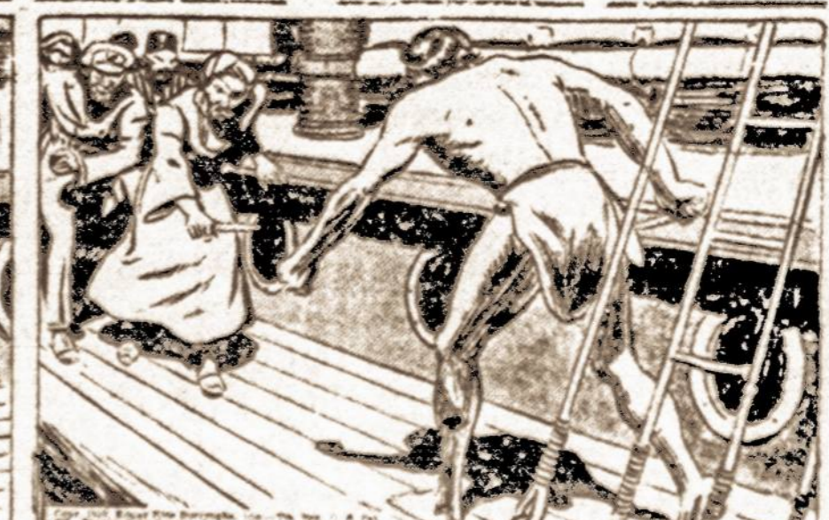
THE PIRATES GASPED WITH AMAZEMENT... THEN DASHED TOWARD HIM!

20. — Pamatę krintantį Tarzaną, visi piratai nudžiugo. Buvo aišku, kad jei Tarzanas ir neužsimu, tai jis gerai prisitrenks ir bus nepavojingas. Nukristi iš taip aukštai ant laivo dēnio — tai ne juckai!