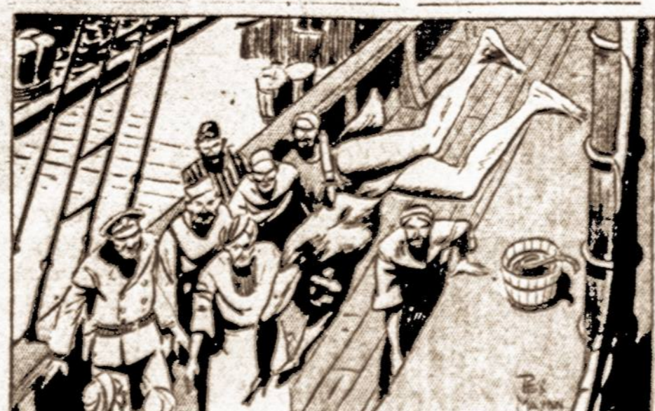
AS TARZAN HURTLED DOWNWARD, THE PIRATES FORESAW THE END OF HIS RESISTANCE. AT LEAST HE WOULD BE CRIPPLED.