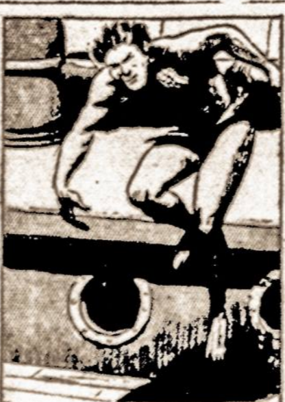
BUT TARZAN HAD BEEN TRAINED BY THE APES IN JUNGLE ACTION. HE ALIGHTED FEET FIRST.