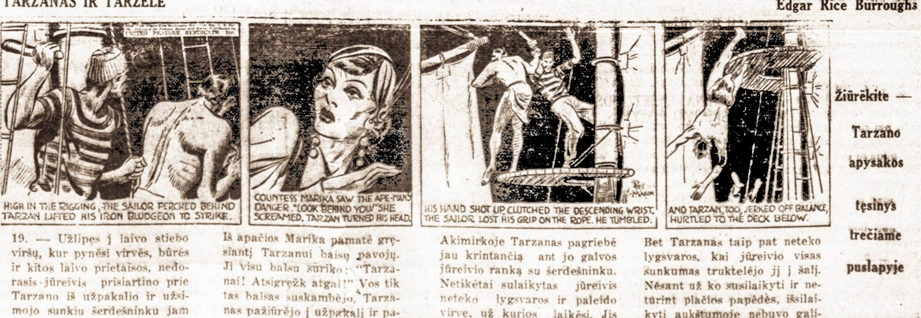
AND TARZAN, TOO, JERKED OFF BALANCE, HURTLING TO THE DECK BELOW.

19. — Užlipęs į laivo stiebo viršų, kur pynėsi virvės, būrės ir kitos laivo prietaisios, nedoras iš jūreivis priaktinio prie Tarzano iš užpakalio ir užsimojo sunkiu šerdesninku jam į galvą.