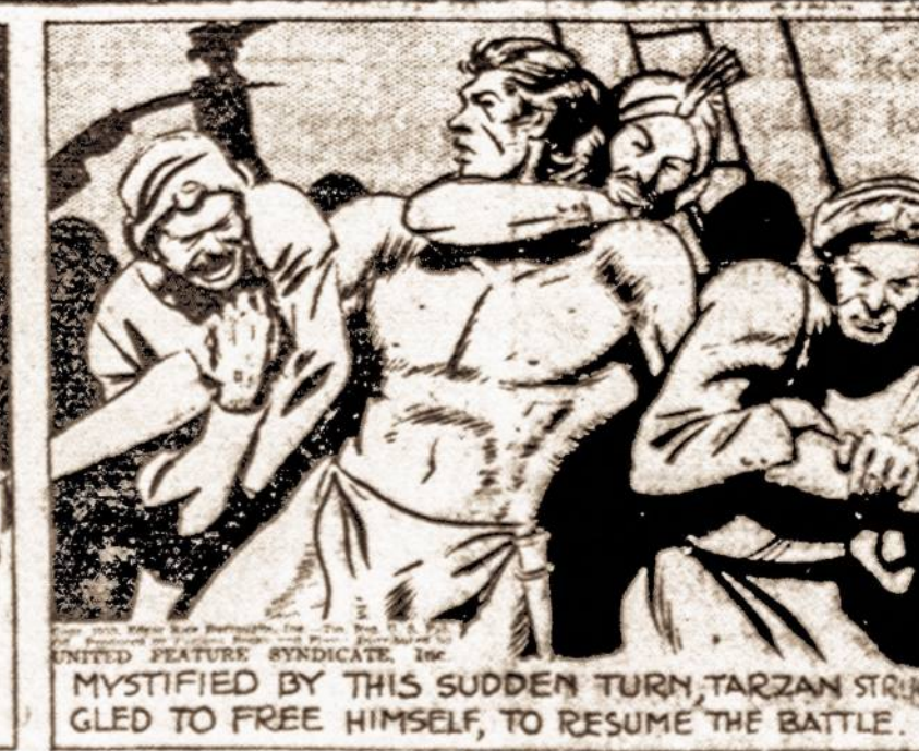
MYSTIFIED BY THIS SUDDEN TURN, TARZAN STRUGGLED TO FREE HIMSELF, TO RESUME THE BATTLE.