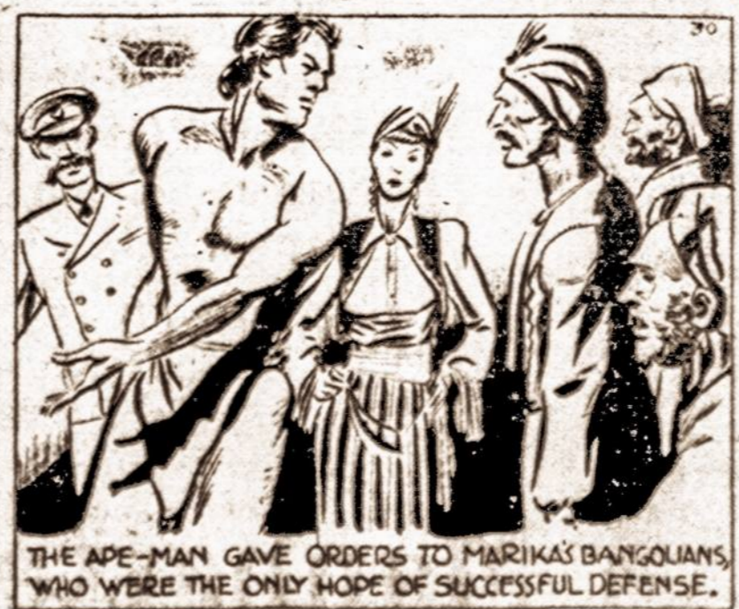
THE APE-MAN GAVE ORDERS TO MARIKA'S BANGUANS WHO WERE THE ONLY HOPE OF SUCCESSFUL DEFENSE.