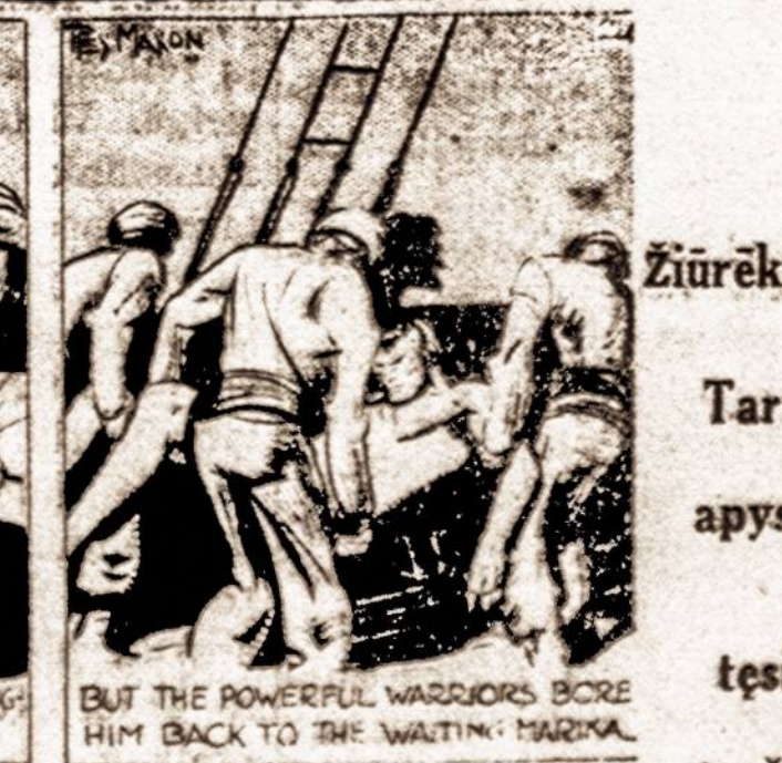
BUT THE POWERFUL WARRIORS BORE HIM BACK TO THE WAITING MARIKA.

28. — Marikos sargai irgi nesnaudė: vos tik Tarzanas pargriuvo ant dėnio, kaip jie visi apstojo jį aplink ir neleido sukilteliams prisitrinti. Rodėsi, kad jie dabar tikrai nori apginti Tarzaną.