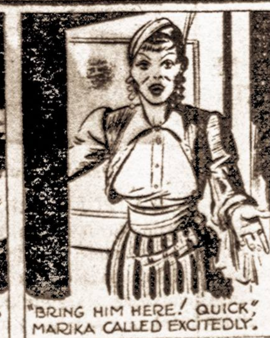
"BRING HIM HERE, QUICK!" MARIKA CALLED EXCITEDLY.