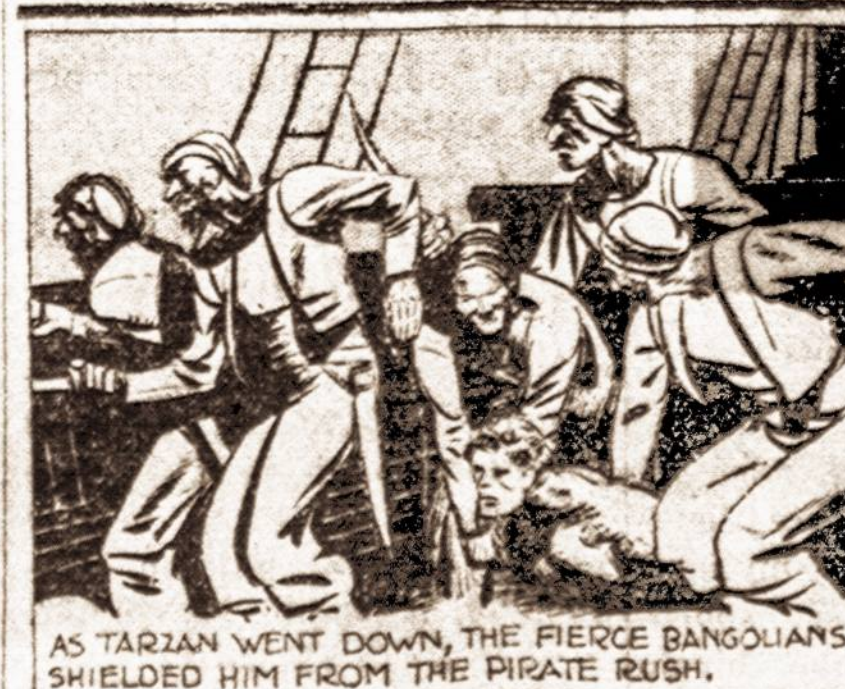
AS TARZAN WENT DOWN, THE FIERCE BANGOLIANS SHIELDED HIM FROM THE PIRATE RUSH.