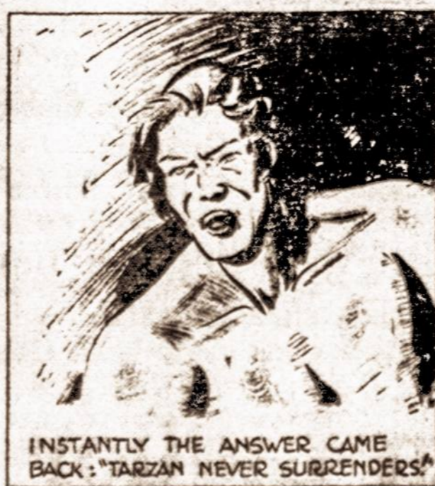
INSTANTLY THE ANSWER CAME BACK: "TARZAN NEVER SURRENDERS!"