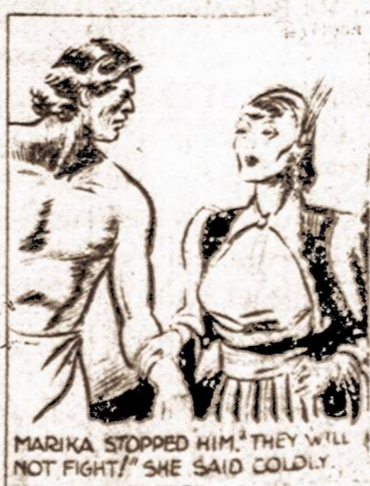
MARIKA STOPPED HIM: "THEY WILL NOT FIGHT!" SHE SAID COLDLY.

30. — Tuo pat laiku visi sukilėliai apspito besikalbančiųjų kajutę ir suriko: "Pasiduokite! Jūs žinote, kad negalite apsiginti. Pasiduokite geruopu, nes visi žūsite, jei priešinsitės! Iškelkite rankas!"