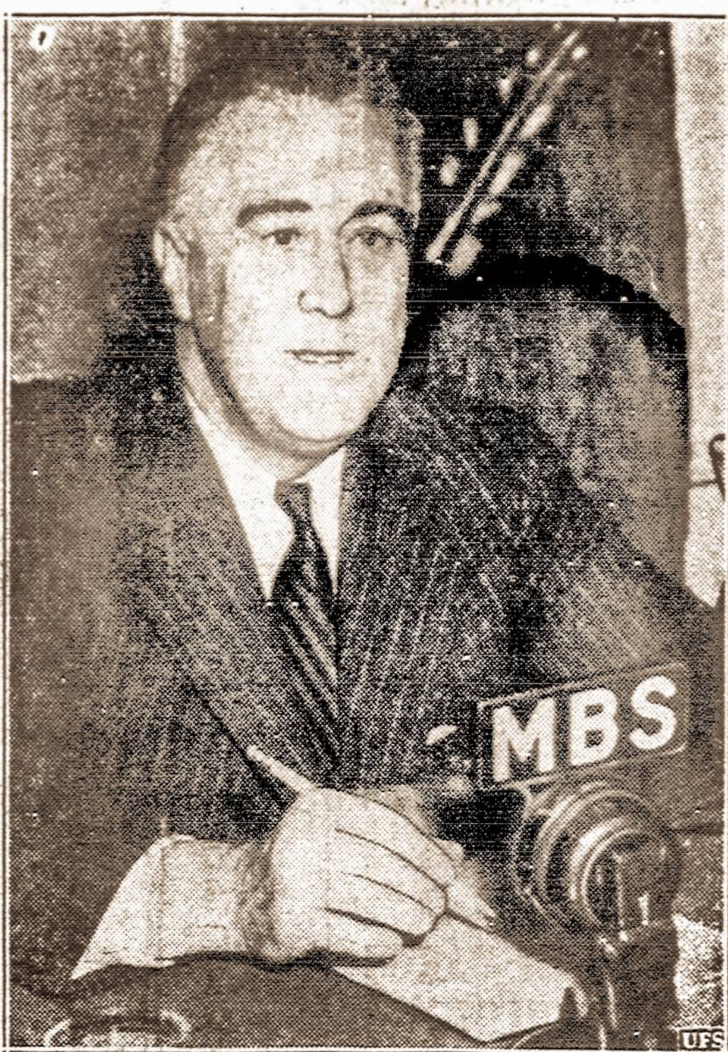
FRANKLIN DELANO ROOSEVELT Jungtinių Valstybių prezidentas įvesdintas į trečiąjį tarnybos terminą

VILNIUS. — Tarybų Lietuvos praneša, kad Vilniaus stoties bufete dvi porėlės dešrelių ir truputis kopūstų su dviem stiklinėmis arbatos kainuoja 9,90 rublių.