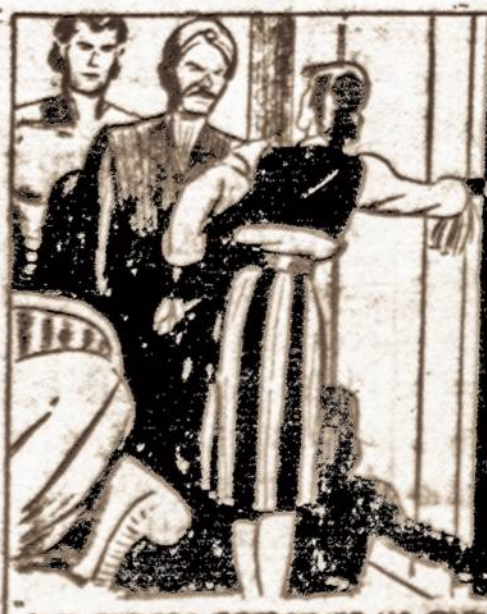
OUR FATHERS BETROTHED US, BUT I'LL NEVER MARRY YOU! MARIKA SCOFFED, 'NOW GO!'