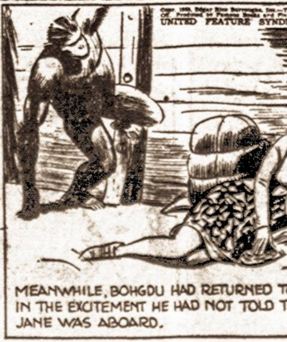
MEANWHILE, BOHGDU HAD RETURNED TO THE HOLD. IN THE EXCITEMENT HE HAD NOT TOLD TARZAN THAT JANE WAS ABOARD.