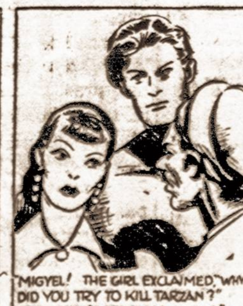
"MIGELIUS! THE GIRL EXCLAIMED, 'WHY DID YOU TRY TO KILL TARZAN?' 'BECAUSE I'VE HAD NO RIVAL!' PRINCE MIGUEL SPARKLED.