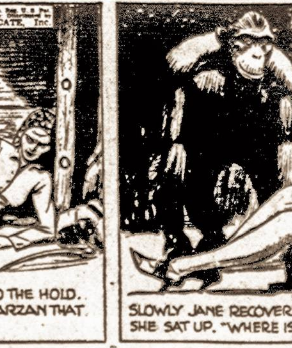
SLOWLY JANE RECOVERED CONSCIOUSNESS, SUDDENLY SHE SAT UP, "WHERE IS TARZAN?" SHE ASKED.