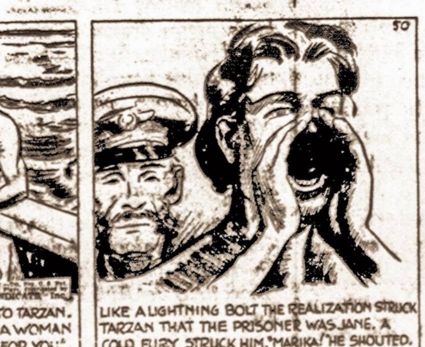
LIKE A LIGHTNING BOLT THE REALIZATION STRUCK TARZAN THAT THE PRISONER WAS JANE. A COLD FURY STRUCK HIM. MARIKA HE SHOUTED.