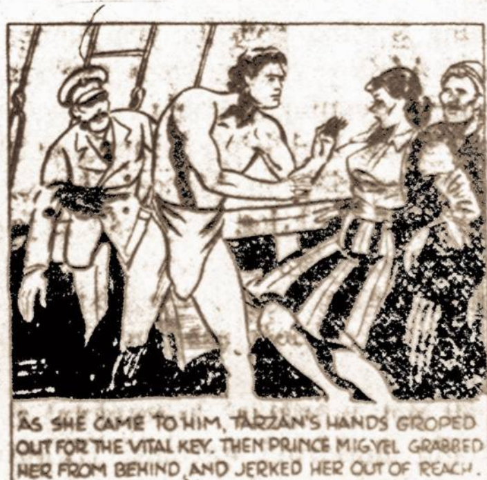
AS SHE CAME TO HIM, TARZAN'S HANDS GRABBED OUT FOR THE VITAL KEY. THEN PRINCE MIGUEL GRABBED HER FROM BEHIND AND JERKED HER OUT OF REACH.