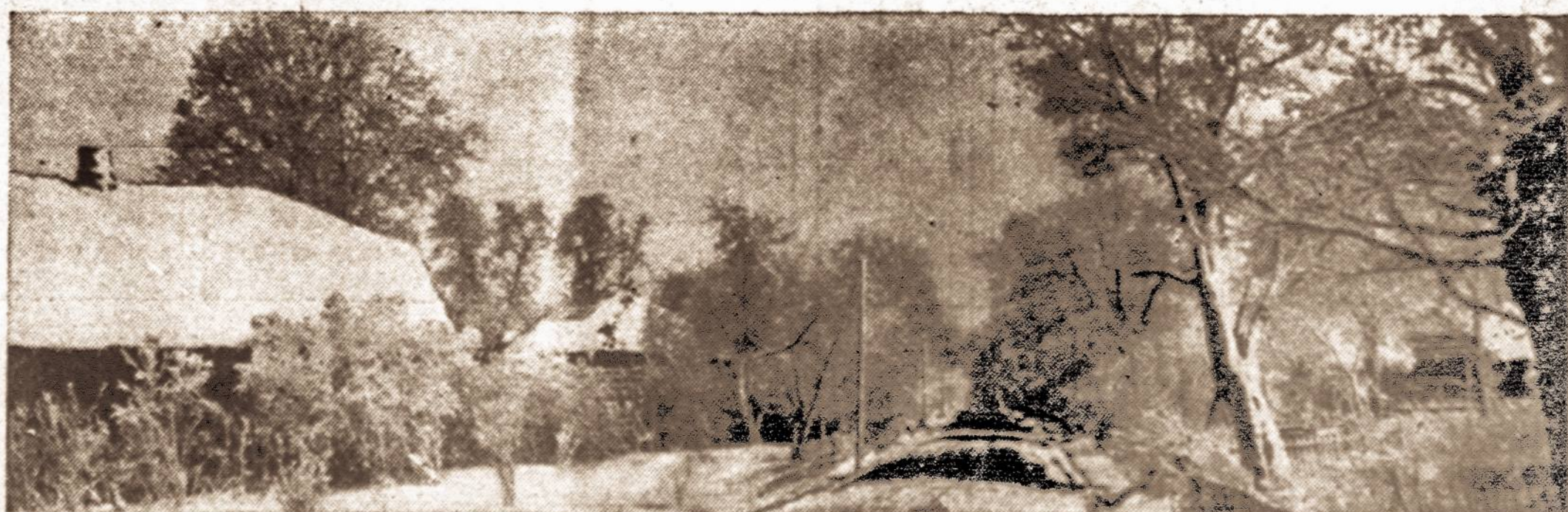
ZIEMA LIETUVOJE. — Šaltai ir sniegas kankina Lietuvos gamtą, o nepriklausomybės netekimas ir svetimoji priesp auda jos šaldo gyventojų širdis ir sielas.

Finansų komisaro pranešime sakoma, kad pajamų mokesčiai ir kultūros rinkliava mokami ne tiktai nuo pagrindinio uždarbio, bet ir nuo visų kitų pajamų. Jame paaiškina, kad darbininkai gali neimti jiems tenkančių atostogų, už kurias jiems būsimanti mokama tam tikra kompensacija, bet ir nuo šios kompensacijos imami mokesčiai ir rinkliavos.