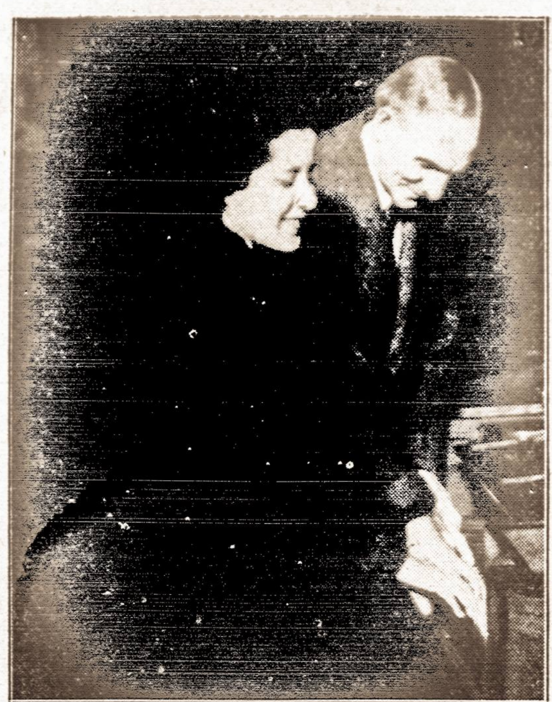
HENRY FORD parodo Brazilijos pianistui Novaes kaip skambinti šimto metų fotepijoną, bet Aukšt. Teismas nešoka pagal jo muziką: turi nusileisti streikininkams.

Yra pasakojama, kad viena Hollywoodo gražuolė parašė George Bernard Shaw laiską, sakydama: “Jei Jūs būtumėte