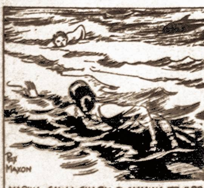
MARIKA, SAW A SHARK SWIMMING TOWARD TARZAN. SHE SCREAMED A WARNING.