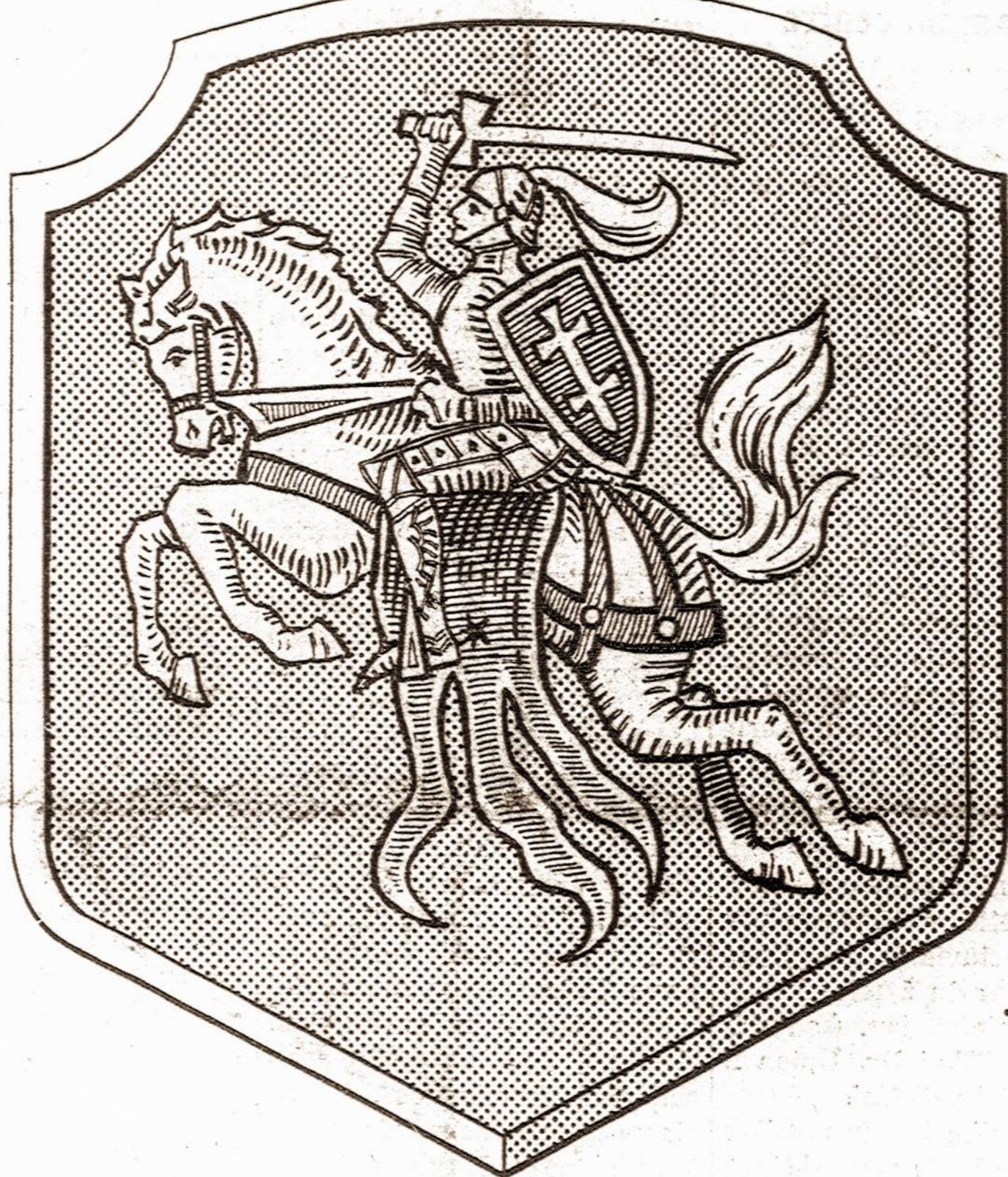
LIETUVA VĖL BUS LAISVA IR NEPRIKLAUSOMA VALSTYBĖ