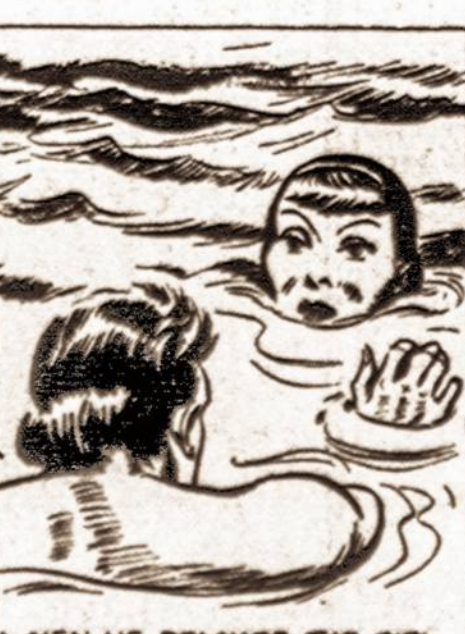
WHEN HE REACHED THE GIRL, SHE WAS ABOUT EXHAUSTED.