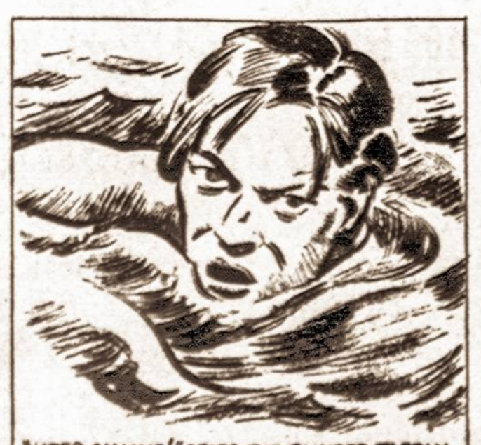
"KEEP CALLING!" CRIED THE BLINDED TARZAN. "KEEP CALLING SO I CAN FIND MY WAY TO YOU!"