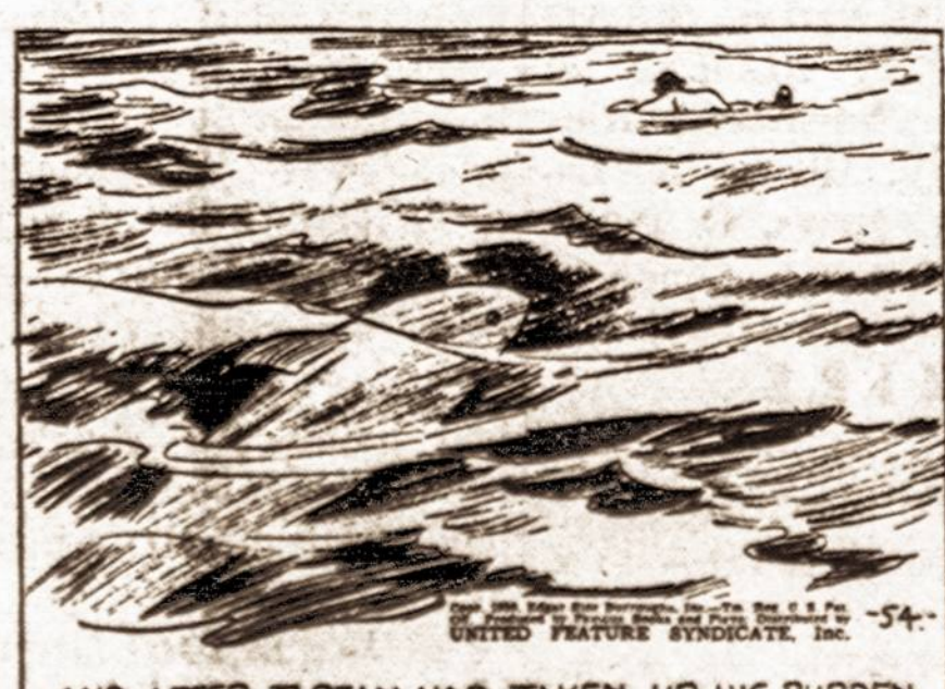
AND AFTER TARZAN HAD TAKEN UP HIS BURDEN, THE PURSUING SHARK GAINED STEADILY.

Kas bus toliau — žiūrėkite kitame Vienybės numery