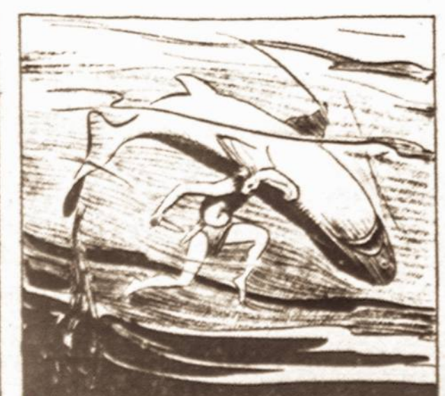
THE MONSTER WHIRLED TO DEVOUR ITS ATTACKER, BUT TARZAN HELD TO A FIN, STABBING DESPERATELY.