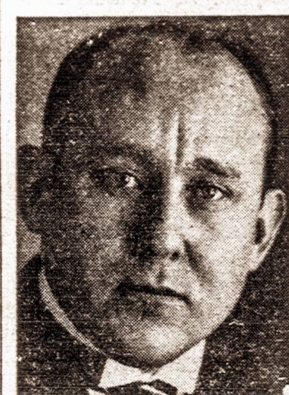
Dr. L. Bistras

Gautomis žiniomis, Lietuvoje, bolševikų kalėjime, nužudytas krikščionių demokratų veikėjas, buvęs Lietuvos ministras pirmininkas Leonas Bistras.