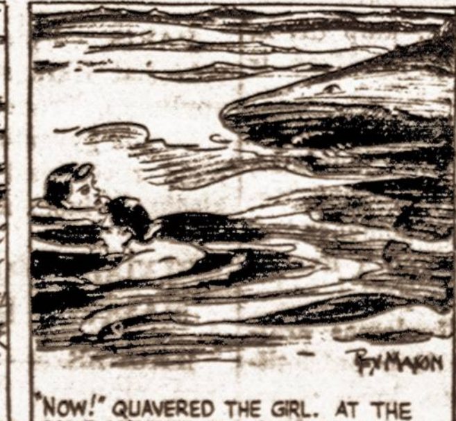
"NOW!" QUANERED THE GIRL. AT THE SAME MOMENT THE SHARK'S SAW-TOOTHED JAW FLEW OPEN.

55. — Laikydamas Mariką, Tarzanas visomis jėgomis plaukė link laivo, kurio negalėjo matyti. Jis plaukė tik ta kryptimi, kur liepė jam Marika. Bet žmogaus plaukimai nelygus žuvies plaukimui vandenyje!