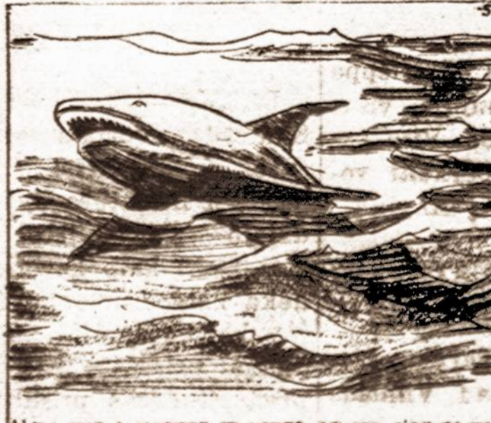
NOW THE MONSTER TWISTED ON ITS SIDE SO THAT ITS UNDERSLING JAW MIGHT CLAMP ITS VICTIMS.