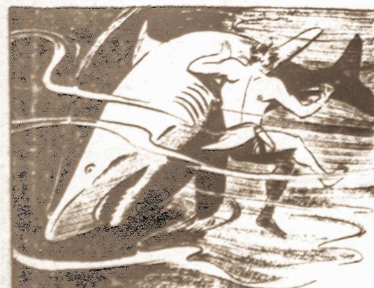
AS THE BLIND TARZAN BUMPED AGAINST THE BODY OF THE SHARK, HE DROVE HIS KNIFE.