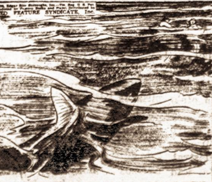
CLUTCHING MARIKA, TARZAN SWAM DESPERATELY. BUT THE PURSUING SHARK GAINED RAPIDLY.