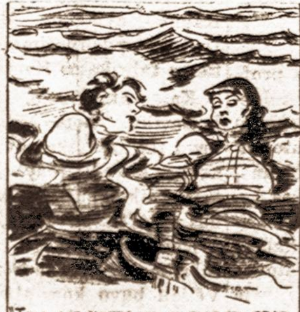
"TELL ME WHEN HE TURNS TO GRAB US", THE BLUNDED APE-MAN DIRECTED.