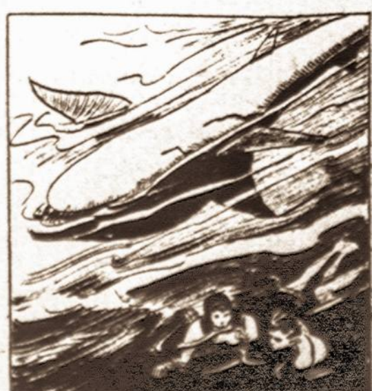
AS THE SEA-BEAST DIED, TARZAN GRASPED MARIKA AND SET OUT FOR THE SHIP, BUT NOW...