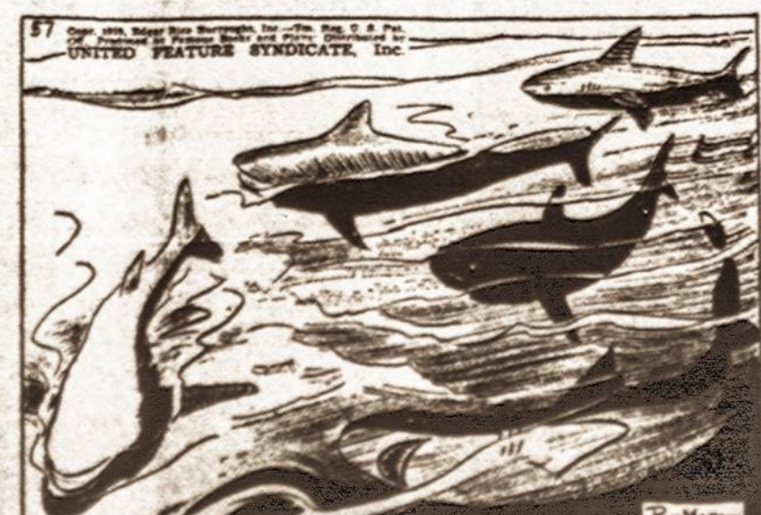
FIVE SHARKS SWAM UP AND QUICKLY DEVoured THE DEAD FISH, THEN THEY DASHed AT THE FUGITIVE HUMANS.

57. — Kaip tik apjaukęs Tarzanas atsimešė į ryklio kūną, tuoj pradėjo jį varstyti savo peiliu. Tarzanas žinojo, kad ryklio silpniausia dalis — jo pilvas ir pakaklė. Dėl to jis ten ir smėgė savo peiliu.