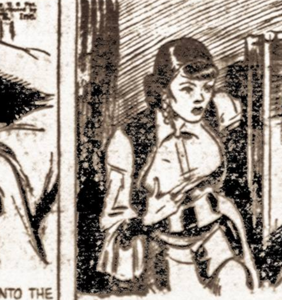
MARICA COULD NOT RESIST THE CHANCE. "TARZAN LOVES ME, NOT YOU," SHE BOASTED.