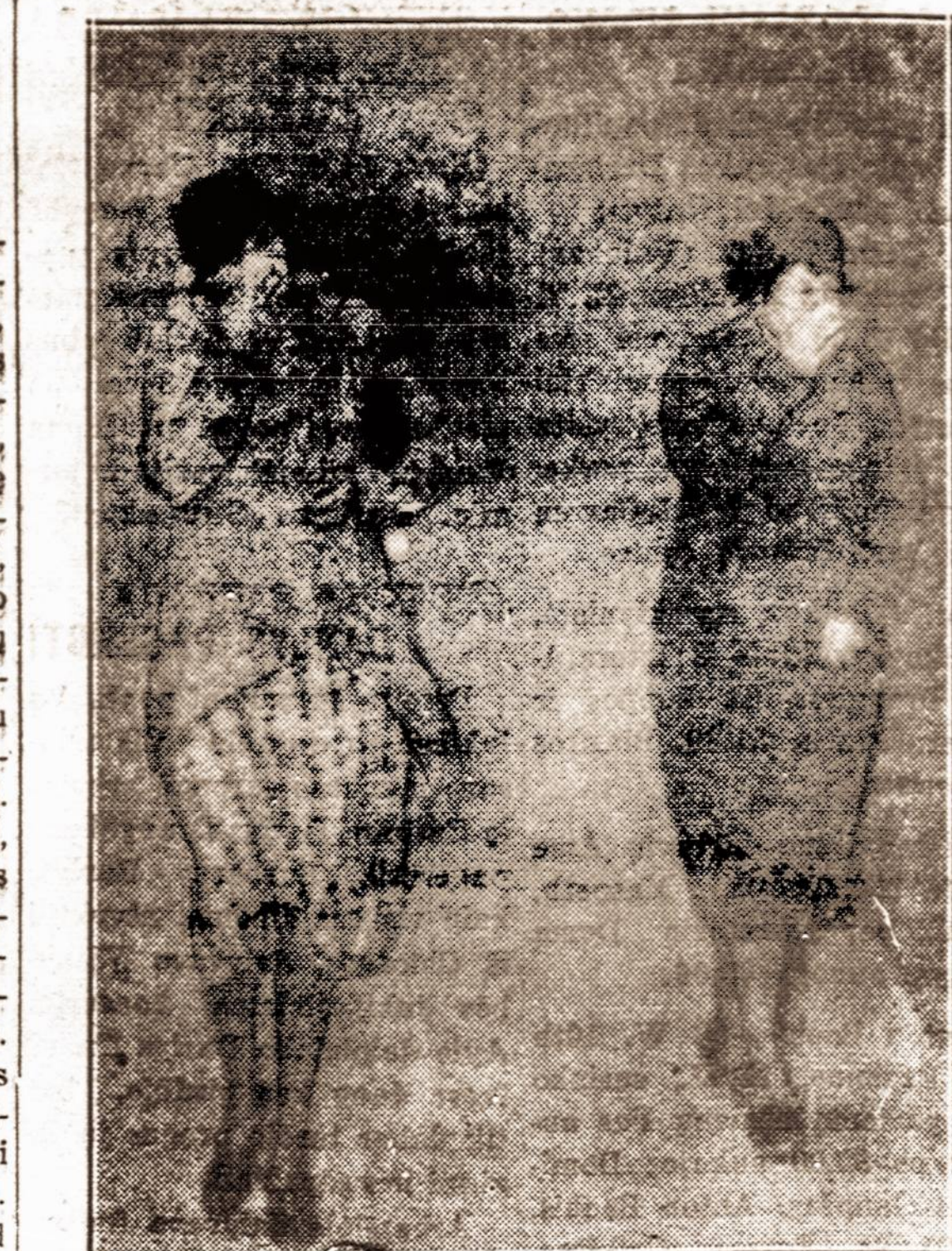
ŠALTA! — Bereitą savaitę New Yorko valstybę pasiekė sniego pūgos ir šaltiai. Užpustytose gatvėse įvyko daug nelaimių.

Bekovojant prieš įvairius imigrantų apgaudinėjimus, teko įvesti ir kitų pagerinimų. Vietoj stovėti išties valandas eilėse, laukiant patikrinimo, buvo įtaisyti suolai atsistėti. Ten lietuvių buvo apdalina- mi lietuviškais laikraščiais. Jie susėdę skaitydavo juos ir ramiai laukdavo savo eilės. Paprastai toki lietuvių imigrantai išėdavo šiek tiek sulietu- vėję ar atlietuvięję. Daugelis jų vėliau, rašydami laiškus į Lietuvą savo giminėms, juos ragindavo susiprasti ir būti lietuviams. Nuo 1900 iki 1914 metų į Jungtines Amerikos Valstybes per Ellis Island atvyko apie 200,000 lietuvių. Nemažai jų atvyko ir po karo iki buvo 1921 metais įvesta imigracijos kvota. Po pasaulinio karo laivuose tikrinant imigrantus, man tekdavo visose laivų klasėse užtikinti lietuvių. Bet jie jau buvo kitoki — save vadindavo lietuvių. Tačiau vis dar negalėjau užmiršti Kauno lenkpačių, kurie save išdidžiai užsi-rekomenduodavo lenkais, esant su pasipiktinimu tardavo lietuvių vardą. Nedaug geresni