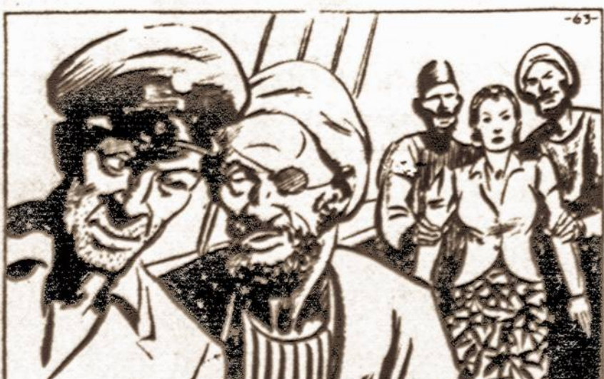
JANE WAS HALLED ON DECK WHERE ZALIM CONFERRED SECRETLY WITH SCUPPER.