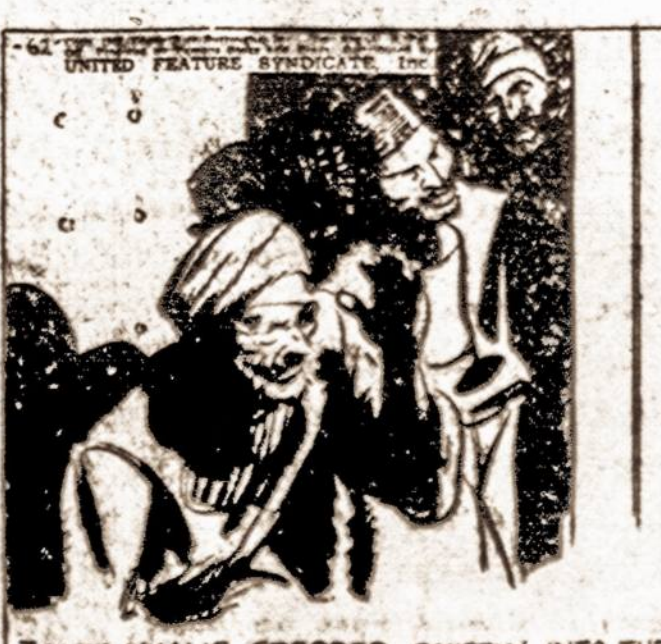
ZALIM KHALIS STEPPED QUIETLY INTO THE MAULT, FOLLOWED BY TWO MEN."