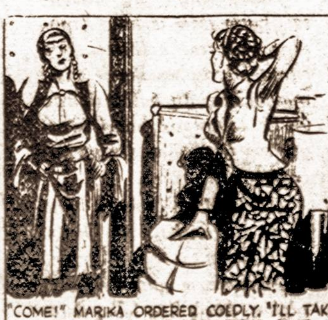
"COME! MARIKA ORDERED GOUDY, 'I'LL TAKE YOU TO TARZAN AS I PROMISED!' JANE STAGGERED DIZZILY TO HER FEET."