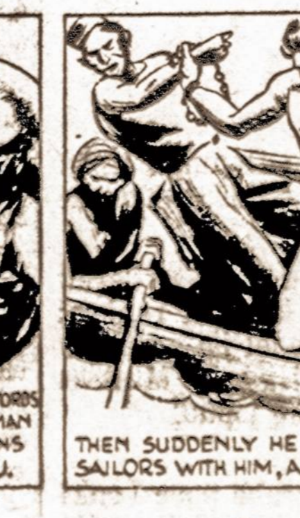
THEN SUDDENLY HE LEAPED UP, DRAGGING THE TWO SAILORS WITH HIM, AND PLUNGED INTO THE SEA!

77. — Kai nedoras jūreivis jau buvo užsimojęs perskelti Tarzanui galvą, Tarzanas garstai sušuko: "Aš įlipsiu į jūsų valtį geruoju, jei jūs pažadėsite išgelbėti beždžionę ir jai nieko nedaryti."