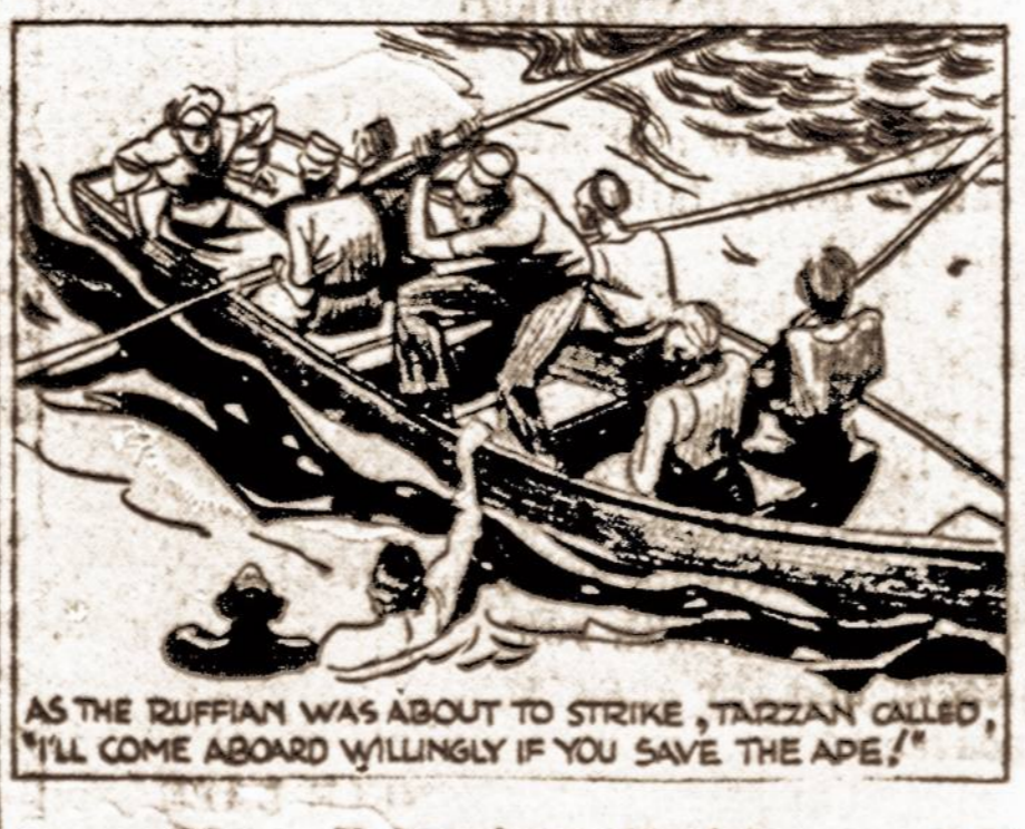
AS THE ZUFFIAN WAS ABOUT TO STRIKE, TARZAN CALLED, "HILL COME ABOARD WILLINGLY IF YOU SAVE THE APE!"