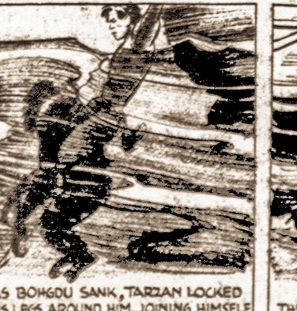
AS BOGDU SANK, TARZAN LOCKED HIS LEGS AROUND HIM, JOINING HIMSELF TO THE BEAST LIKE WELDED STEEL.