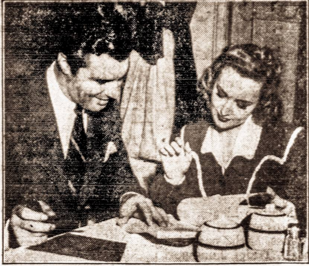
Neseniai pasižymėjęs filmų artistas James Craig ir plačiai žinoma Anne Shirley y kalbasi apie naują filmą "A certain Mr. Scratch", kurioje juodviem paskirtos vedamosios rolės.