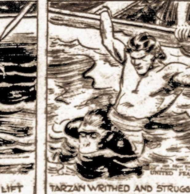
TARZAN WRITHED AND STRUGGLED, TRYING TO SWAMP THE ENEMY CRAFT.