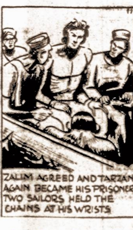
ZALIM AGREED AND TARZAN AGAIN BECAME HIS PRISONER. TWO SAILORS HELD THE CHAINS AT HIS WRISTS.