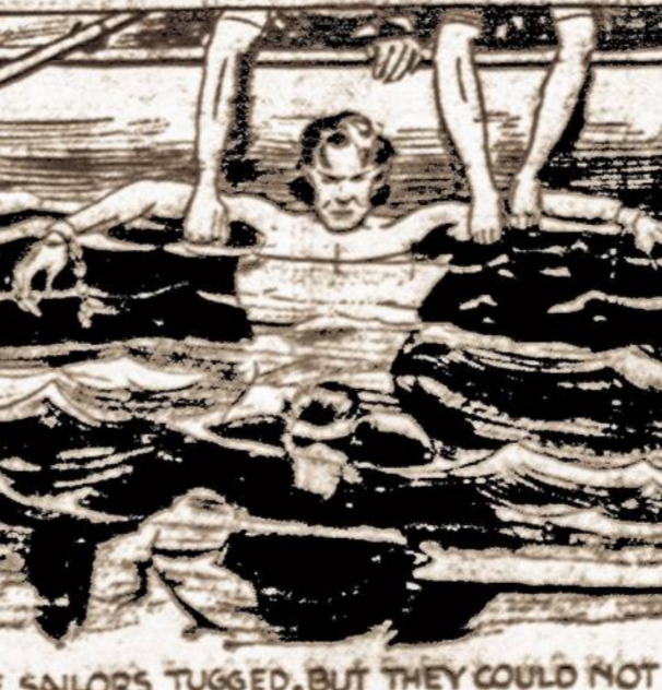
THE SAILORS TUGGED, BUT THEY COULD NOT LIFT THE COMBINED WEIGHT OF APE AND APE-MAN.