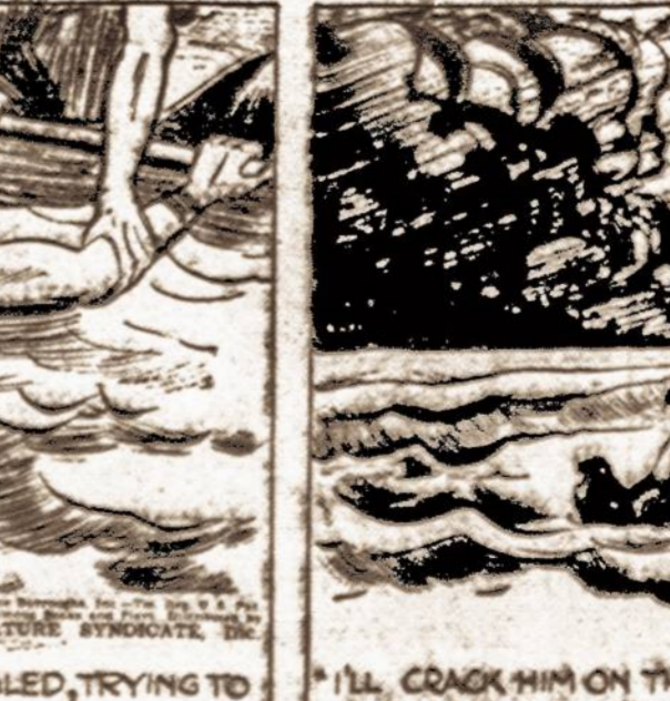
"I'LL CRACK HIM ON THE HEAD!" CRIED ONE OF THE RUFFIANS.

76. — Kai Bohgdu pradėjo skęsti, Tarzanas vandenyje jį apkabino savo stipriomis kojomis, lyg plieno replėmis, ir laikė jį kiek galėdamas. Jokia jėga negalėtų dabar atlupti jo nuo beždžionės.