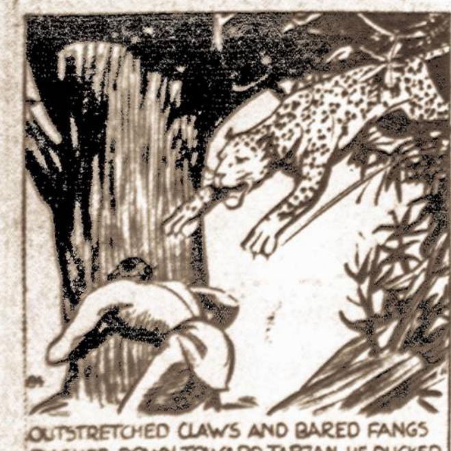
OUTSTRETCHED CLAWS AND BARED FANGS FLASHED DOWN TOWARD TARZAN. HE DUCKED.