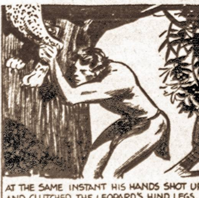
AT THE SAME INSTANT HIS HANDS SHOT UP AND CLUTCHED THE LEOPARD'S HIND LEGS.