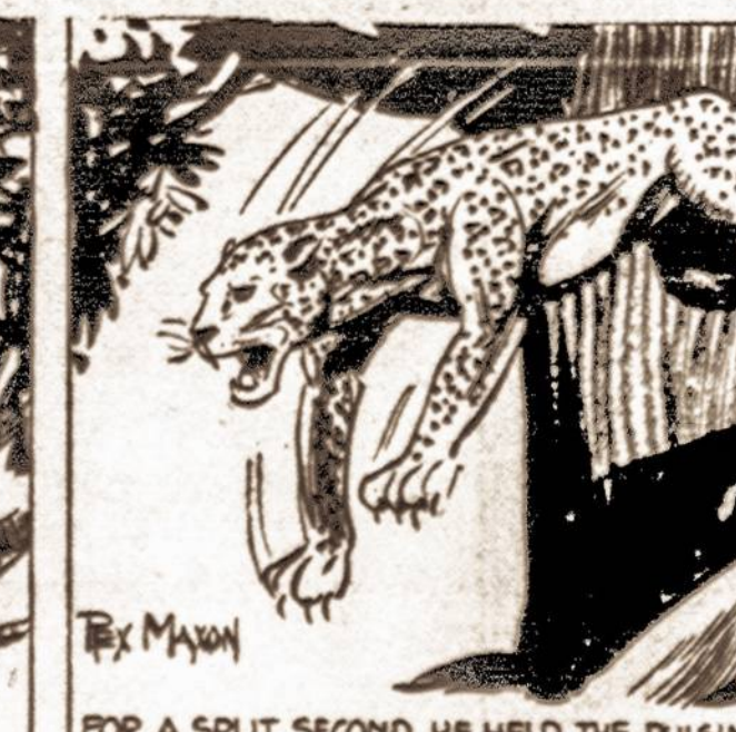
FOR A SPLIT SECOND HE HELD THE PULSING ENGINE OF DESTRUCTION. — THEN —