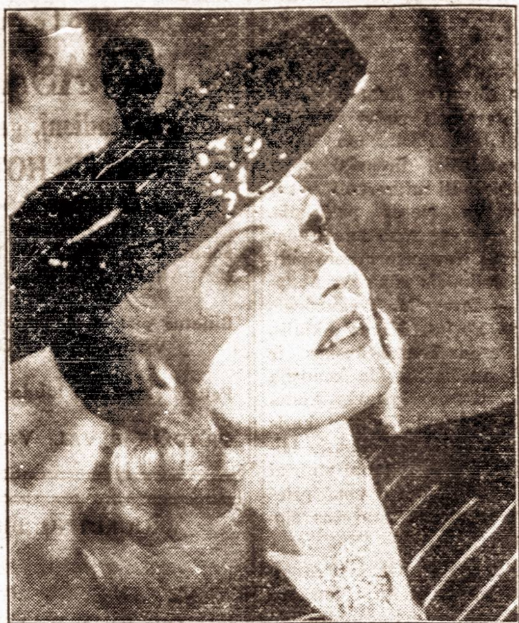
Štai jums, merginos, nauja pavasarinė skrybelaitė. Bet ar žinote, iš kokios medžiagos šita skrybelaitė yra padaryta? Ogi iš popiero. Taip, popierio, solofenu vadinamo. O, tos mados, mados...