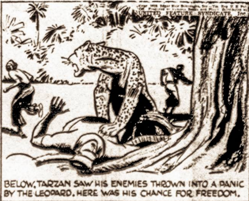
BELOW, TARZAN SAW HIS ENEMIES THROWN INTO A PANIC BY THE LEOPARD. HERE WAS HIS CHANCE FOR FREEDOM.

Krisdamas žemyn Tarzanas nenusiminė. Jis netrukus sūspėjo nusitverti kitą šaką ir susilaikyti. Paskui savo kita koja jis smarkiai spyrė jūreivii į galvą. Jūreivis nudardėjo žemyn.