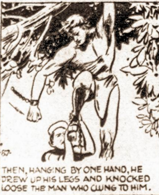
THEN, HANGING BY ONE HAND, HE DREW UP HIS LEGS AND KNOCKED LOOSE THE MAN WHO CLUNG TO HIM.

87. — Išsikibęs į Tarzano koją jūreivis staiga truktelėjo Tarzaną žemyn taip, kad Tarzanas neteko lygsvaros ir iš jo rankų išsprūdo šaka, už kurios laikėsi. Abudu pradėjo kristi žemyn!