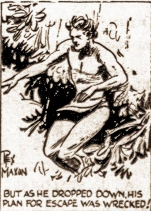
BUT AS HE DROPPED DOWN HIS PLAN FOR ESCAPE WAS WRECKED!

Iš medžio aukštumos Tarzanas matė, kaip jo priešai skubiai bėgo tolyn nuo leopardo, kuris dabar draskė iš-trenktą iš medžio jūreivį. Dabar buvo gera proga Tarzanui pasprukti.