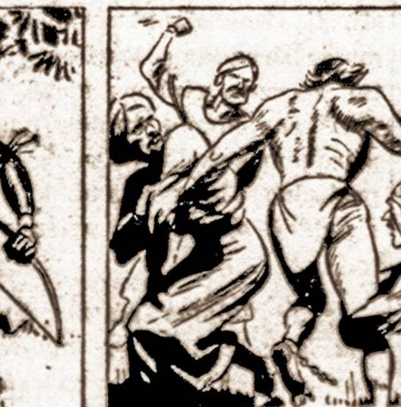
THE APE-MAN FUGHT DESPERATELY, USING HIS DANGLING CHAINS AS WEAPONS.