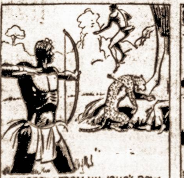
AN ARROW FROM HAWGLOO'S BOW FINISHED THE LEOPARD, THEN THE SAVAGE SAW TARZAN DROPPING DOWN.