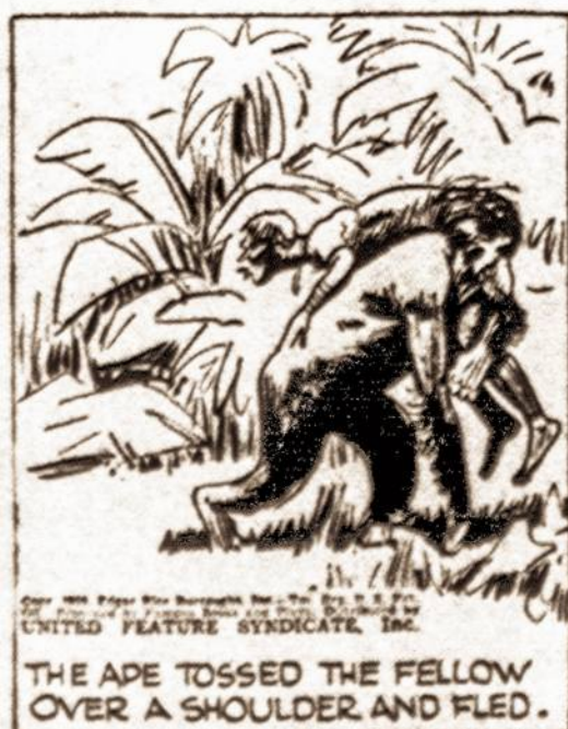
THE APE TOSSED THE FELLOW OVER A SHOULDER AND FLED.