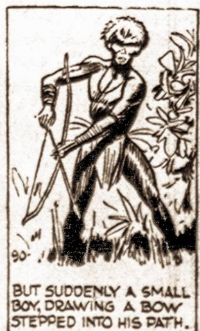
BUT SUDDENLY A SMALL BOY, DRAWING A BOW, STEPPED INTO HIS PATH.