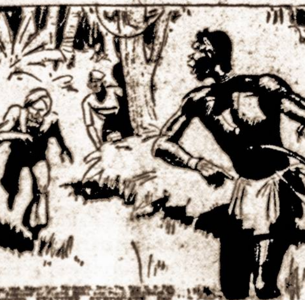
HAWGLOO CRIED OUT AND RALLIED THE RUFIANS. QUICKLY THEY ENCIRED THEIR QUARRY.