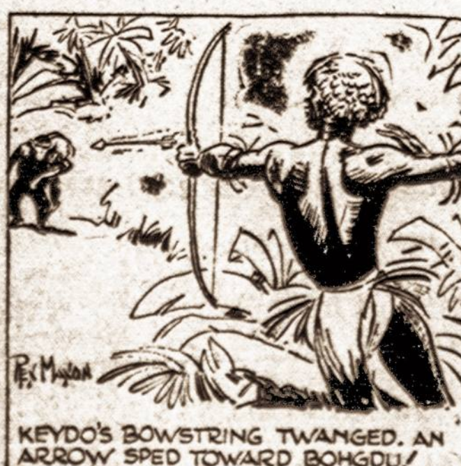
KEYO'S BOWSTRING TWANGED, AN ARROW SPED TOWARD BOHGDU.

90. — Bohgdu nepaisydamas kilusio riksmo kaime, visų savo greitumu leidosi į girią nešdamas išgąsdintą kolondietį. Net greičiausiai kaimietiai negalėjo pavyti šios milžiniškos beždžionės.