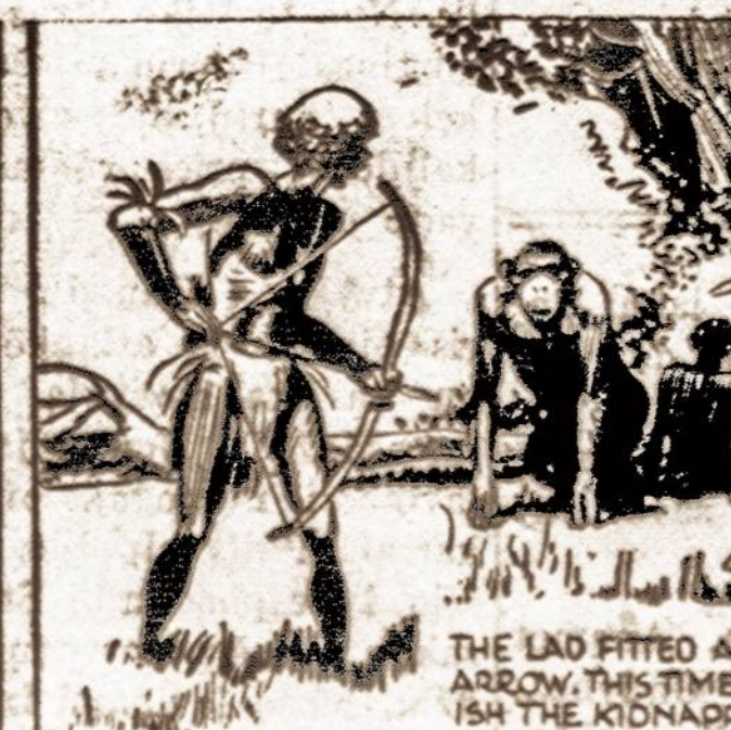
THE LAD FITTED ANOTHER ARROW, THIS TIME HE FOUND THE KIDNAPPING AID.