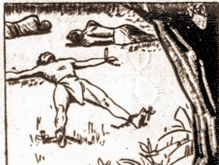
CAUTIOUSLY THE APE BORE THE BOY TO THE GROUND. THERE HE RELEASED HIM AND GESTURED TOWARD TARZAN.