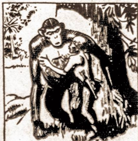
NOW KEVDO UNDERSTOOD. THE APE, TOO, WAS TARZAN'S FRIEND. THE BOY HUGGED THE GREAT BEAST.