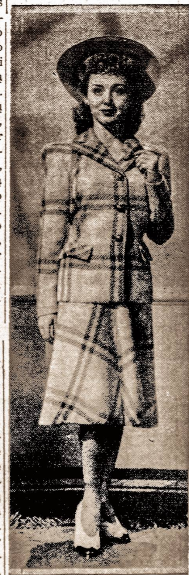
Anna Shirley, RKO filmų artistė, populiarė šio sezono kostiume, pasiūtamame iš lengvos vilnonės dryžuotos medžiagos. Anna Shirley netrukus pasirodys filmoje „The Devil an Daniel Webster“.

Meilė eina ne tiek iš pareigos, kiek iš gero išauklėto jauno. A. Smetona