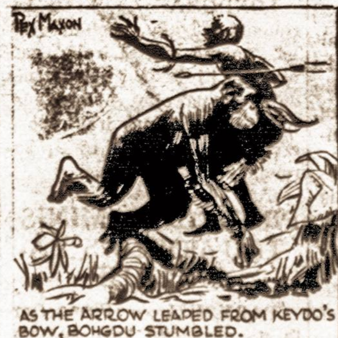
AS THE ARROW LEAPED FROM KEIDAS'S BOW, BOHGDU STUMBLLED.