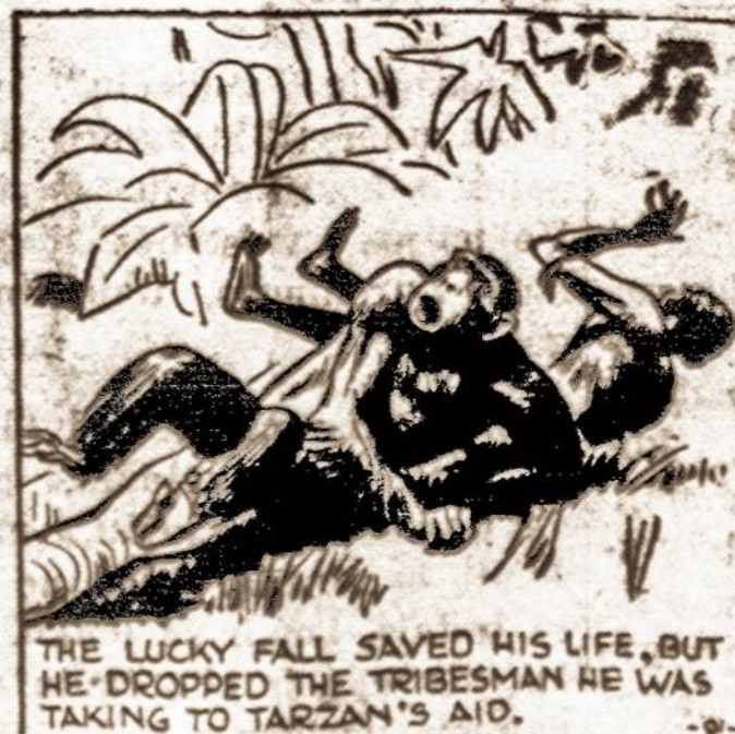
THE LUCKY FALL SAVED HIS LIFE, BUT HE DROPPED THE TRIBESMAN HE WAS TAKING TO TARZAN'S AID.