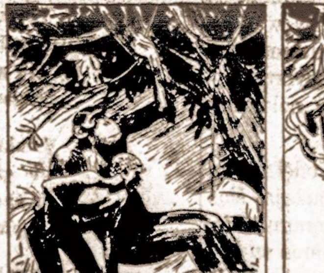
BOHGDU TOOK TO THE TREES, THE LADY FEARS ABATED IN THE THRILL OF FLYING, AS THEY TRAVELED FAR INTO THE NIGHT.