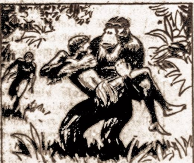
BOHGDU SWEPT KEYS INTO HIS HAIRY ARMS. THE BOY WOULD SERVE TARZAN'S PURPOSE AS WELL AS ANY OTHER.