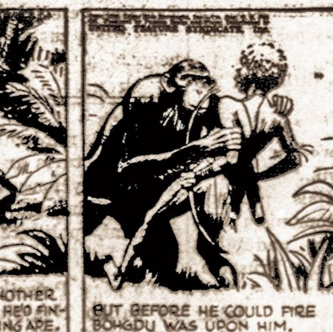
BUT BEFORE HE COULD FIRE BOHGDU WAS UPON HIM.

91. — Kaip tik Keidas, ištempęs savo lanką, paleido strėlę, Bohgdu parpuolė ant žemės, o strėlė prazvimė pro šalį. Vaikežui nepasisekė Bohgdu nudėti.