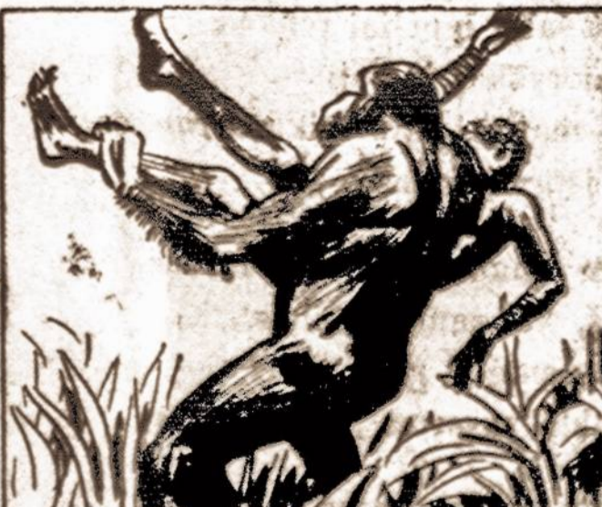
KEYDO FOUGHT LIKE A LITTLE LION, BUT THE APE HELD HIM STRONGLY.