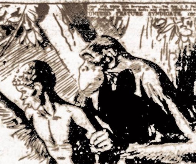
FINALLY THE APE SWERVED TOWARD A DISTANT CAMPFIRE, NEAR IT HE HALTED, KEYDO LOOKED DOWN, AGHAST AT WHAT HE SAW!

92. — Dabar Keidas tapo nelaisviu. Bohgdu iškėlė jį savo rankose ir pasileido bėgti pas Tarzaną. Kolondietį jis paliko, nes nebuvo skirtumo kuris Tarzanui pagelbės.