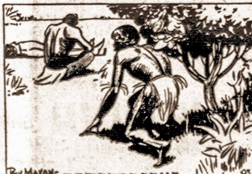
THEN KEVDO GREPT BRAVELY TOWARD TARZAN, KEEPING A WATCHFUL EYE ON THE GUARD.

93. — Apačioj Keidas pamatė savo gerą draugą Tarzaną, paimtą į nelaisvę. Iš vaikėjo krūtinės vos neišsiveržė nuogastis rinksmas, bet Bohgdū spėjo jo burną užčiaupti.