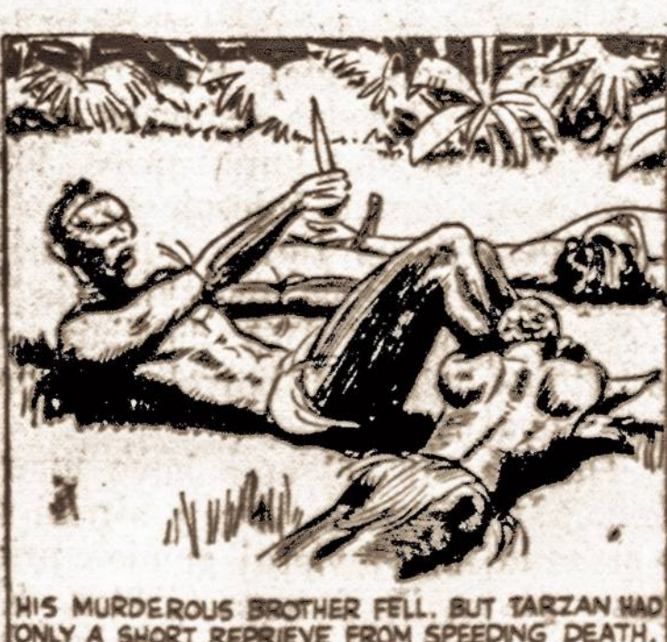
HIS MURDEROUS BROTHER FELL. BUT TARZAN HAD ONLY A SHORT REPRIEVE FROM SPEEDING DEATH.