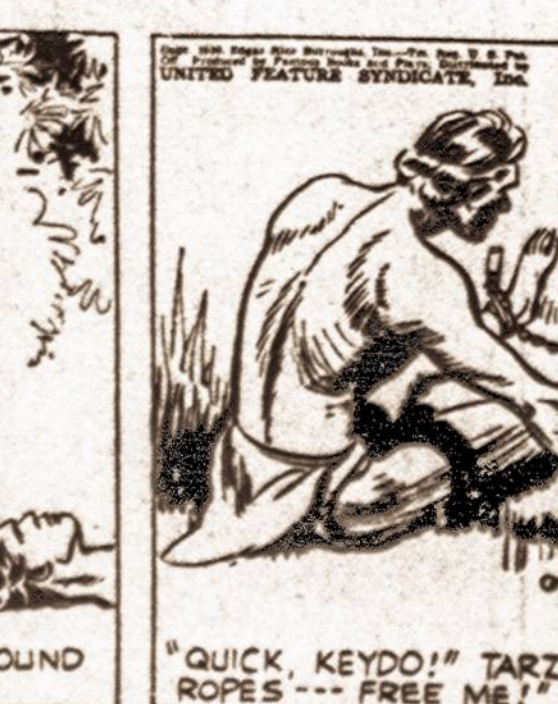
"QUICK, KEYDO!" TARZAN CALLED, "THE ROPES --- FREE ME!"