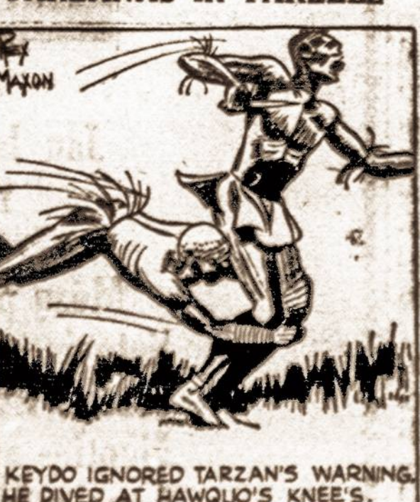
KEYDO IGNORED TARZAN'S WARNING. HE DIVED AT HAWQUO'S KNEE'S.