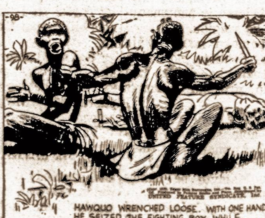
HAWQUO WRENCHED LOOSE, WITH ONE HAND HE SEIZED THE FIGHTING BOY WHILE....