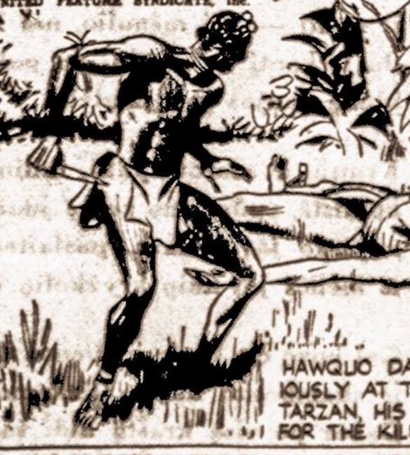
HAWQUO DASHED FURIOUSLY AT THE HELPLESS TARZAN, HIS KNIFE RAISED FOR THE KILL.