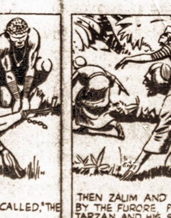
THEN ZALIM AND THE CREW AWAKENED BY THE FURRORE POUNCED UPON TARZAN AND HIS STRANGER ALLY.

Kas bus toliau — žiūrėkite kitame Vienybės numerį