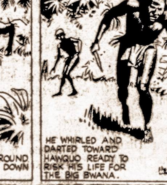
HE WHIRLED AND DARTED TOWARD HAWQUO READY TO RISK HIS LIFE FOR THE BIG BWANA.