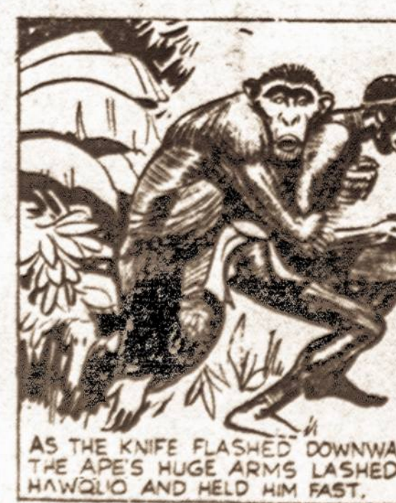
AS THE KNIFE FLASHED DOWNWARD THE APES HUGE ARMS LASHED AROUND HAWQUO AND HELD HIM FAST.