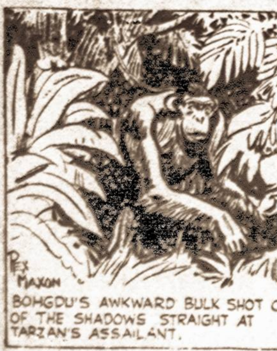
BONGDU'S ANKWARD BULK SHOT OUT OF THE SHADOWS STRAIGHT AT TARZAN'S ASSAILANT.