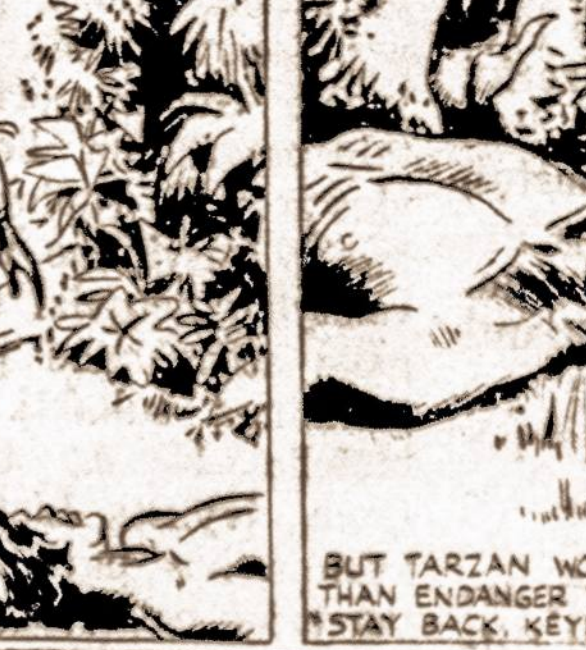
BUT TARZAN WOULD RATHER DIE THAN ENDANGER THE DEVOTED LAD. "STAY BACK, KEYDO," HE P-EN-ED.