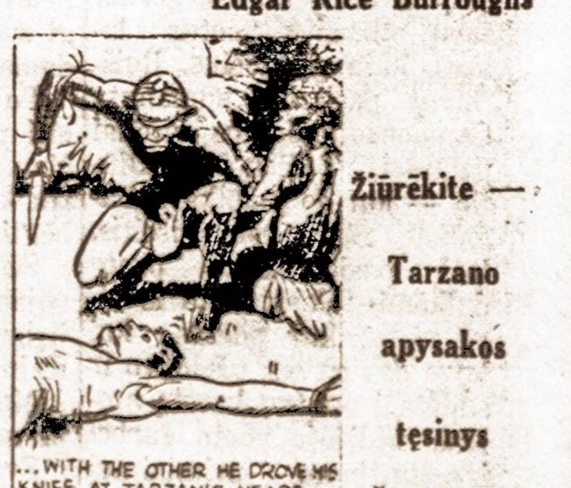
... WITH THE OTHER HE DROVE HIS KNIFE AT TARZAN'S HEART.

98 — Hawquo, besirengdamas Tarzaną nudurti, nė nepastebėjo, kad jo brolis jau čia pat. Keidas griebė Hawquą už kelių. Tai buvo drąsus žygis.