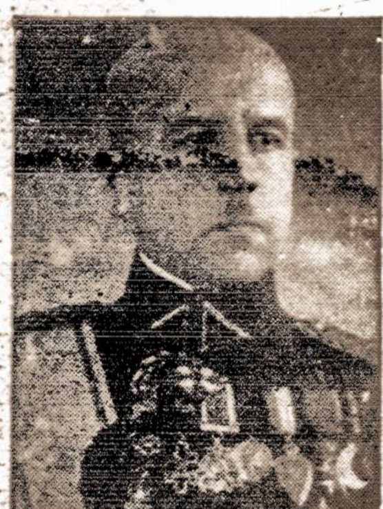
Gen. Stasys Raštikis, naujosios Lietuvos valdžios sąstato krašto apsaugos ministras. Prieš kurį laiką jis buvo pabėgęs į Vokietiją.