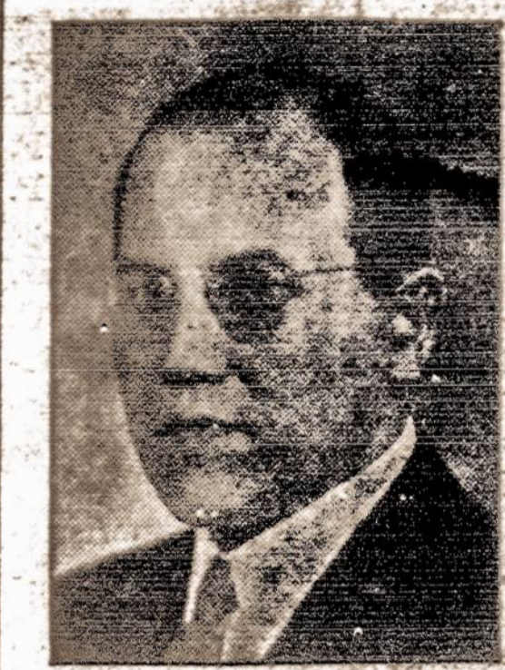
Pulk. Kazys Skirpa, naujai paskelbtos Nepriklausomos Lietuvos vyriausybės galva. Pirmiau jis buvo Lietuvos pasiuntinys Berlyne.

Hitleris, kaip skelbia nacių žinios, dabar pats rytų fronte vadovauja puolimais prieš rusus. Vokiečių agentūra sako, kad šiandien ar ryt paskelbs oficialų pranešimą apie sensacinius vokiečių laimėjimus rytų fronte.