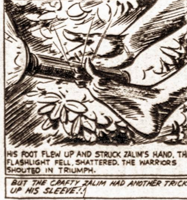
HIS FOOT FLEW UP AND STRUCK ZALIM'S HAND. THE FLASHLIGHT FELL, SHATTERED, THE WARRIORS SHOUTED IN TRIUMPH. BUT THE CRAFTY ZALIM HAD ANOTHER TRICK UP HIS SLEEVE!

129 — Iš miško netrukus išėjo vienas plėšikas, rankoje laikydamas tą stebuklingą šviesą. Pasirodė, kad tai buvo tik paprasta rankinė elektros lemputė.