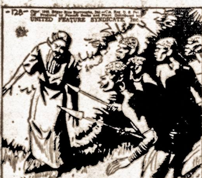
HE SAW THE "MIRACLE'S" EFFECT ON THE WARRIORS, AND TURNED IT QUICKLY TO ADVANTAGE.