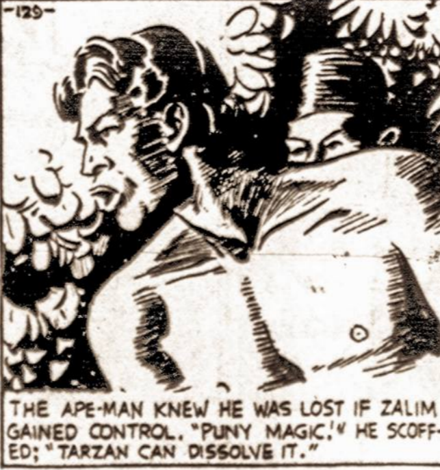
THE APE-MAN KNEW HE WAS LOST IF ZALIM GAINED CONTROL. "PUNY MAGIC!" HE SCOFFED. "TARZAN CAN DISSOLVE IT."