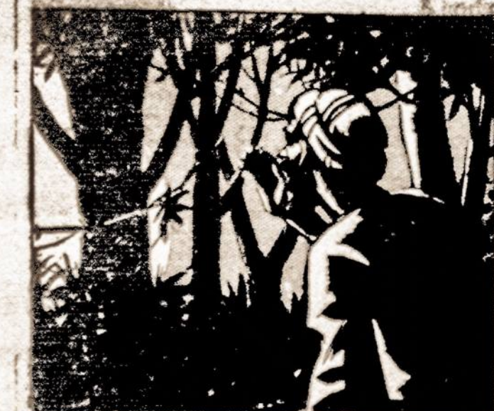
ZALIM SAW THE GLOWING LIGHT. HE CALLED INTO THE FOREST. A VOICE ANSWERED. ZALIM SMILED.