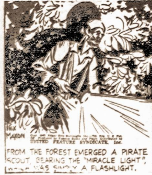
FROM THE FOREST EMERGED A PIRATE SCOUT, BEARING THE "MIRACLE LIGHT," WHICH WAS ONLY A FLASHLIGHT.