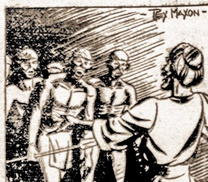
"AYE!" THE TREMBLING WARRIORS MURMURED.

128 — Zalimas pamatęs žibantią šviesą šaukė į girią. Netikėtas balsas jam kaž ką atsakė. Zalima patenkintas nusišypojo. Jo planas nuste. binti laukinius kareivius pasi. sekė.