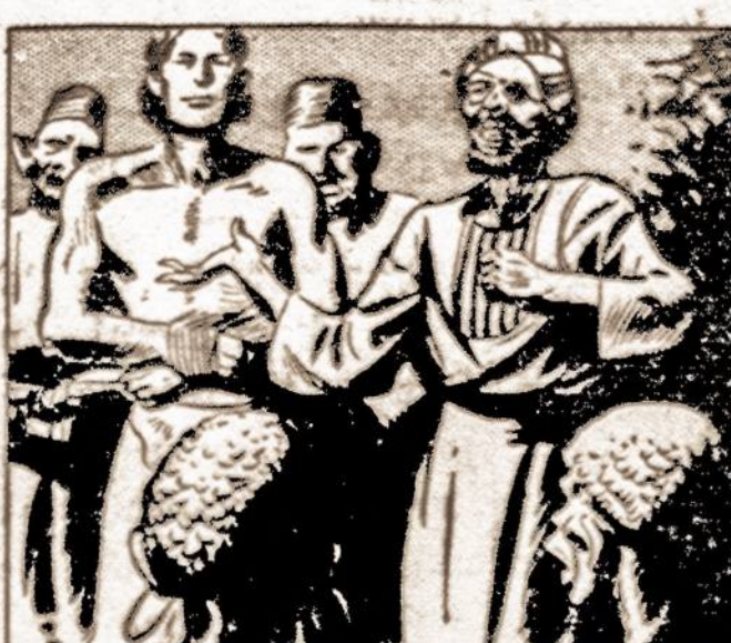
"BEHOLD THE MIGHTY MAGIC OF TARZAN'S CONQUERORS" HE SAID. "NOW WILL YOU ABANDON TARZAN AND OBEY US?"