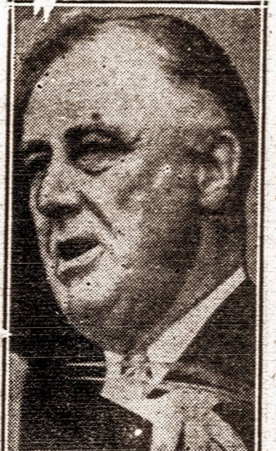
F. D. ROOSEVELT