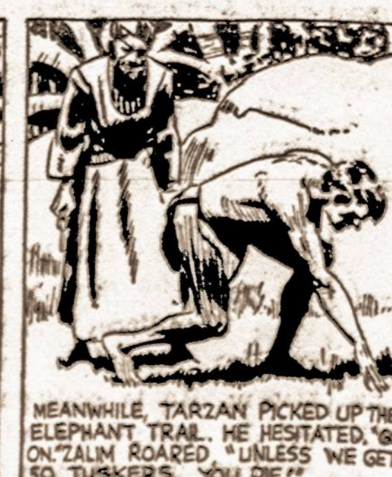
MEANWHILE, TARZAN PICKED UP THE ELEPHANT TRAIL. HE HESITATED, SO ON TALK ROARED "UNLESS WE GET SO TUSKERS, YOU DIE!"