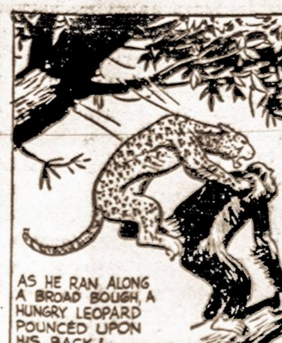
AS HE RAN ALONG A BROAD BOUGH A HUNGRY LEOPARD POUNCED UPON HIS BACK!