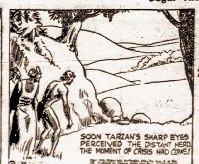
SOON TARZAN'S SHARP EYES PERCEIVED THE DISTANT HEAD THE MOMENT OF CRISIS HAD COME!

N. 149 — Boghdu buvo labai susirupinęs Tarzano likimu. Jis nė nepastebėjo, kad jo gyvybei pavojus gresė iš visai arti.