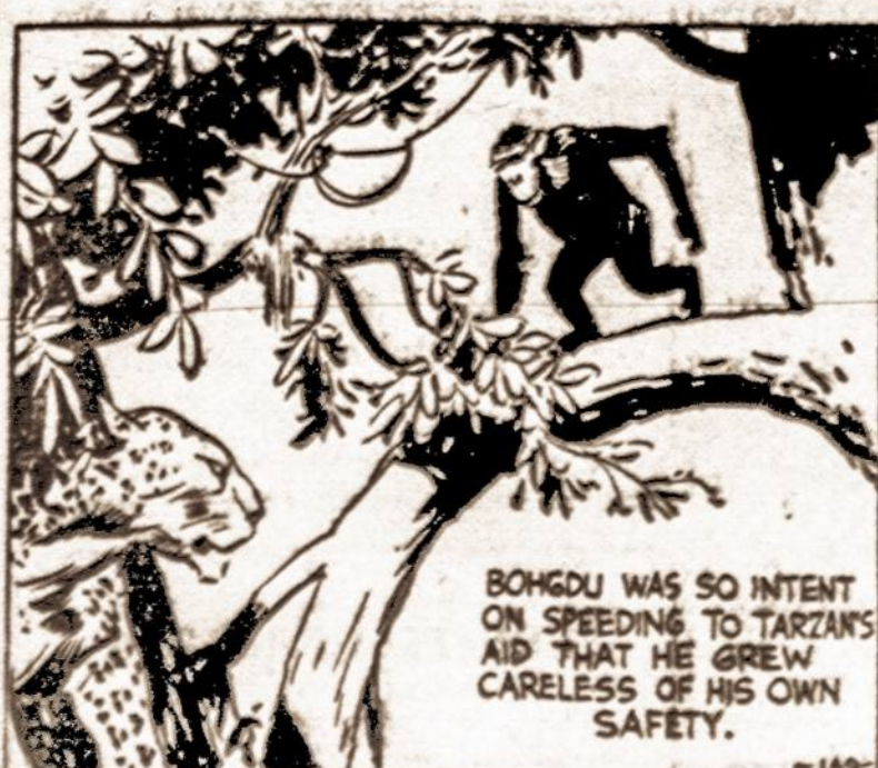
BOGHDU WAS SO INTENT ON SPEEDING TO TARZAN'S AID THAT HE GREW CARELESS OF HIS OWN SAFETY.