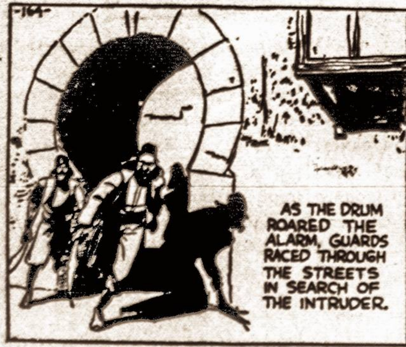
AS THE DRUM ROARED THE ALARM GUARDS RACED THROUGH THE STREETS IN SEARCH OF THE INTRUDER.