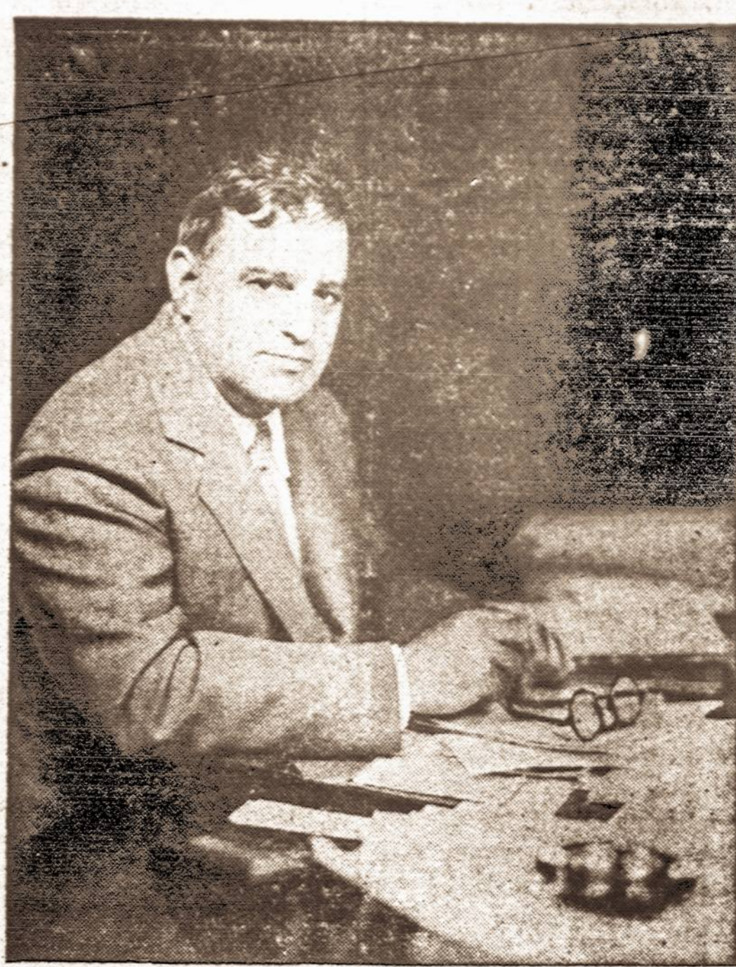
PERRINKTAS NEW YORKO MIESTO MAYORAS FIORELLO H. LA GUARDIA

Kaune ir Vilniuje steigiami specialybių kursai, kuriuos jaunimas gausiai lanko.