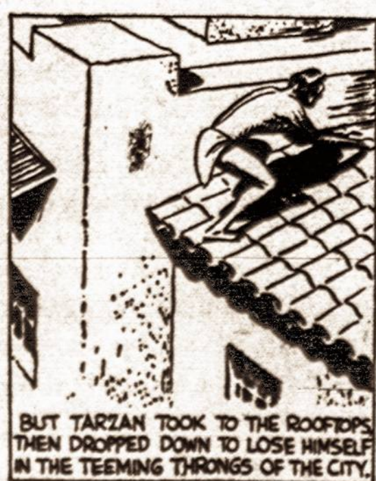
BUT TARZAN TOOK TO THE ROOFTOPS THEN DROPPED DOWN TO LOSE HIMSELF IN THE TEEMING THROGS OF THE CITY.