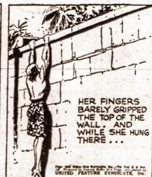
HER FINGERS BARELY GRIPPED THE TOP OF THE WALL, AND WHILE SHE HUNG THERE...