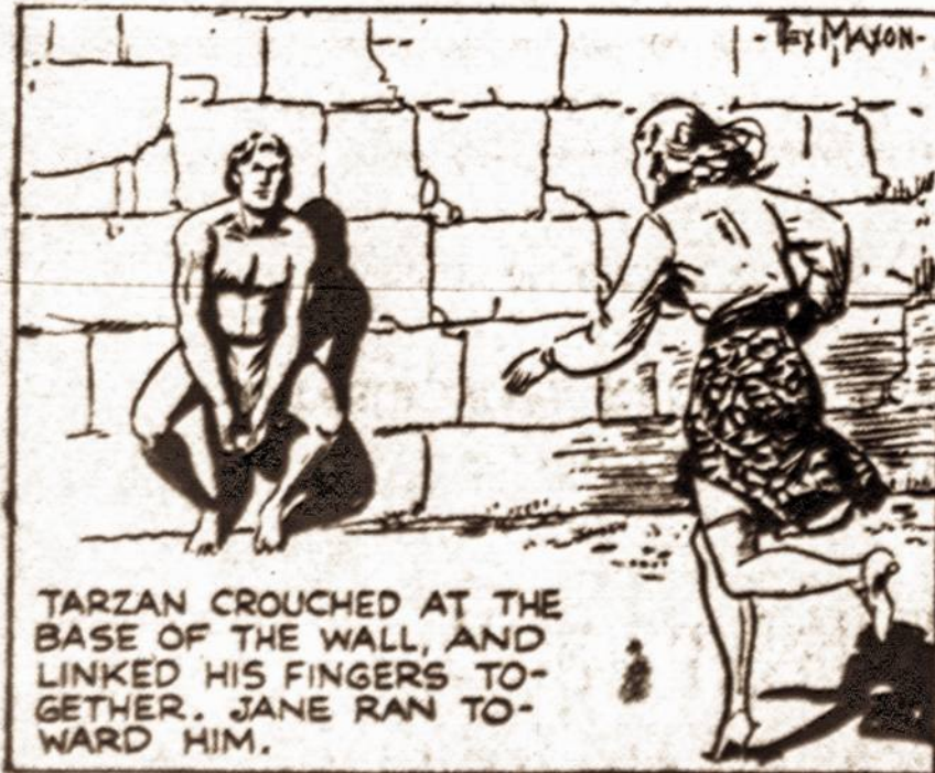
TARZAN CROUCHED AT THE BASE OF THE WALL, AND LINKED HIS FINGERS TOGETHER. JANE RAN TOWARD HIM.