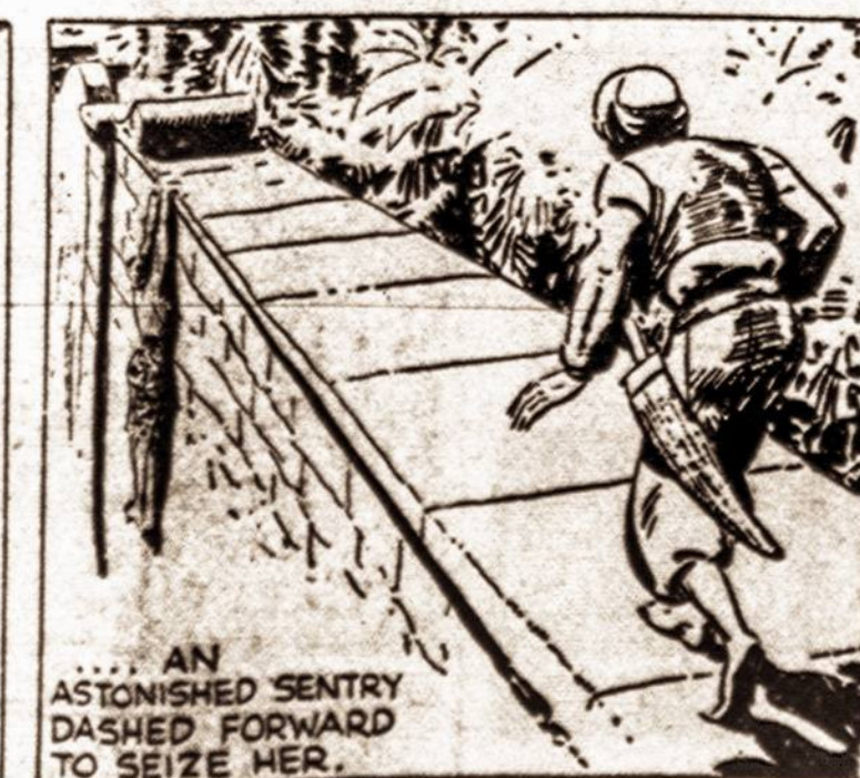
AN ASTONISHED SENTRY DASHED FORWARD TO SEIZE HER.