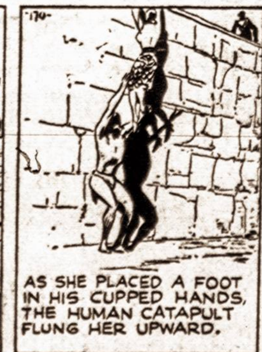
AS SHE PLACED A FOOT IN HIS CUPPED HANDS, THE HUMAN CATAPULT FLUNG HER UPWARD.