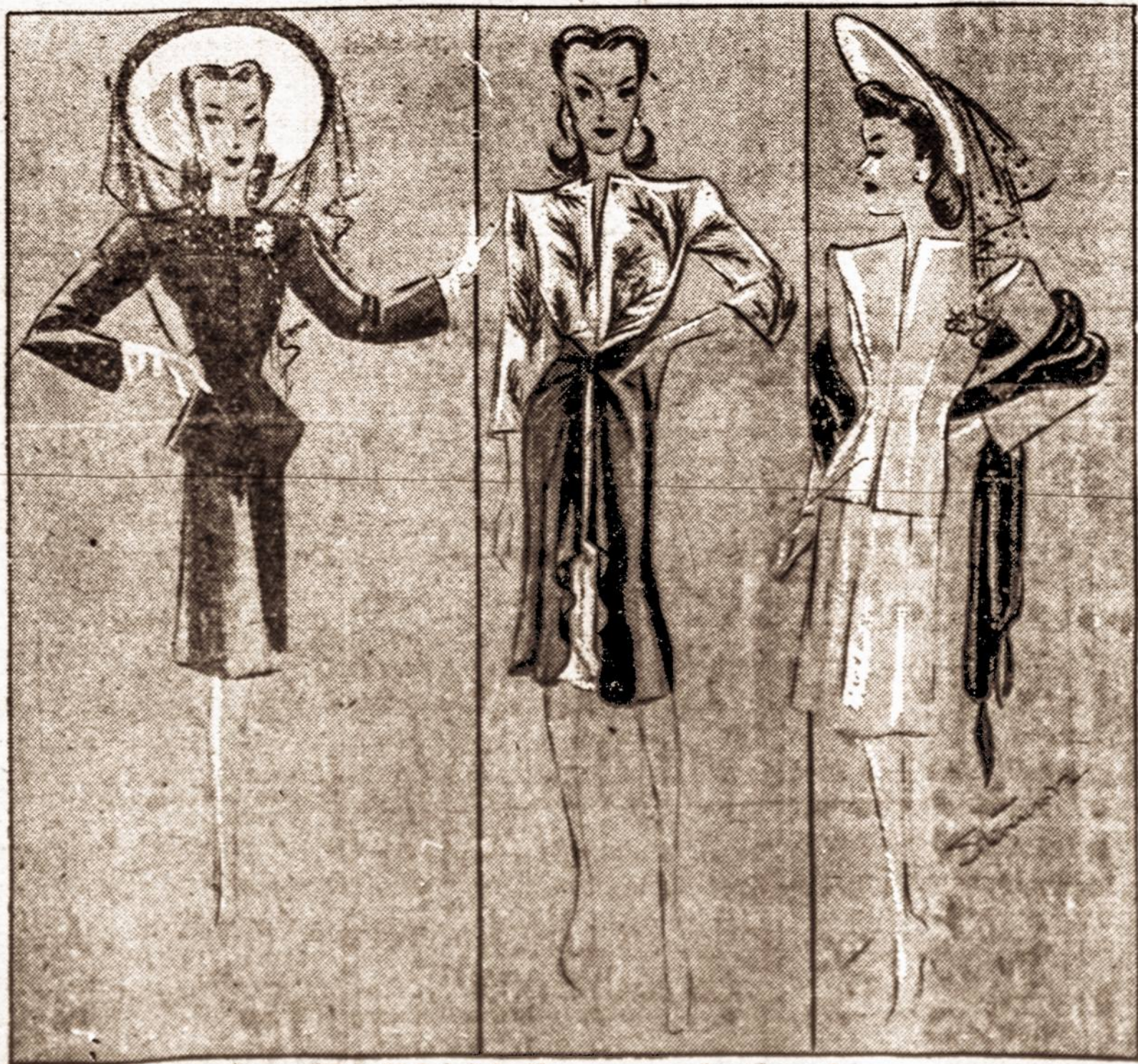
Trys elegantiški išėginiai šio sezono kostiumai