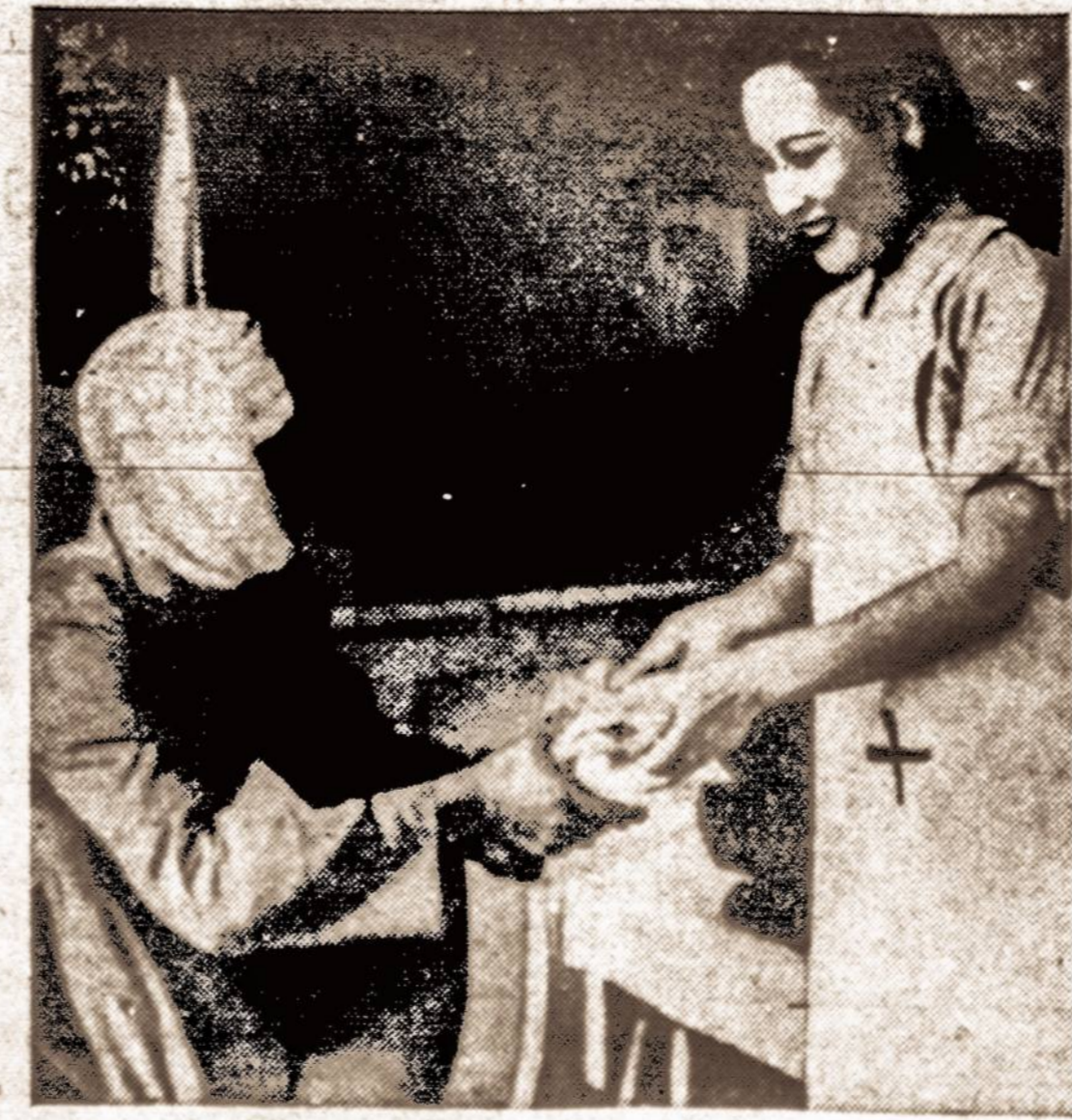
Gen. Čiang Kaišeko žmona, suteikia pirmąją pagalbą sužeistam kinų kareiviui.