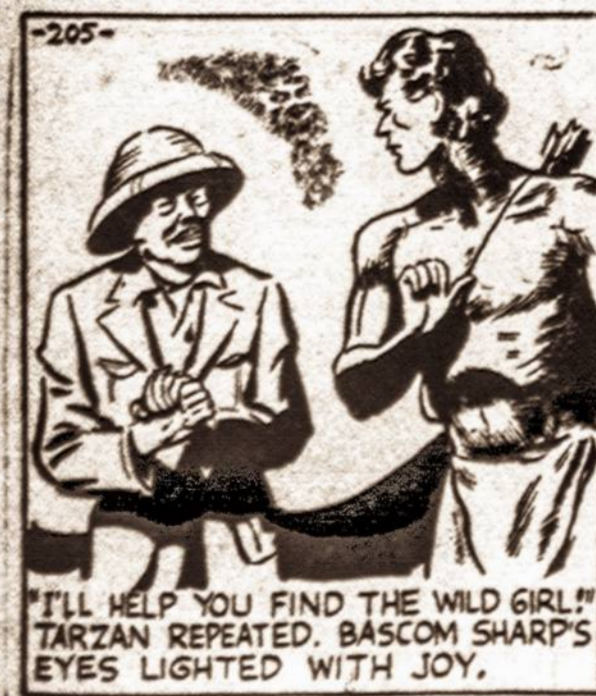
"I'LL HELP YOU FIND THE WILD GIRL!" TARZAN REPEATED. BASKOM'S SHARP EYES LIGHTED WITH JOY.