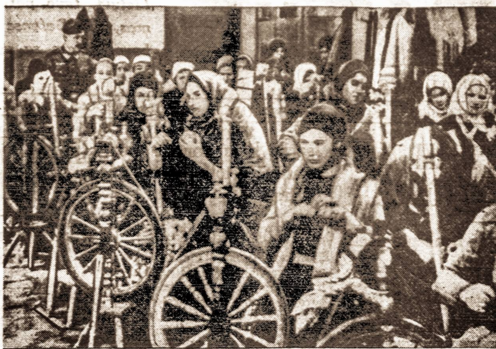
Europoje moterys prie vėdinėlių verpia siūlus, iš kurių kareiviams bus mezgiamos pirštinės ir kojines. Šis vaizdas parodo verpiančias rusų moteris.

STRAND SVETAINĖ Tinkama vieta: vestuvėms, bankietams ir kitokioms pramogoms 316 W. Broadway, SO. BOSTON, MASS.