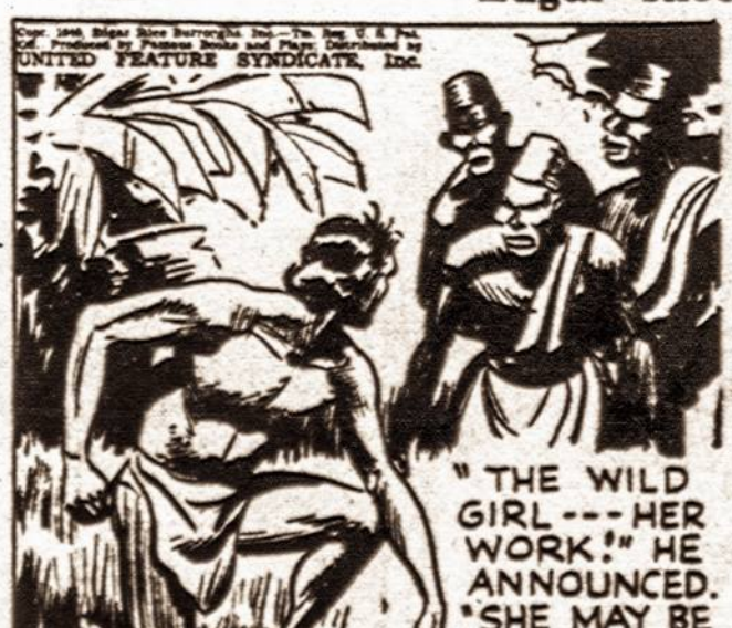
"THE WILD GIRL—HER WORK!" HE ANNOUNCED. "SHE MAY BE HERE NOW, QUICK! WE'LL CATCH HER!"

Tarzanas pamatęs įsmeigtą strėlę Butawos kareivio nugaroj greitai susėkė iš kur ji buvo paleista. Jis žvilgtelėjo aukštyn, kaip tik į tą vietą, kur Tarzelė buvo pasislėpusi.