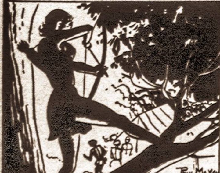
TARZELLA DREW HER BOW TAUT, TO SEND AN ARROW THROUGH TARZAN'S BREAST, BUT A SUDDEN THOUGHT STAYED HER HAND.

Tarzelė išgirdus Tarzano įsakymą Butawos kareiviams jos ieškoti pasryžo jam atkeršyti. Jos įsitikinimu — jis turi mirti. Ji buvo besirengianti jį paleisti strėlę, bet staiga mintis jos ranką sulaukė.