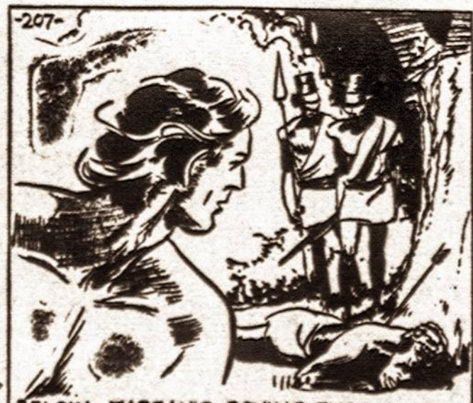
BELOW, TARZAN'S ROVING EYES SUDDENLY CENTERED ON ONE OF THE SLAIN RAIDERS. THE ANGLE OF THE ARROW INDICATED THAT IT HAD COME FROM ABOVE.

Ji nutarė, kad Tarzanui bus didesnė gėda jeigu ji atkeršys jam kitokiu būdu. Įsitikinusi, kad džiunglėse nėra geresnio žmogaus, kaip ji, Tarzelė nutarė Tarzaną apgauti.