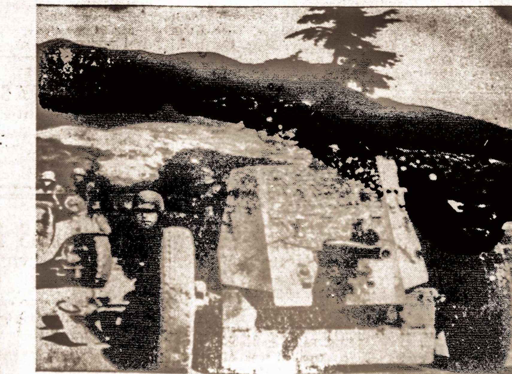
Vokiečiai Kryme. — Vokiečių pancerių dalinio kariiviai Krymo fronte Rusijoj, kur dabar eina dideli mūšiai. Vokiečiai stengiasi įsiveržti į Kaukazą, bet iki šiol jiems nepavyksta. Tuo tarpu rusai juos smarkiai muša ties Karkovu ir kituose baruose.