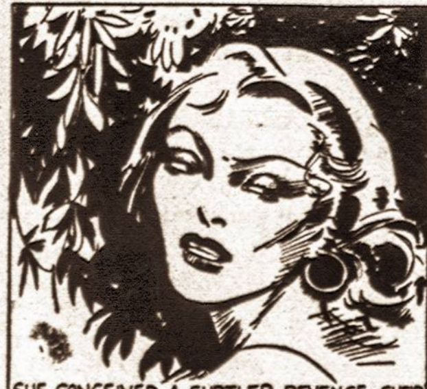
SHE CONCEIVED A SUBTLER REVENGE, SHE'D OUTWIT HIM, HUMILIATE HIM, THE WILD GIRL BELIEVED THAT IN THE JUNGLE SHE WAS SUPERME.

Tarzelė išgirdus Tarzano įsakymą Butawos kareiviams jos ieškoti pasryžo jam atkeršyti. Jos įsitikinimu — jis turi mirti. Ji buvo besirengianti jį paleisti strėlę, bet staiga mintis jos ranką sulaukė.