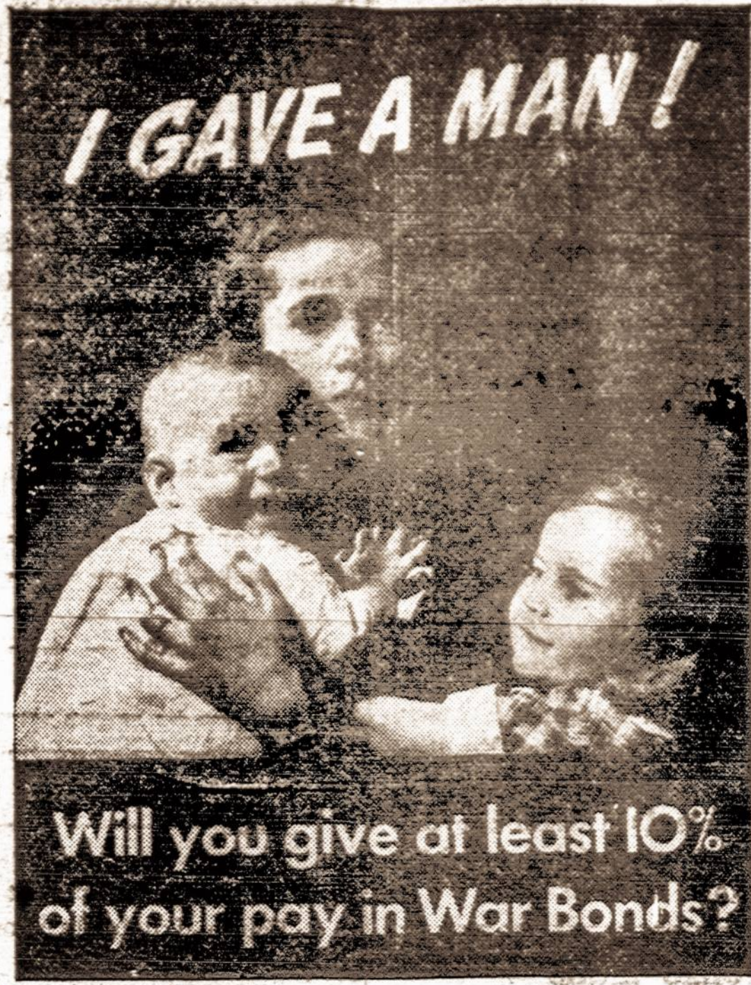
This new color poster, which soon will be used in all parts of the country to promote the sale of War Bonds and Stamps, is one of four recently created to emphasize new themes in the War Bond sales campaign.

atėjimo pratę gražiai rėdytis vyrai pradėjo vaikščioti be kaklaraiščių ir nevalyti rūbais. Atėjus Sovietams ištisos eilės žmonių apgūė konsulatų gauti vizas išvažiavimui.