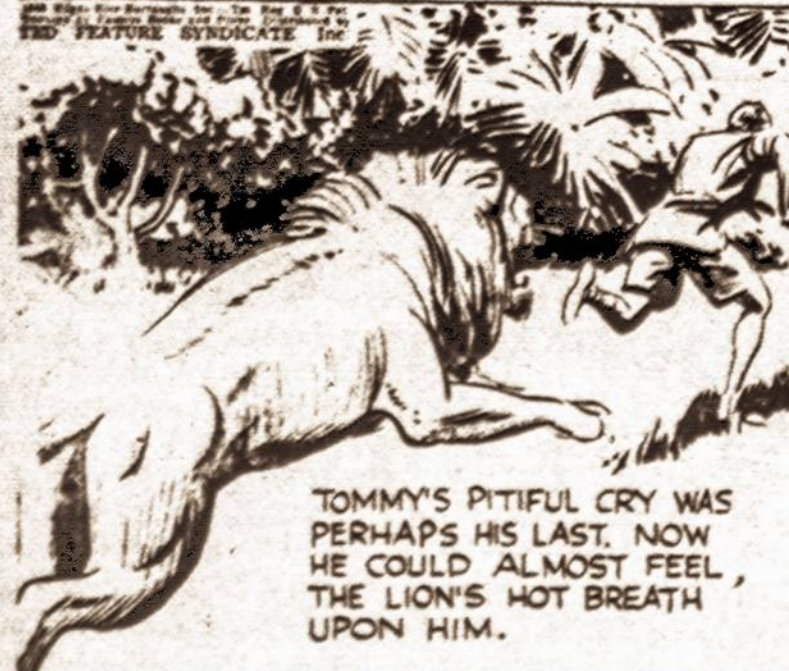
TOMMY'S PITIFUL CRY WAS PERHAPS HIS LAST. NOW HE COULD ALMOST FEEL THE LION'S HOT BREATH UPON HIM.