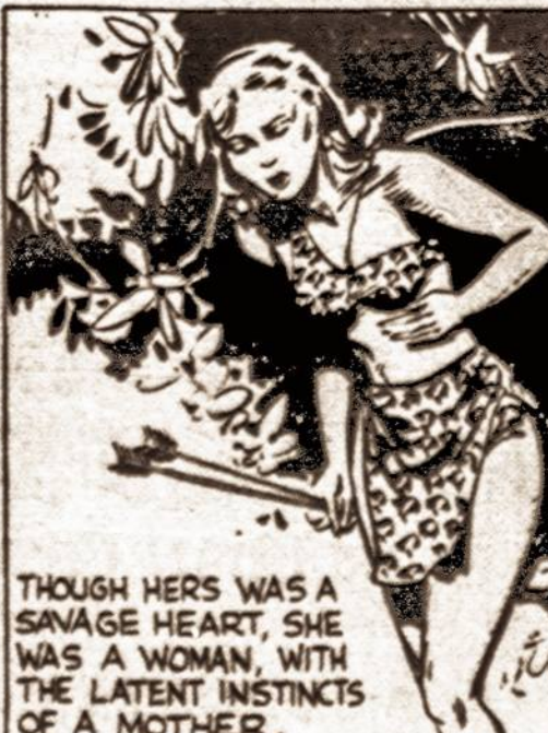
THOUGH HE WAS A SAVAGE HEART, SHE WAS A WOMAN, WITH THE LATENT INSTINCTS OF A MOTHER.