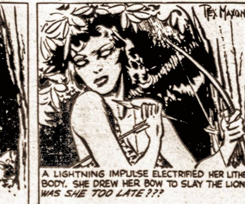
A LIGHTNING IMPULSE ELECTRIFIED HER LIKE BODY. SHE DREW HER BOW TO SLAY THE LION. WAS SHE TOO LATE???

Nelaimingas berniukas Tommy dar kartą ir, galbūt jau paskutinį, šaukėsi pagalbos. Alkanas liutas tik kelias žingsnius nuo jo buvo atsilikęs ir dabar tik stebūnais galėjo Tommy iš mirties išgelbėti.