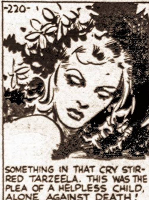
SOMETHING IN THAT CRY STIRRED TARZELLA. THIS WAS THE PLEA OF A HELPLESS CHILD, ALONE AGAINST DEATH!