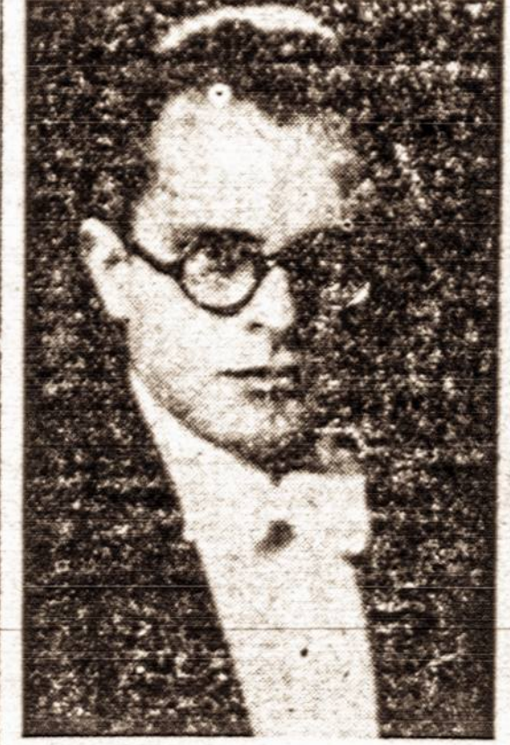
Komp. Vytautas Bacevičius

Kompozitorius ir pianistas Vytautas Bacevičius yra pakviestas skambinti Washingtonė. Jį akviete Jewish Community Center. Tai bus spalio 25 d. Be to, rugsėjo 14 d. kompozitorius Bacevičius skambins karininkų ramovėje, Music Box Canteen, 68 Fifth Ave., New Yorke.