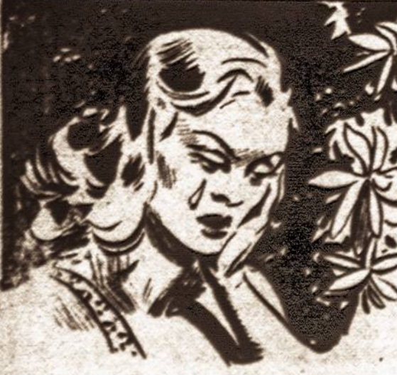
WHEN SHE LOST TOMMY'S TRAIL, TARZELA BURST INTO TEARS--TEARS OF ALARM AND ANGRY FRUSTRATION.

Tarzelė suradusi kelią, kurio Tommy nuklydo tikėjosi, kad jai pavyks netrukus jį surasti. Bet kai sutemo ji pati nuklydo nuo Tommy pėdų. Susijaudinus ir begalo susirūpiusi savo nepasisekimais ji pradėjo verkti.