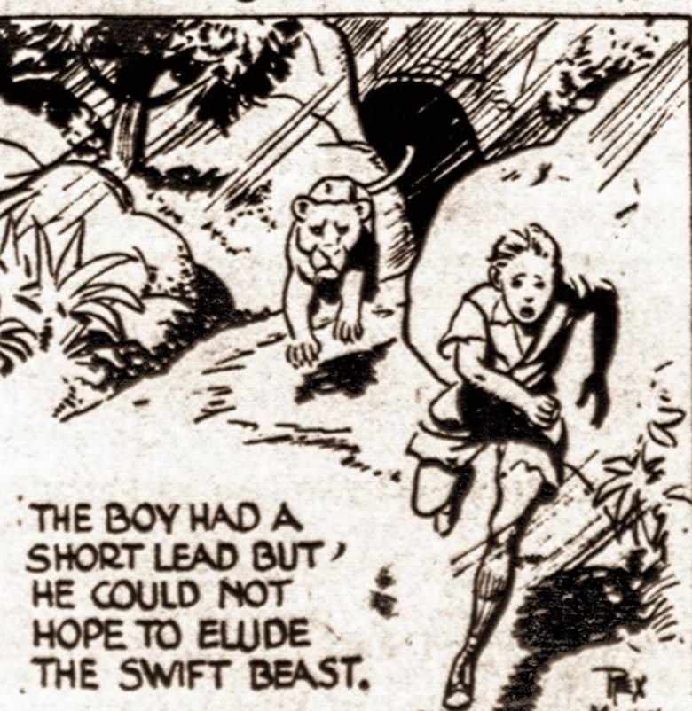
THE BOY HAD A SHORT LEAD BUT HE COULD NOT HOPE TO ELUDE THE SWIFT BEAST.