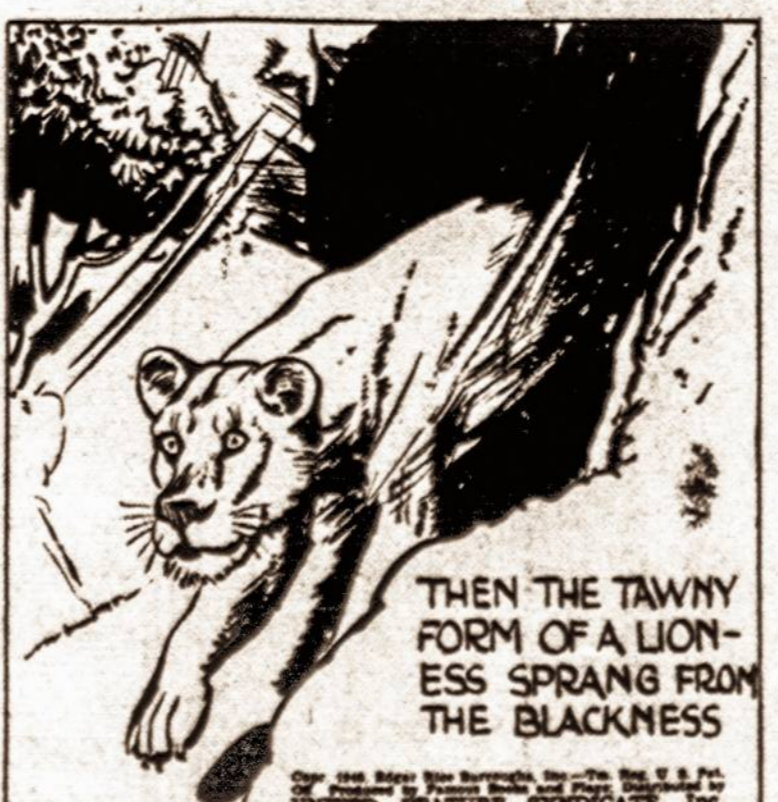
THEN THE TAWNY FORM OF A LIONESS SPRANG FROM THE BLACKNESS

Tommy, išsigandęs, garsiai suriko, apsisuko ir skubiai bėgo tolyn nuo urvo. Besislapstydamas nuo baisios dūnglių audros, Tommy, iš vienos bėdos pakliuvo į kitą, kuri tikrai buvo daug baisesnė.