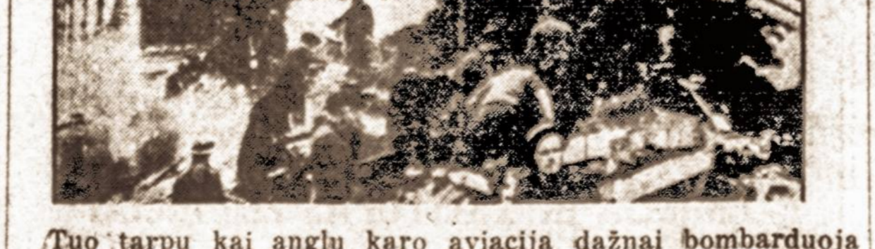
Tuo tarpu kai anglų karo aviacija dažnai bombarduoja Berlyną, kai kada vokiečių lėktuvai užpuola Londoną. Čia matyti subombarduota viena Londono mokykla.

Vokietijos generalinio komisaro įsakymu, Lietuvoje negali būti vykdoma jokia pastatymo statyba, negavus komisaro sutikimo.