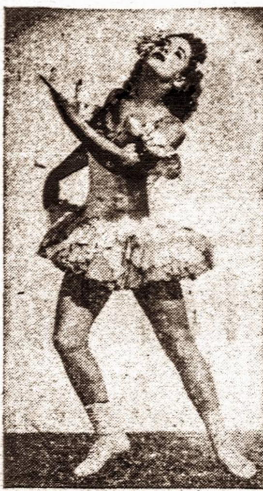
Is filmos "Stars on Ice"