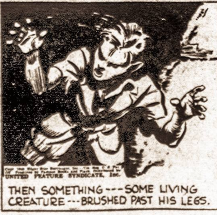
THEN SOMETHING --- SOME LIVING CREATURE --- BRUSHED PAST HIS LEGS.