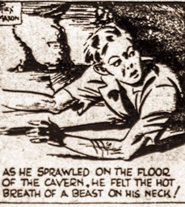
AS HE SPRAWLED ON THE FLOOR OF THE CAVERN, HE FELT THE HOT BREATH OF A BEAST ON HIS NECK!

Kas bus toliau — žiūrėkite kitame Vienybės numery