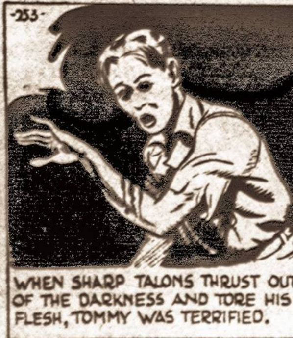
WHEN SHARP TALONS THRUST OUT OF THE DARKNESS AND TORE HIS FLESH, TOMMY WAS TERRIFIED.