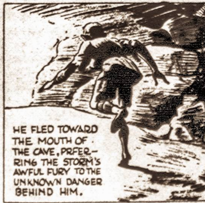
HE FLED TOWARD THE MOUTH OF THE CAVE, PREFERRING THE STORM'S AWFUL FURY TO THE UNKNOWN DANGER BEHIND HIM.