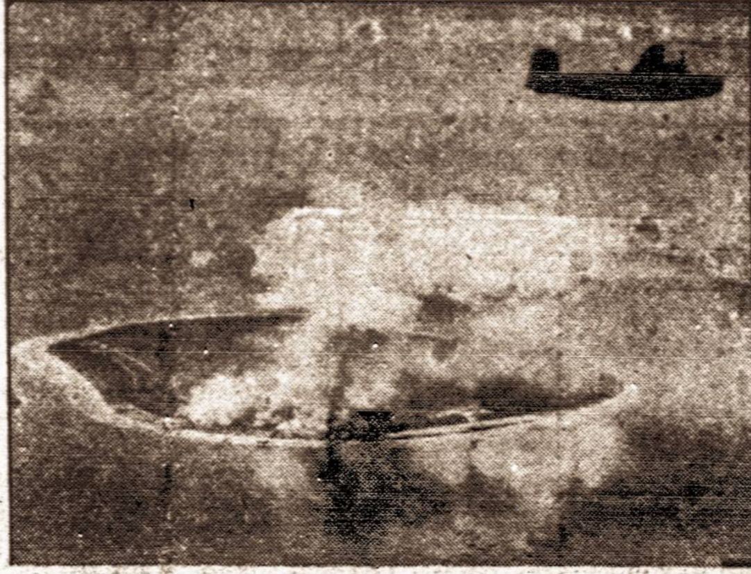
Mūsų lėktuvai bombarduoja salą Pacificke

kur italai ir vokiečiai gali privežti pagalbą Sicilijai. Jau kelinta diena, kai anglų aštuntoji armija smarkiai kausiasi su vokiečiais ties Catania, kurį priešas, matyt, bando išlaikyti. Į tą frontą barą vokiečiai ir italai gabena naujos kariuomenės, betgi anglai po truputį žygiuoja pirmyn. Paskutiniu metu alijantų parašiutininkai nusileido į šiuos uostus Catania, ardyti prieš sūsisiekimo linijas. Tuo tarpu kitose Sicilijos baruose mūsų kariuomenė žygiuoja pirmyn gana sparčiai.