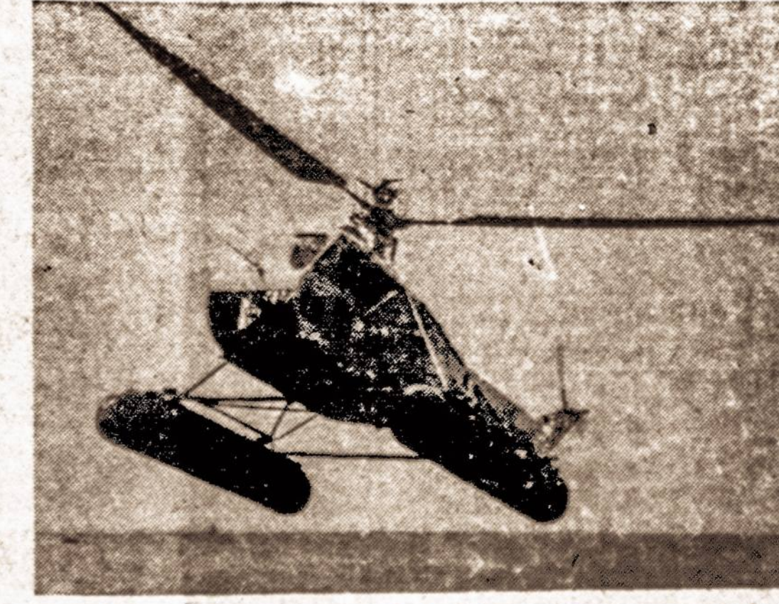
HELIKOPTERIO TIPO LĖKTUVAS, KURIS DABAR SAUGOJA MOSŲ LAIVŲ KONVOJUS

Žiūrint iš atleistųjų nuosim- čių, netinkamų karo tarnybai buvo daugiausia New Yorko valstybėje.