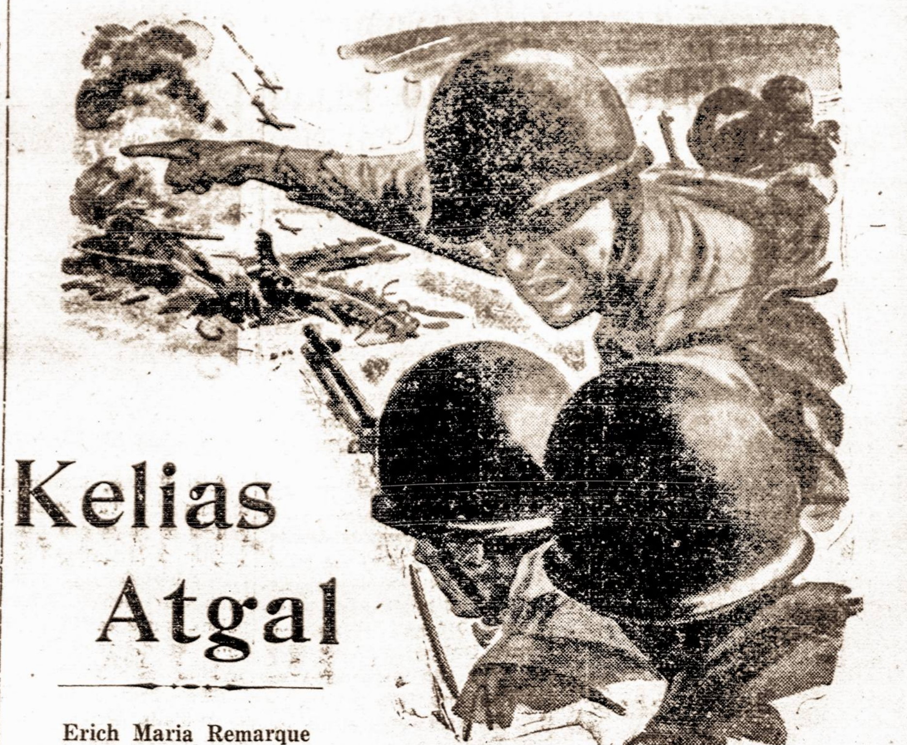
Kelias Atgal Erich Maria Remarque