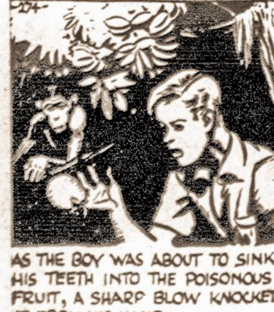
AS THE BOY WAS ABOUT TO SINK HIS TEETH INTO THE POISONOUS FRUIT, A SHARP BLOW KNOCKED IT FROM HIS HAND.