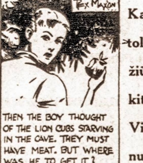
THEN THE BOY THOUGHT OF THE LION CUBS STARVING IN THE CAVE. THEY MUST HAVE MEAT. BUT WHERE WAS HE TO GET IT?

Tommy nusiskynė prinokusių vaisių ir buvo bepradėjęs kasti, tik staiga, prie jo prisloko bezdžionė, kuri nuodindama vaisių išmūšė iš jaunuolio rankos, jam nespėjus nei paragauti.