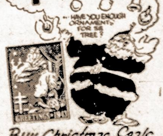
Buy Christmas Seals