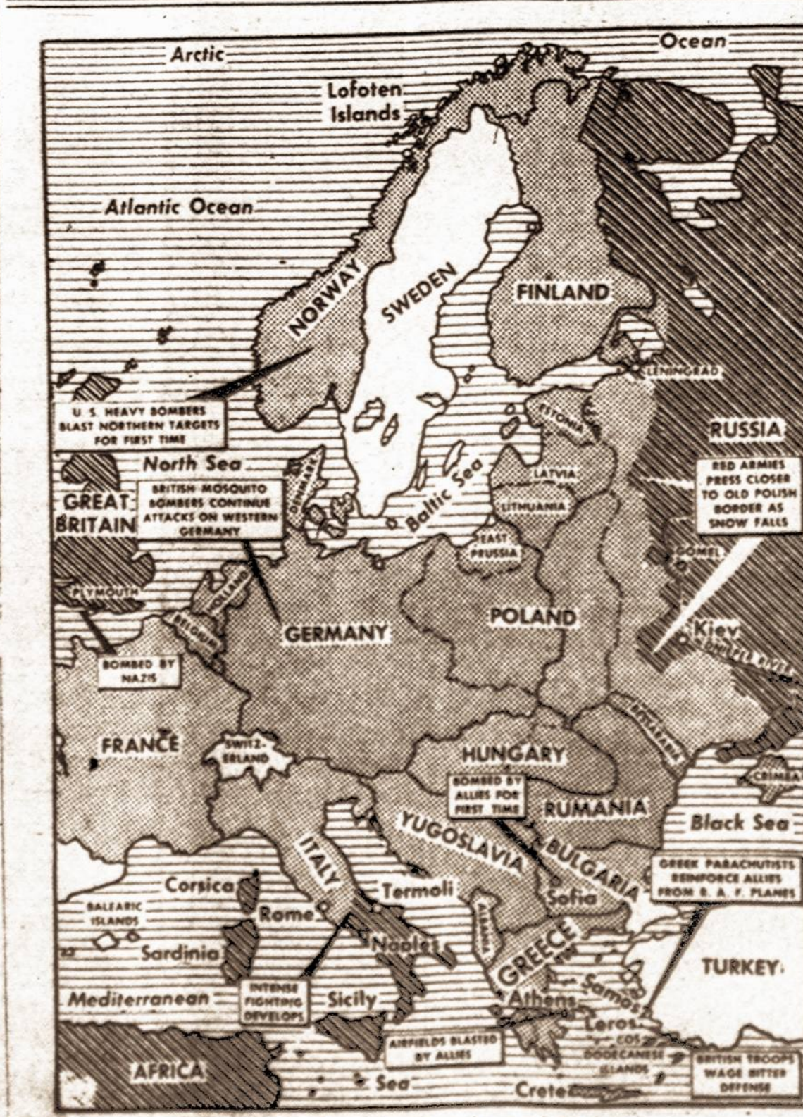
Kur mūsų lėktuvai bombarduoja priešą.